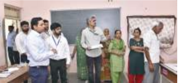
નરેન્દ્ર દવે જૂનાગઢ જિલ્લા ચૂંટણી અધિકારી અને કલેક્ટરશ્રી અનિલકુમાર શાણાવસિયાએ સ્થાનિક સ્વરાજ્યની ચૂંટણી અંતર્ગત જૂનાગઢના વડાલ ગામે મતદાન પ્રક્રિયાનું નિરીક્ષણ કરવા પહોંચ્યા હતાં. જિલ્લા ચૂંટણી અધિકારી અને કલેક્ટરશ્રીએ વડાલ ગામ ખાતેના ત્રણ મતદાન મથકોની મુલાકાત લીધી હતી, આ દરમિયાન મતદાન પ્રક્રિયાના આંકડા સહિતની વિગતોની તપાસી હતી. ઉપરાંત પ્રિસાઈડિંગ ઓફિસર અને ઉમેદવારોના એજન્ટ પાસેથી મતદાન પ્રક્રિયા વિશે તેમના પ્રતિભાવો મેળવ્યા હતા. તેમણે શાંતિપૂર્ણ અને પારદર્શક રીતે મતદાન પ્રક્રિયા ચાલી રહી છે, તેવો પ્રત્યુત્તર યક્ત કર્યો હતો. જિલ્લા ચૂંટણી અધિકારી અને કલેક્ટરશ્રીએ મતદારો સાથે પણ વાતચીત કરી તેમનો ઉત્સાહ વધાર્યો હતો. આ મુલાકાત દરમિયાન પ્રાંત અને ચૂંટણી અધિકારીશ્રી ચરણસિંહ ગોહિલ પણ ઉપસ્થિત રહ્યા હતા.