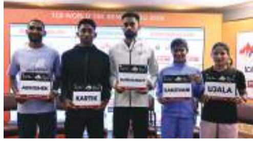
(એજન્સી) બેંગલુરુ 1 તા. 26

કર્ણાટકની રાજધાની રવિવારની વહેલી સવારે એક વિશાળ દોડનું સાક્ષી બનવા જઈ રહી છે. શહેરના મધ્ય વિસ્તારોમાં વ્યાવસાયિક દોડવીરો અને ઉત્સાહી એમેચ્યુઅલ દરિયો ઉમટી પડશે. આશરે ૩૬,૦૦૦ થી વધુ સહભાગીઓ આ મેગા ઇવેન્ટમાં ભાગ લેવા માટે સજ્જ થયા છે. આ દોડ માત્ર ફિટનેસ માટે જ નહીં, પરંતુ મોટા ઇનામો અને નવા વિક્રમો સ્થાપવા માટે પણ આકર્ષણનું કેન્દ્ર બની છે. કબન રોડથી શરૂ થનારી આ દોડ શહેરના વિવિધ વિસ્તારોમાંથી પસાર થશે.