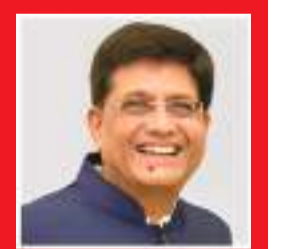
- પીયુષ ગોયલ વાણિજ્ય અને ઉદ્યોગ મંત્રી, કેન્દ્ર સરકાર

સંશોધન સહયોગ, ખેડૂતો માટે ક્ષમતા નિર્માણ, બાગાયતી વ્યવસ્થાપન પદ્ધતિઓ, લણણી પછીના સુધારાઓ, પાદ્ય સુરક્ષા પ્રણાલીઓ અને શ્રેષ્ઠતા કેન્દ્રોની સ્થાપનાનો સમાવેશ થાય છે. સફરજન ઉગાડનારાઓ માટેના પ્રોજેક્ટ્સ અને ટકાઈ મધમાખી ઉછેર પદ્ધતિઓ ઉત્પાદન અને ગુણવત્તાના ધોરણોને વધારશે, જેનાથી કૃષિ સમૃદ્ધિમાં વધારો થશે. આ સાથે જ ભારતે તેના