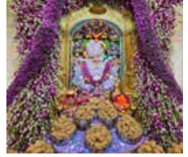
૦૫:૩૦ કલાકે મંગળા આરતી અને સવારે ૦૭:૦૦ કલાકે શણગાર આરતી પૂજારી સ્વામી દ્વારા કરવામાં આવી હતી. “આજના પવિત્ર મંગળવારે દાદાના આ દિવ્ય સ્વરૂપના દર્શન કરી હજારો હરિભક્તો એ ધન્યતા અનુભવી હતી. મંદિર પરિસર ‘જય કષ્ટભંજન’ ના નાદથી ગુંજી ઉઠ્યું હતું. અનેક શ્રદ્ધાળુઓએ દાદાના દર્શન અને અન્નકૂટના દર્શનનો ભોગ લગાડવામાં પૂર્ણ કરવાની પ્રાર્થના કરી હતી.