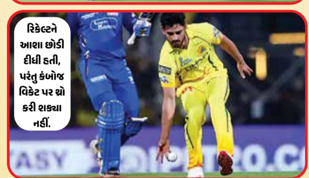
રિકેલ્ટને આશા છોડી દીધી હતી, પરંતુ કંબોજ વિકેટ પર ઘો કરી શક્યા નહીં.