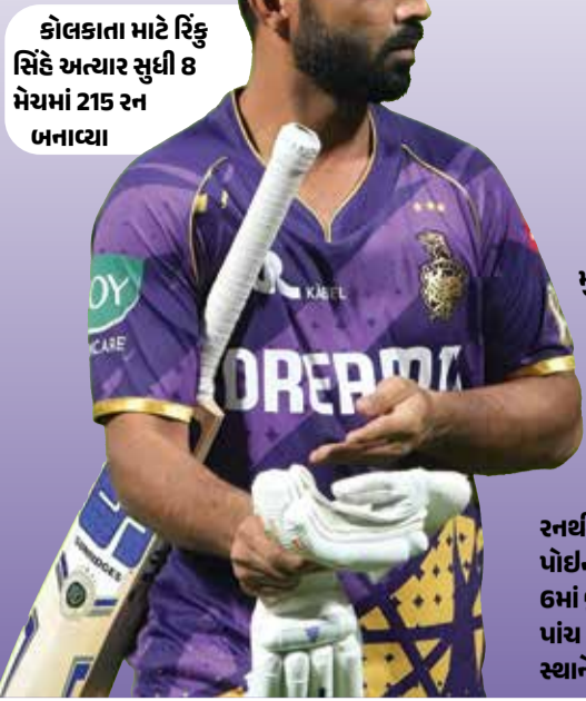
કોલકાતા માટે રિંકુ સિંહે અત્યાર સુધી 8 મેચમાં 215 રન બનાવ્યા

IPL 2026માં ગુરુવારે રોયલ ચેલેન્જર્સ બેંગલુરુના સ્વીંગ કિંગ ભુવનેશ્વર કુમારે ઈતિહાસ રચી દીધો. ગુજરાત ટાઇટન્સ સામેની મેચમાં સાઈ સુદર્શનની વિકેટ લેતાની સાથે જ ભુવી T20 ક્રિકેટમાં 350 વિકેટ પૂરી કરનારો ભારતનો પ્રથમ ફાસ્ટ બોલર બની ગયો છે. આ યાદીમાં તે લેગ સ્પિનર યુજવેન્દ્ર ચહલ પછી બીજા ક્રમે છે. ગુરુવારે રમાયેલી મેચમાં ભુવનેશ્વર કુમારે પોતાની જૂની લય બતાવતા 4 ઓવરમાં માત્ર 28 રન આપીને 3 મહત્વની વિકેટ ઝડપી હતી. તેણે સાઈ સુદર્શન ઉપરાંત વિશ્વેટક બેટિંગ કરી રહેલા શુભમન ગિલ અને જોસ બટલરને પેવેલિયન ભેગા કર્યા હતા. આ શાનદાર પ્રદર્શન સાથે ભુવીએ IPL 2026 માં કુલ 17 વિકેટ સાથે 'પર્પલ કેપ' પર પણ કબજો જમાવી લીધો છે. T20 ક્રિકેટમાં સૌથી વધુ વિકેટ લેનારા ભારતીય બોલરોની યાદીમાં યુજવેન્દ્ર ચહલ 391 વિકેટ સાથે ટોચ પર છે. ભુવનેશ્વર કુમારે પોતાની 325 મી મેચમાં 350 વિકેટનો આંકડો પાર કર્યો છે. બીજી તરફ, જસપ્રીત બુમરાહ 278 મેચમાં 347 વિકેટ સાથે ત્રીજા ક્રમે છે. જોકે, બુમરાહ સૌથી ઓછી મેચમાં આ આંકડા સુધી પહોંચનારો બોલર છે. આ મેચ દરમિયાન આરસીબીના કેપ્ટન રજત પાટીદારની વિકેટને લઈને મોટો વિવાદ સર્જાયો હતો. અરશદ ખાનના બોલ પર જેસન હોલરે ડાઈવ લગાવીને કેચ પકડ્યો હતો. લાઈવ મેચમાં એવું લાગતું હતું કે બોલ જમીન પર અચ્છો છે, પરંતુ અમ્પાયરે આઉટ આપતા આરસીબીના ખેલાડીઓ અને અમ્પાયર વચ્ચે ઉગ્ર દલીલો જોવા મળી હતી.