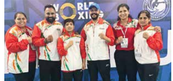
નવી દિલ્હી/તાઈપ્કે | તા. ૦૮