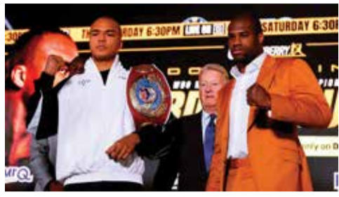
(એજન્સી) લંડન | તા. ૦૮

ડબલ્યુબીઓ હેવીવેઇટ ટાઇટલ ફાઇટમાં વર્ચસ્વની લડાઈ