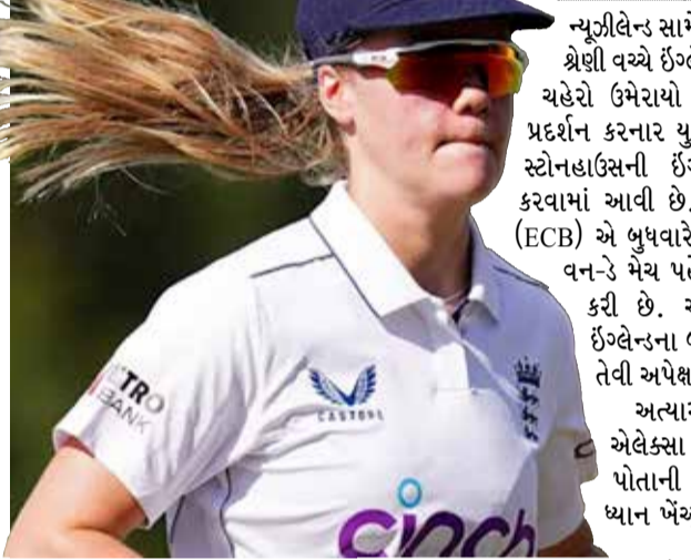
(એજન્સી) લંડન । તા. 12