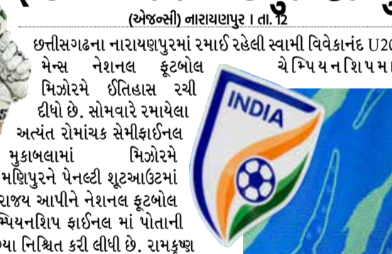
(એજન્સી) નાગાયણપુર । તા. 12

છત્તીસગઢના નાગાયણપુરમાં રમાઈ રહેલી સ્વામી વિવેકાનંદ U20 મેન્સ નેશનલ ફૂટબોલ મિઝોરમે ઈતિહાસ રચી દીધો છે. સોમવારે રમાયેલા અત્યંત રોમાંચક સેમીફાઈનલ મુકાબલામાં મિઝોરમે મણિપુરને પેનલ્ટી શૂટઆઉટમાં પરાજય આપીને નેશનલ ફૂટબોલ ચેમ્પિયનશિપ ફાઈનલ માં પોતાની જગ્યા નિશ્ચિત કરી લીધી છે. રામકૃષ્ણ મિશન આશ્રમના મેદાન પર ખેલાયેલો આ જંગ ફૂટબોલ પ્રેમીઓ માટે યાદગાર બની રહ્યો હતો.