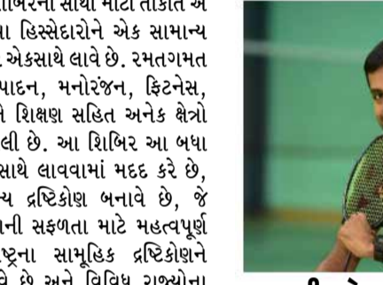
શ્રી પુલેલા ગોપીચંદ મુખ્ય કોચ, ભારતીય રાષ્ટ્રીય ઓપનિસ્ટન ટીમ

બે ચિંતન શિબિરોનો ભાગ બનવાની તક મળ્યા પછી, હું વિશ્વાસપૂર્વક કહી શકું છું કે આ ભારતીય રમતગમતમાં આજે સૌથી સમયસર અને અસરકારક પહેલ છે. આપણે આપણા રાષ્ટ્રની રમતગમત યાત્રાના એક મહત્વપૂર્ણ વળાંક પર છીએ, એક એવો સમય જ્યાં ઉદ્દેશ્ય, રોકાણ અને પ્રેરણા અભૂતપૂર્વ ગતિએ એકત્રિત થઈ રહી છે. છેલ્લા એક દાયકામાં નરેન્દ્ર મોદીના નેતૃત્વ હેઠળ, ભારતમાં રમતગમત ડાહિયામાંથી મુખ્ય પ્રવાહમાં આગળ વધી છે. તેના મહત્વ વિશે સ્પષ્ટ રાષ્ટ્રીય જાગૃતિ પણ છે, માત્ર એક સ્પર્ધાત્મક પ્રવૃત્તિ તરીકે જ નહીં, પરંતુ આરોગ્ય, શિસ્ત અને રાષ્ટ્રીય ગૌરવના સાધન તરીકે પણ. આજે, આપણે એક વિશાળ અને વૈવિધ્યસભર ઈકોસિસ્ટમ જોઈએ છીએ, જ્યાં રાજ્ય સરકારો, બિન-સરકારી સંસ્થાઓ, કોર્પોરેશનો, સંગઠનો અને પાયાના સ્તરની સંસ્થાઓ રમતગમતના વિકાસમાં સક્રિયપણે યોગદાન આપવાની વાતો