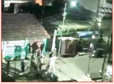
વિસ્તારમાં પેરામિલિટરી ફોર્સ તેનાત