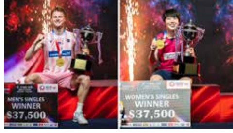
(એજન્સી) બેંગ્કોક | તા. 18

રમતગમત જગતમાં અત્યંત પ્રતિષ્ઠિત ગણાતી બેડમિન્ટન સ્પર્ધાની આખરી અને નિશ્ચાયક મેચોમાં રવિવારે ભારે ઉલટફેર જોવા મળ્યો હતો. ડેનમાર્કના મશહુર ખેલાડી એન્ટોનસેને પુરુષોની આખરી મેચમાં સ્થાનિક ફેવરિટ ખેલાડીને હરાવીને શાનદાર ટ્રોફી પોતાના નામે કરી લીધી છે. ગત વર્ષની હારનો મધુર બદલો લેતા ડેનમાર્કના આ પુરુષે કોર્ટ પર અદ્ભુત રમતનું પ્રદર્શન કર્યું હતું. આ સાથે જ મહિલાઓની સ્પર્ધામાં પણ જાપાનની દિગ્ગજ ખેલાડીએ ચીનના પડકારને ઘસ્ટ કરીને આ વર્ષનું પ્રથમ મહત્વનું સિંગલ્સ ટાઈટલ જીતી લીધું છે, જેને પગલે રમતપ્રેમીઓમાં ભારે રોમાંચ વ્યાપી ગયો છે.