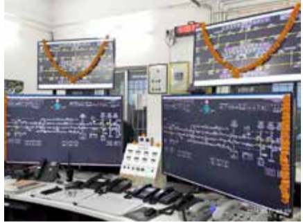
છે. 2025-2026માં NFR એ કુલ 24 ઈન્ટરલોક લેવલ ક્રોસિંગ ગેટ સ્થાપિત કર્યા છે, પાંચ પેનલ

બનાવવામાં આવ્યા છે, જે સુધારેલી સલામતી અને સરળ ટ્રેન કામગીરી માટે ઓટોમેટિક સિગ્નલિંગ સિસ્ટમ સાથે ઈન્ટરલોક કરવામાં આવ્યા છે. વધુમાં, વિભાગમાં 196 મટ્રી સેક્રાન ડિજિટલ એક્સલ ક્રોસિંગ (MSDAC) ડિટેક્ટરન પોઈન્ટ અને 40 નવા ઓટોમેટિક સિગ્નલ સ્થાપિત કરવામાં આવ્યા છે. ઓટોમેટિક બ્લોક સિગ્નલિંગ શરૂ થવાથી કટિહાર ડિવિઝન હેઠળના આ મહત્વપૂર્ણ ક્રોસિંગમાં લાઈન ક્ષમતામાં નોંધપાત્ર વધારો થશે, સમયસરતામાં સુધારો થશે અને સુરક્ષિત અને વધુ કાર્યક્ષમ ટ્રેન ગતિવિધિઓ સુનિશ્ચિત થશે. ઉત્તરપૂર્વ સરહદી રેલ્વેએ તાજેતરના વર્ષોમાં તેના નેટવર્કમાં મોટા સિગ્નલિંગ અને સલામતી વધારવાના કાર્યો હાથ ધર્યાં