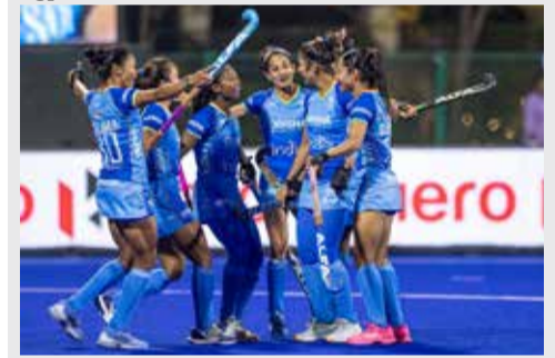
(એજન્સી) નવી દિલ્હી | તા. 18

હોકી ઈન્ડિયાએ ઓસ્ટ્રેલિયાના પ્રતિષ્ઠિત પ્રવાસ માટે સોમવારે સત્તાવાર રીતે બાવીસ સભ્યોની મજબૂત ભારતીય મહિલા હોકી ટીમની જાહેરાત કરી દીધી છે. મહિલા હોકી ટીમ પસંદગી પ્રક્રિયામાં અનુભવી ખેલાડીઓ અને ઉભરતી પ્રતિભાઓ વચ્ચે અદભુત સંતુલન જાળવવામાં આવ્યું છે. આગામી રફ મે થી ૩૦ મે દરમિયાન ઓસ્ટ્રેલિયાના પર્થ હોકી સ્ટેડિયમ ખાતે ચાર મેચોની મહત્વપૂર્ણ શ્રેણી રમાશે. મીડિયા અહેવાલ અનુસાર, આ પ્રવાસનો મુખ્ય હેતુ આગામી જૂન મહિનામાં ન્યૂઝીલેન્ડના ઓકલેન્ડ ખાતે યોજાનારા નેશન્સ કપ માટે ભારતીય ખેલાડીઓને સંપૂર્ણ રીતે તૈયાર કરવાનો છે.