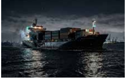
જહાજો પર કરવામાં આવ્યા હતા. આ બંને નુકસાન પામેલા જહાજોમાંથી એક માશલ આઈલેન્ડ્સના ધ્વજ હેઠળ અને બીજું ગિની-બિસાઉના ધ્વજ સાથે દરિયાઈ સફર પર આગળ વધી રહ્યું હતું.

(એજન્સી) મોસ્કો/બેઇજિંગ । તા. 20 રશિયાના પ્રમુખ વ્લાદિમીર પુતિન પોતાના અત્યંત મહત્વપૂર્ણ અને સત્તાવાર પ્રવાસે ચીનના પ્રમુખ શી જિનપિંગને મળવા બેઇજિંગ પહોંચે તેના બરાબર એક દિવસ પહેલાં જ કાળા સમુદ્ર (બ્લેક સી) ના વિસ્તારમાં એક બહુ મોટો વૈશ્વિક રાજદ્વારી તણાવ અને સનસનાટીપૂર્ણ ઘટના સામે આવી છે. કાળા સમુદ્રમાં યુકેનના બંદરો તરફ આગળ વધી રહેલા બે મોટા નાગરિક કાર્ગો જહાજો પર રશિયન સેનાએ રાત્રિના અંધારામાં ઘાતક ડ્રોન હુમલા કર્યા છે, જેમાં સૌથી ચોકવાતનારી અને આંતરરાષ્ટ્રીય સ્તરે ડોબાળો મથાવનારી બાબત છે છે કે તેમાંથી એક જહાજ સીધું ચીનની માલિકીનું હોવાનું સામે આવ્યું છે. યુકેનની સત્તાવાર સી પોર્ટલ ઓરિયોટી દ્વારા જાણી કરાયેલા અહેવાલ મુજબ, સોમવારે આ ભીષણ હુમલા ઓરિસા વિસ્તારના વ્યૂહાત્મક બંદરો તરફ અનાજ અને અન્ય સામગ્રી માટે આગળ વધી રહેલા કમર્શિયલ નાગરિક