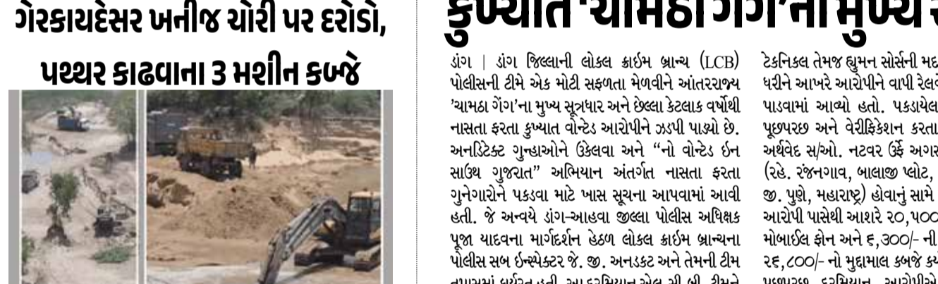
(એજન્સી) જામનગર | તા.20