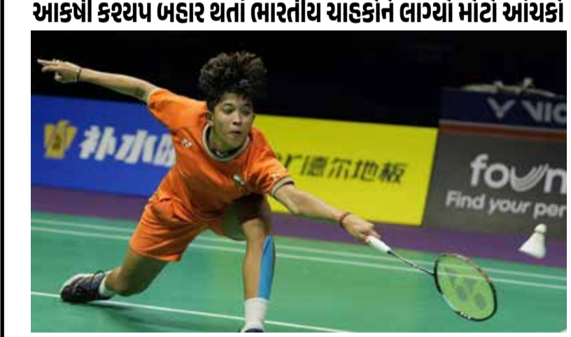
કુઆલાલંપુર । તા. 20

મલેશિયાની રાજધાની કુઆલાલંપુરમાં રમાઈ રહેલી પ્રતિષ્ઠિત મલેશિયા માસ્ટર્સ ૨૦૨૬ સુપર ૫૦૦ બેડમિન્ટન ટૂર્નામેન્ટમાં ભારતીય રમતવીરો માટે મંગળવારનો દિવસ મિશ્ર પરિણામો લઈને આવ્યો છે. મહિલા સિંગલ્સના ક્વોલિફિકેશન મુકાબલામાં અસ્મિતાએ પ્રથમ ગેમ ગુમાવ્યા બાદ શાનદાર ધુનરાગમન કરીને ૨૧-૨૩, ૨૧-૧૬, ૨૧-૧૬ થી મેચ પોતાના નામે કરી લીધી હતી. મુખ્ય ડ્રોના પ્રથમ રાઉન્ડમાં હવે તેનો મુકાબલો ઈન્ડોનેશિયાની ચાલિતા રામધાની વિરોધી રમવાનો સામે થશે. જોકે, ભારતની બીજી આશાસ્પદ ખેલાડી આકર્ષી કશ્યપ બહાર થઈ ગઈ છે, જેને કોરિયાની પાર્ક ઇ યુન સામે ૨૧-૧૫, ૨૦-૨૨, ૨૦-૨૧ થી હારનો સામનો કરવો પડ્યો હતો. ચલિદાએ ચાઈનીઝ તાઈપેઈની મજબૂત ખેલાડી પાઈ યુ-પો સામે ત્રણ ગેમ સુધી ચાલેલી અત્યંત રસાક્સી ભરેલી મેચમાં વિજય મેળવ્યો હતો. ૫૬ મિનિટ સુધી ચાલેલા આ હાઈ-વોલ્ટેજ ક્વોલિફિકેશન મુકાબલામાં અસ્મિતાએ પ્રથમ ગેમ ગુમાવ્યા બાદ શાનદાર ધુનરાગમન કરીને ૨૧-૨૩, ૨૧-૧૬, ૨૧-૧૬ થી મેચ પોતાના નામે કરી લીધી હતી. મુખ્ય ડ્રોના પ્રથમ રાઉન્ડમાં હવે તેનો મુકાબલો ઈન્ડોનેશિયાની ચાલિતા રામધાની વિરોધી રમવાનો સામે થશે. જોકે, ભારતની બીજી આશાસ્પદ ખેલાડી આકર્ષી કશ્યપ બહાર થઈ ગઈ છે, જેને કોરિયાની પાર્ક ઇ યુન સામે ૨૧-૧૫, ૨૦-૨૨, ૨૦-૨૧ થી હારનો સામનો કરવો પડ્યો હતો.