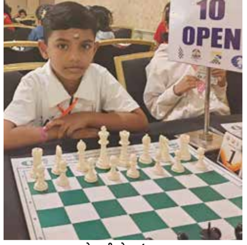
(એજન્સી) ચેન્નઈ । તા. 20

અંડર-10 ઓપન ટાઇટલ મેળવી આઠ વર્ષના બાળકે ઇતિહાસ રચ્યો