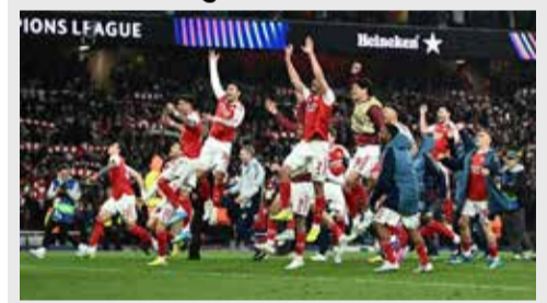
(એજન્સી) લંડન । તા. 20

વૈશ્વિક ફુટબોલ જગતની સૌથી પ્રતિષ્ઠિત અને રોમાંચક ગણાતી ઈંગ્લિશ પ્રીમિયર લીગની વર્તમાન સીઝનનો વિજેતા નક્કી થઈ ગયો છે. બુધવારે રમાયેલા હાઈ-વોલ્ટેજ મુકાબલામાં બોર્નમાઉથ સામે માન્ચેસ્ટર સિટી ૧-૧ થી રમીને પોઈન્ટ ગુમાવતા જ આર્સનલે સત્તાવાર રીતે ચોથી વખત ખિતાબ પોતાના નામે કરી લીધો છે. લંડનની આ ડિગ્ગજ ક્લબે છેલ્લે વર્ષ ૨૦૦૩-૦૪ માં આર્સન વેંગરના નેતૃત્વમાં એક પણ મેચ હાર્યા વગર અજેય રહીને આ ટ્રોફી જીતી હતી. બાવીસ વર્ષ લાંબી રાહ જોયા બાદ આખરે આર્સનલના ચાહકો માટે દિવાળી જેવો માહોલ સર્જાયો છે. પેપ ગાર્ડીઓલાના માર્ગદર્શન હેઠળ રમી રહેલી માન્ચેસ્ટર સિટીની હાર સમાન આ પરિણામ બાદ તેના માત્ર ૭૮ પોઈન્ટ થયા છે અને હવે લીગમાં માત્ર એક જ મેચ બાકી હોવાથી તે ૮૨ પોઈન્ટ ધરાવતી આર્સનલ ક્લબને પછાડી શકે તેમ નથી. મીડિયા અહેવાલ અનુસાર, આ સીઝનમાં આર્સનલ તરફથી વિક્ટર ગ્યોક્કરે સૌથી વધુ ૧૪ ગોલ કરીને તરખાટ મચાવ્યો છે, જ્યારે કેપ્ટન માર્ટિન ઓડેગાર્ડ અને લિએન્ડ્રો ટ્રોસાર્ડ દ્વારા આસિસ્ટ કરીને જીતમાં મહત્વની ભૂમિકા ભજવી છે.