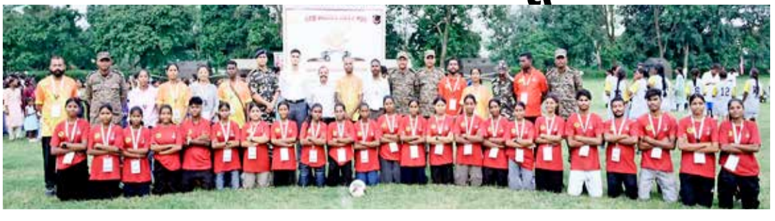
(એજન્સી) ઉડાલગુરી (આસામ) । તા. 26

આસામના ઉડાલગુરી જિલ્લાના ભૂતેયાંગ ટી એસ્ટેટ ખાતે 'ઉડાન અંડર-૨૦ ઓર્ડર ગર્લ્સ ફૂટબોલ ચેમ્પિયનશિપ ૨૦૨૬'નો ભવ્ય પ્રારંભ થયો છે. મહિલા સશક્તિકરણ, રમતગમતનો વિકાસ અને સરહદી તેમજ ચા બગીચાના વિસ્તારોની યુવતીઓને પ્રોત્સાહન આપવાના ઉમદા ઉદ્દેશ્ય સાથે આ ટુર્નામેન્ટનું આયોજન કરવામાં આવ્યું છે.