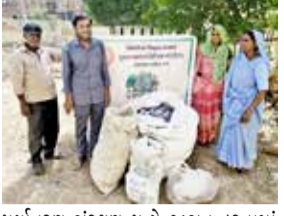
પશ્ચિમ રેલવે | અમદાવાદ

પશ્ચિમ રેલવેના અમદાવાદ મંડળ દ્વારા વિશ્વ પર્યાવરણ દિવસ હેઠળ વિવિધ રેલવે સ્ટેશનો પર સ્વચ્છતા, પર્યાવરણ સંરક્ષણ અને વ્યાપક ઉપયોગમાં ઘટાડો કરવા માટે વ્યાપક જનજાગૃતિ અભિયાન અને વિશેષ કાર્યક્રમ સંચાલિત કરવામાં આવી રહ્યા છે. પર્યાવરણ સંરક્ષણ પ્રત્યે જનભાગીદારી વધારવાના ઉદ્દેશ્યથી મંડળ દ્વારા 15.05.2026 થી 05.06.2026 સુધી વિવિધ કાર્યક્રમ આયોજિત કરવામાં આવી રહ્યા છે. આ દરમિયાન રેલવે કર્મચારીઓ, યાત્રીઓ, કોન્ટ્રાક્ટ કર્મચારીઓ તથા સ્ટોલ સંચાલકોને સ્વચ્છતા અને સતત વિકાસ પ્રત્યે જાગૃત કરવામાં આવી રહ્યા છે. મંડળના તમામ મુખ્ય સ્ટેશનો પર 15.05.2026 થી 19.05.2026 સુધી “સ્વચ્છતા શપથ” કાર્યક્રમ આયોજિત કરવામાં આવ્યા, જેમાં રેલવે કર્મચારીઓ અને યાત્રીઓએ સ્વચ્છતા જાળવી રાખવાના તથા પર્યાવરણ સંરક્ષણના સંકલ્પ લીધા. યાત્રીઓને વ્યાપકતાનો લઘુત્તમ ઉપયોગ કરવા અને યાત્રા દરમિયાન પોતાની પાછળની બોટલનો ઉપયોગ કરવા તથા