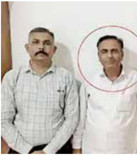
કરી રોકાણકારોની મૂડી ઉચાપત કરી લીધી છે.