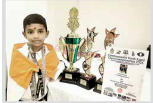
(એજન્સી) ચેન્નાઈ । તા. 26

ભારતીય રમતવીરોએ રવિવારે વૈશ્વિક સ્તરે મિશ્ર પ્રદર્શન કર્યું હતું. એક તરફ શ્રીલંકામાં આયોજિત કોમનવેલ્થ યુથ ચેસ ચેમ્પિયનશિપમાં ભારતના યુવા ખેલાડીએ ઈતિહાસ રચ્યો હતો, તો બીજી તરફ ગોલ્ડના મેદાનમાં ભારતીય ખેલાડીઓને સરેરાશ સફળતા મળી હતી.