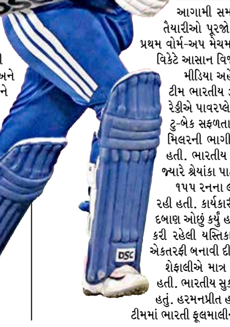
(એજન્સી) ચેન્નાઈ । તા. 26

આગામી સમયમાં રમાનાર મહિલા ટી-૨૦ વિશ્વકપ માટે ભારતીય ટીમની તૈયારીઓ પૂરજોશમાં શરૂ થઈ ગઈ છે. ઈંગ્લેન્ડના પ્રવાસના ભાગરૂપે રમાયેલી પ્રથમ વોર્મ-અપ મેચમાં ભારતીય મહિલા ટીમે ઈસીબી વર્લ્ડપ્રેમિયર ઈવેલન સામે સાત વિકેટે આસાન વિજય મેળવીને પોતાના અભિયાનની આક્રમક શરૂઆત કરી છે.