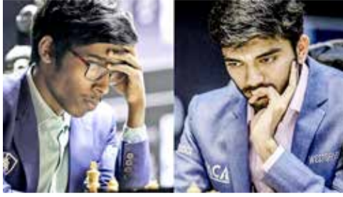
ઓસ્લો । તા. 26

નોર્વે ખાતે આયોજિત પ્રતિષ્ઠિત 'નોર્વે ચેસ ૨૦૨૬'ની પ્રથમ રાઉન્ડમાં ભારતીય ખેલાડીઓએ શાનદાર પ્રદર્શન કરતા જીત સાથે પોતાની મુખિમ શરૂ કરી છે. વિશ્વ ચેમ્પિયન ડી. ગુકેશ અને યુવા ગ્રાન્ડમાસ્ટર આર. પ્રજ્ઞાનંદે આ આંતરરાષ્ટ્રીય મંચ પર પોતાની પ્રતિભા સાબિત કરતા જીત મેળવી છે, જ્યારે મહિલા વિભાગમાં દિવ્યા દેશમુખે પણ પોતાની પ્રતિસ્પર્ધાને માત આપીને વિજયી શરૂઆત કરી હતી.