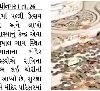
મંદિર પરિસરમાં તસ્કરોનો તરખાટ

મેની રાત્રે 9 વાગ્યાથી 25 મેની સવારના 3:55 વાગ્યાના સમયગાળા દરમિયાન આ ચોરીની ઘટના બની હતી. 2 તસ્કરો નદી તરફના માર્ગથી વરદાધિની માતાના મંદિર પરિસરમાં પ્રવેશ્યા હતા. આ તસ્કરોનો મુખ્ય ઈરાદો વરદાધિની માતાના મુખ્ય મંદિરમાં જ ચોરી કરવાનો હતો. જોકે, મુખ્ય મંદિર મજબૂત લોખંડી સુરક્ષા કવચ અને યુસ્ત લોકીંગ સિસ્ટમથી સજ્જ હોવાને કારણે તસ્કરો ત્યાં ચોરી કરવામાં નિષ્ફળ રહ્યા હતા. આથી, પોતાનો ફેરો ફોગટ ન જાય