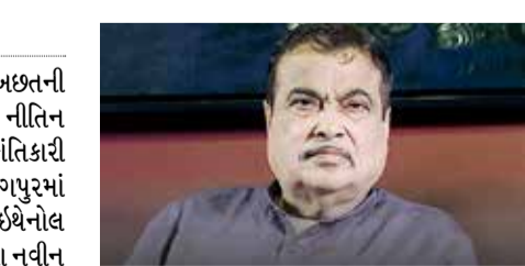
પ્રદૂષણમાં ઘટાડો કરવા માટે આ એક ખૂબ જ અસરકારક પગલું સાબિત થઈ શકે છે. ભારત તેની કૂડ એનર્જી અને એલપીજી જરૂરિયાતોનો લગભગ ૮૫ ટકા હિસ્સો વિદેશમાંથી આયાત કરે છે. જેના કારણે દર વર્ષે લાખો કરોડ રૂપિયા વિદેશી હુડિયામણ તરીકે બહાર જાય છે. ઇથેનોલના ઉપયોગથી આ બોજને ઓછો કરવામાં મદદ મળશે. ઇથેનોલ શેરડી અને મકાઈમાંથી બનતું હોવાથી તેની માંગ વધતા દેશના ખેડૂતોની આવકમાં પણ નોંધપાત્ર વધારો થવાની અપેક્ષા છે. છેલ્લા એક દાયકામાં ભારતે ઇથેનોલ મિશ્રણ કાર્યક્રમમાં મોટું કામ કર્યું છે, જે ૨૦૧૪ના

દેશના વિવિધ ભાગોમાં રસોઈ ગેસની અછતની ચર્ચાઓ વચ્ચે કેન્દ્રીય માર્ગ પરિવહન મંત્રી નીતિન ગડકરીએ એક મહત્વપૂર્ણ અને ક્રાંતિકારી ટેકનોલોજીનું અનાવરણ કર્યું છે. નાગપુરમાં આયોજિત એક કાર્યક્રમમાં ગડકરીએ નવી ઇથેનોલ આધારિત સ્ટવ ટેકનોલોજી લોન્ચ કરી છે. આ નવીન શોધ વિશે દાવો કરવામાં આવ્યો છે કે તે માત્ર પર્યાવરણને અનુકૂળ જ નથી, પરંતુ કોમર્શિયલ એલપીજી સિલિન્ડરોની તુલનામાં રસોઈ કરવાને પણ ઘણો ઓછો કરી દેશે. આ સ્વચ્છ સૌથી મોટી વિશેષતા એ છે કે તે સીધા ઇથેનોલ પર નહીં, પરંતુ ઇથેનોલ અને પાણીના મિશ્રણ પર કામ કરે છે. મંત્રી ગડકરીના જણાવ્યા અનુસાર, આ મિશ્રણ સરોઈ માટે એકદમ સ્વચ્છ જ્યોત ઉત્પન્ન કરે છે. આ ટેકનોલોજી સંપૂર્ણપણે સ્વદેશી છે અને તે પરંપરાગત એલપીજી, કેસીસી કે કોલસાની સરખામણીમાં ઘણી વધારે સુરક્ષિત અને પ્રદૂષણ મુક્ત છે. ઘરની અંદરના