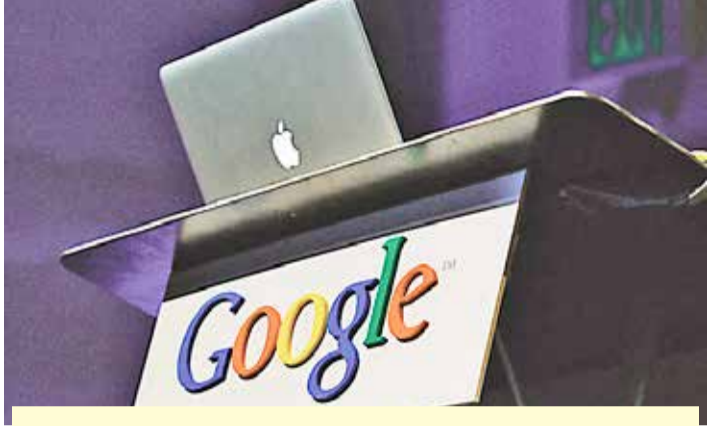
ભારતીય કંપનીઓનો દબદબો

આ વર્ષે ઓપનએઆઈના ચેટજીપીટીએ જે ગતિ બતાવી છે તે અભૂતપૂર્વ છે. માત્ર એક જ વર્ષમાં તેનું બ્રાન્ડ મૂલ્ય ૨૮૫ ટકા વધીને ૧૬ લાખ કરોડ રૂપિયા પર પહોંચી ગયું છે, જે વિશ્વના ઇતિહાસમાં સૌથી ઝડપી વૃદ્ધિ પૈકીની એક છે. બીજી તરફ, લક્ઝરી બ્રાન્ડ્સ માટે આ વર્ષે પડકારજનક રહ્યું છે. લુઈસ વીટન અને ચેનેલ જેવી પ્રતિષ્ઠિત બ્રાન્ડ્સનું મૂલ્ય ક્રમશઃ ૨૨ ટકા અને ૧૫ ટકા ઘટ્યું છે, જે દર્શાવે છે કે ગ્રાહકોની પસંદગીમાં હવે ટેકનોલોજી આધારિત બ્રાન્ડ્સ વધુ પ્રાધાન્ય મેળવી રહી છે. પરંપરાગત ક્ષેત્રો કરતાં આર્ટિફિશિયલ ઇન્ટેલિજન્સ અને ડિજિટલ ટેકનોલોજી સાથે જોડાયેલી કંપનીઓનું વર્ચસ્વ વધી રહ્યું છે. આગામી સમયમાં આ રેન્કિંગમાં કેવા નવા બદલાવ આવશે તે જોવું રસપ્રદ રહેશે.