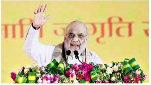
● જસ્ટિસ પ્રકાશ પ્રભાકર નાવલેકરની અધ્યક્ષતામાં વસ્તી પરિવર્તનો અભ્યાસ કરશે સમિતિ

(એજન્સી) નવી દિલ્હી | તા. 26 કેન્દ્ર સરકારે દેશના વિવિધ વિસ્તારોમાં વસ્તીમાં થઈ રહેલા અસામાન્ય ફેરફારોની ગંભીરતાને ધ્યાનમાં રાખીને એક ઉચ્ચ-સ્તરીય સમિતિની રચના કરી છે. આ સમિતિના અધ્યક્ષ પદે નિવૃત્ત જસ્ટિસ પ્રકાશ પ્રભાકર નાવલેકરની નિમણૂક કરવામાં આવી છે. આ નિર્ણયનો મુખ્ય ઉદ્દેશ્ય ગેરકાયદેસર ઘૂસણખોરી અને અન્ય પરિબળોને કારણે દેશમાં થઈ રહેલા વસ્તી વિષયક ફેરફારોનું ઊંડાણપૂર્વક મૂલ્યાંકન કરવાનો છે.