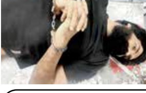
અમદાવાદમાં કુખ્યાત આરોપીના પગમાં પીઆઇએ ગોળી મારી