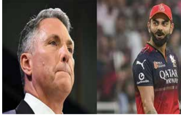
અમદાવાદ | તા. 02

આઈપીએલ ૨૦૨૬ ની ફાઇનલમાં વિરાટ કોહલીની શાનદાર બેટિંગે માત્ર ભારતીય ક્રિકેટ પ્રેમીઓ જ નહીં, પરંતુ ઓસ્ટ્રેલિયાના ડેપ્યુટી પ્રધાનમંત્રી રિચર્ડ માર્લેસના પણ દિલ જીતી લીધા છે. અમદાવાદના નરેન્દ્ર મોદી સ્ટેડિયમમાં ગુજરાત ટાઈટન્સ સામે રમાયેલી ફાઇનલ મેચમાં કોહલીની ૭૫ રનની અણનમ ઈનિંગે રોયલ ચેલેન્જર્સ બેંગ્લોરને ચેમ્પિયન બનાવવામાં મહત્વની ભૂમિકા ભજવી હતી. આ ભવ્ય જીત પર ઓસ્ટ્રેલિયાના ડેપ્યુટી પીએમ રિચર્ડ માર્લેસ ખુલ્લે પ્રશંસા કરી છે.