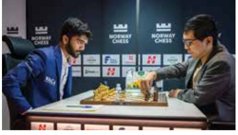
ઓસ્લો | તા. 02

ડી. ગુકેશે આર્માગેડનમાં વેસ્લી સો સામે મેળવી જીત