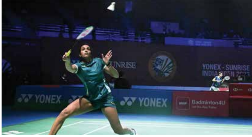
સાથે થવાની શક્યતા છે.

મહિલા સિંગલ્સના ૩૨ બેલાડીઓના રાઉન્ડમાં સિંઘુનો સામનો થાઈલેન્ડની બુસાનન ઓંગભામડુંગફાન સામે થયો હતો. ૫૧ મિનિટ ચાલેલી આ ટક્કરમાં સિંઘુએ ૨૫-૨૩, ૨૧-૧૬ થી સીધા સેટમાં વિજય મેળવ્યો હતો. મીડિયા અહેવાલ મુજબ, સિંઘુએ પોતાની આક્રમક રમતનું પ્રદર્શન કરીને પ્રથમ ગેમમાં મેળવેલી સરસાઈને બીજી ગેમમાં પણ જાળવી રાખી હતી. હવે બીજા રાઉન્ડમાં સિંઘુનો મુકાબલો વર્તમાન ઓલિમ્પિક ચેમ્પિયન અને વર્લ્ડ નંબર ૧ ખેલાડી એન સે-યંગ સાથે થવાની શક્યતા છે.