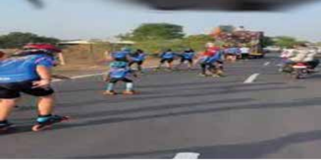
સાહસિકતાનો ગુણ વિકસે તેવા ભાવથી અવારનવાર સ્ટેટીંગ યાત્રા યોજાય છે. કલબ દ્વારા સર્વ પ્રથમ વખત જોખાલે ભાવનગરથી સાળંગપુરના એક દિવસીય યાત્રા યોજાઈ હતી.બાદ સોમનાથની યાત્રાને મળેલી સફળતાથી પ્રેરાઈને

ભાવનગરથી યાત્રાધામ બગદાણાના ગુરુ આશ્રમ સુધીની ૮૧ કિ.મી.ની સ્ટેટીંગ યાત્રા ગઈકાલે પુર્ણ કરનાર લાયન્સ સ્ટેટીંગ કબલના ઉપક્રમે આગામી ડિસેમ્બરમાં ઉજજૈન (એમ.પી.)ની સ્ટેટીંગ યાત્રા યોજાશે. જેમાં કબલના સાહસિક બાળકો ૫૫૦ કિ.મી.સ્ટેટીંગ કરી મધ્યપ્રદેશ સુધીની યાત્રા કરશે.ભાવનગર શહેરમાં છેલ્લા ૧૦ વર્ષથી ગણેશ ક્રિકા મંડળ ખાતે હેડ ક્વાર્ટર તેમજ રામમંત્ર મંદિર તેમજ કાર્ટસ્ટ સ્કૂલ ખાતે બ્રાંચ ધરાવતી લાયન્સ કલબમાં હાલ ૨૫૦ થી વધુ બાળકોને ટ્રેઈનીંગ આપવામાં આવે છે. કલબ દ્વારા દ્વારા સ્ટેટીંગ કરનાર બાળકોમાં નાની વયથી જ