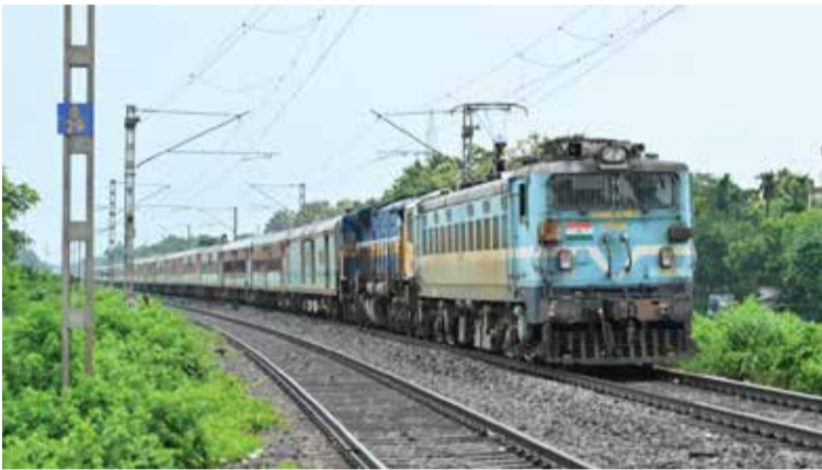
(એજન્સી) માલી ગામ | તા.02

ઉત્તર - વિજયવાડા) ને એક-માર્ગી ખાસ ટ્રેનો તરીકે ચલાવવાનો નિર્ણય લેવામાં આવ્યો છે. ૦૫૯૩૨/૦૫૯૩૧ (ડિબ્રુગઢ - કોલકાતા - ડિબ્રુગઢ) અને ટ્રેન નં. ૦૩૪૦૭/૦૩૪૦૮ (ભાગલપુર - કટિહાર - ભાગલપુર) ની સેવાઓ બંને દિશામાં અનુક્રમે આઠ અને ત્રણ વધારાની ટ્રીપ માટે લંબાવવામાં આવી છે. વધુમાં, ટ્રેન નં. ૦૫૬૩૦ (ગુવાહાટી - તિરુપતિ) અને ટ્રેન નં. ૦૫૬૩૨ (રંગપરા