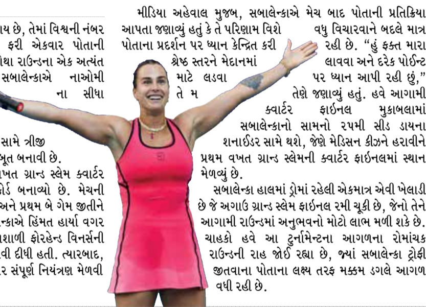
મીડિયા અહેવાલ મુજબ, સબાલેન્કાએ મેચ બાદ પોતાની પ્રતિક્રિયા આપતા જણાવ્યું હતું કે તે પરિણામ વિશે પોતાના પ્રદર્શન પર ધ્યાન કેન્દ્રિત કરી શ્રેષ્ઠ સ્તરને મેદાનમાં માટે લડવા તેમ તેમ તેણે જણાવ્યું હતું. હવે આગામી ક્વાર્ટર ફાઇનલ મુકાબલામાં સબાલેન્કાનો સામનો ૨૫મી સીડ ડાયના શનાઈડર સામે થશે, જેણે મેડિસન કીંગને હરાવીને પ્રથમ વખત ગ્રાન્ડ સ્લેમની ક્વાર્ટર ફાઇનલમાં સ્થાન મેળવ્યું છે.

આ જીત સાથે સબાલેન્કાએ સતત ૧૪મી વખત ગ્રાન્ડ સ્લેમ ક્વાર્ટર ફાઇનલમાં પ્રવેશ કરીને એક પ્રભાવશાળી રેકોર્ડ બનાવ્યો છે. મેચની શરૂઆતમાં ઓસાકાએ મજબૂત પ્રારંભ કર્યો હતો અને પ્રથમ બે ગેમ જીતીને સબાલેન્કા પર દબાણ બનાવ્યું હતું. જોકે, સબાલેન્કાએ હિંમત હાર્યા વગર શાનદાર વાપસી કરી હતી. તેણે પોતાના શક્તિશાળી ફોરહેન્ડ વિનસર્સની મદદથી બ્રેક પોઈન્ટ મેળવીને મેચમાં સમાનતા લાવી દીધી હતી. ત્યારબાદ, તેણે પોતાનો લય જાળવી રાખીને બાકીની મેચ પર સંપૂર્ણ નિયંત્રણ મેળવી લીધું હતું.