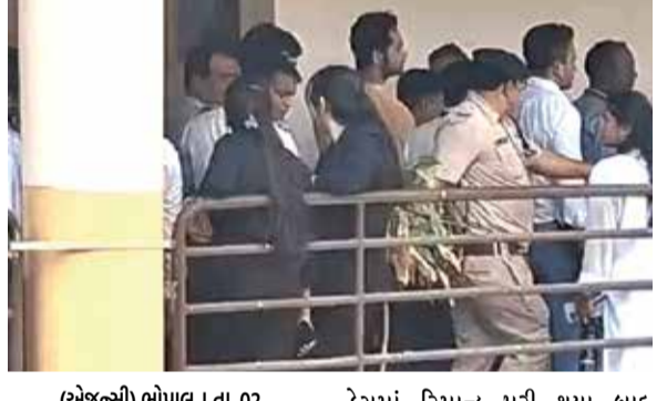
ભોપાલ । તા. 02