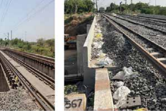
ટન ક્ષમતા ધરાવતી બે હાઈ-કેપેસિટી ટેનોને એક્સપોઝ કરીને તંત્રમાં આવી હતી, જેણે અલગ-અલગ સ્પાન પર સ્લેબ બેસાડવાનું કામ અતિશય ચોકસાઈ સાથે પૂર્ણ કર્યું હતું. બ્રિજ પરથી પસાર થતી ટ્રેનોની સુરક્ષા અને માળખાકીય ટકાઉપણાને સુનિશ્ચિત કરવા માટે

આ બ્રિજ ત્રણ સ્પાન ધરાવે છે અને દરેક સ્પાનની લંબાઈ ૧૨.૨ મીટર છે. આ જટિલ અને મોટા પાયાની કામગીરીને પાર પાડવા માટે તંત્ર દ્વારા અદ્યતન ટેકનોલોજીનો ઉપયોગ કરવામાં આવ્યો હતો. રેલવેના ઈજનેરો અને નિષ્ણાતોની દેખરેખ હેઠળ ૫૦૦ ટન અને ૪૫૦