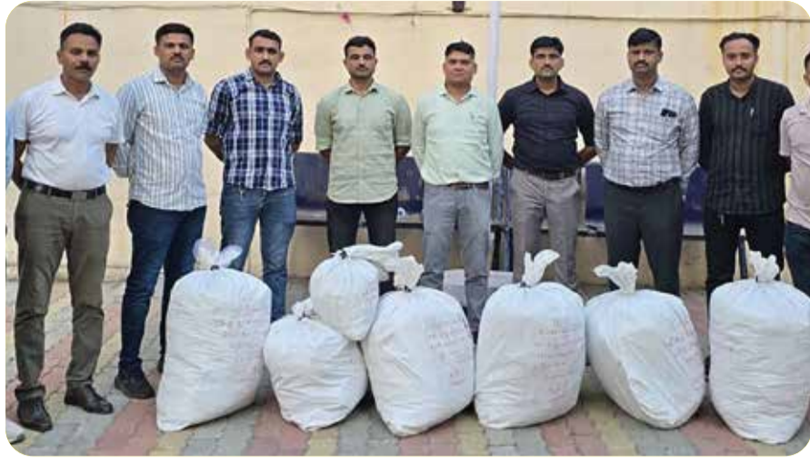
લાખ રૂપિયા થવા જાય છે.

વડોદરા રેલવે સ્ટેશનના પ્લેટફોર્મ નંબર-૬ પર પુરી-ગાંધીધામ એક્સપ્રેસ ટ્રેન આવી પહોંચતા રેલવે પોલીસ અને સ્પેશિયલ ઓપરેશન ગ્રુપ (એસઓ) દ્વારા ચેકિંગની કાર્યવાહી હાથ ધરવામાં આવી હતી. તપાસ દરમિયાન દિવાંગ કોચના શોયાલયની છતની પ્લાય તૂટેલી હાલતમાં જોવા મળી હતી. આ શંકાસ્પદ સ્થિતિ જોઈ પોલીસે જ્યારે છતની અંદર તપાસ કરી, ત્યારે ત્યાંથી પાંચ મોટા વજનદાર થેલા અને એક કિલોગ્રામ કોચનો મળી આવ્યો હતો. આ બિનવારસી કોચનાથી પોલીસે તપાસતા અંદરથી ૧૧૩.૮૦૦ કિલોગ્રામ વજનનો ગાંજાનો જથ્થો મળી આવ્યો હતો, જેની આંતરરાષ્ટ્રીય બજારમાં કિંમત અંદાજે ૫૬.૯૫