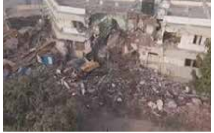
હજારનો દંડ વસુલ કર્યો હતો. મહાપાલિકાની ટઈમિ હાઈકોટ રોડ ,ભીડભંજન રોડ વગેરે વિસ્તારમાં જઈને અસ્થાયી દબાણ હટાવી ૨ વજન કાંટા, ૪ લારી, ૧ ટેબલ સહિતનો સામાન જપ્ત કર્યો હતો. મહાપાલિકાની કામગીરીના પગલે દબાણકર્તાઓમાં ફફડાટ ફેલાયો હતો અને દોડધામ મચી જવા પામી હતી.

ભાવનગર : ભાવનગર મહાનગરપાલિકા દ્વારા નાના ગેરકાયદે દબાણ દૂર કરવાની કામગીરી યથાવત છે, જેના ભાગરૂપે આજે સોમવારે ૨૫થી વધુ લારી સહિતના દબાણ દૂર કરવામાં આવ્યા હતા અને કેટલીક સામાન જત કરવામાં આવ્યો હતો. આ ઉપરાંત દંડ પણ વસુલવામાં આવ્યો હતો. ભાવનગર મહાપાલિકાની દબાણ હટાવ ટીમ દ્વારા ફરિયાદના પગલે જશોનાથ સર્કલ, તળાવ, શાકમાર્કેટ, રૂપમ, ઓંબાયોક, લોખંડ બજાર, પીરજલ્લા સહિતના વિસ્તારમાં પર જઈને અસ્થાયી દબાણો દૂર કર્યાં હતા અને ૪૦ કેરેટ, ૧ છત્રી, ૩ કપડાના થેલા, પાંદિયા, બોર્ડ, ટેબલ, તાલપત્રી વગેરે સામાન જપ્ત કર્યો હતો. આ ઉપરાંત સ્વચ્છતા સર્વેક્ષણ અંતર્ગત મહિલા કોલેજ સર્કલ પર જઈને અડચણરૂપ અસ્થાયી દબાણો દૂર કરી સામાન જપ્ત કર્યો હતો. રોડને અડચણરૂપ ૪ લારી, ૧ રીક્ષા, ૧ ચકડોળ વગેરેને લોક મારી તેમજ રૂ. ૩