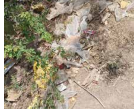
પકકું છે ત્યારે નવ નિયુક્ત પીઆઈ પટેલ કડક હાથે કામ લઈ યાણસા નગર સહિત ગ્રામીણ વિસ્તારોમાં ચાલી રહેલી અસામાજિક પ્રવૃત્તિઓ સામે કડક હાથે કાર્યવાહી કરાય તેવી લોકમંંગ ઉઠવા પામી છે