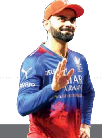
પેજ-09 વિરાટ કોહલીની આઈપીએલ જીત પર ઓસ્ટ્રેલિયન વાહવાઈ