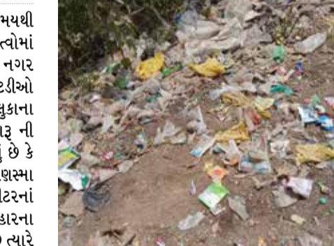
ધૂમ વેચાણ થઈ રહ્યું છે શરમની વાત એ છે કે ધાર્મિક યાણસા નગરના હાઈવે પરની સત્તમ હોટલ સુધી ગેસ્ટહાઉસ જેવી અનેક જગ્યાએ દેહલ્યાપાર જેવી અસામાજિક પ્રવૃત્તિઓ થતી હોવાનું. ચર્ચાએ જોર

યાણસા તાલુકામાં છેલ્લા કેટલાય સમયથી અસામાજિક પ્રવૃત્તિઓ કરતા અસામાજિક તત્વોમાં પોલિશનો ડર રહ્યો નહી હોવાનું. યાણસા નગર સહિત ગામડાંઓમાં વેચાતા દેશી દારૂની. હાટડીઓ પર થી સ્પષ્ટ જોવા મળી રહ્યું છે યાણસા તાલુકાના કારોડા ગામ ના કેટલાક વિસ્તારોમાં દેશી દારૂ ની પોટલીઓના ઢગલા થી સ્પષ્ટ જોવા મળી રહ્યું છે કે દારૂની હાટડીઓ ધમધમતી હશે જ્યારે યાણસા નગરમાં હાઈવે પોલિશ ચોકીથી માત્ર 100 મીટરનાં અંતરે પોલિશના નાક નીચેઈન્દીરાનગરના બહારના વિસ્તારમાં ખુલ્લેઆમ દેશી દારૂ વેચાઈ રહ્યો છે ત્યારે પોલિશ જાણે મુકપ્રેક્ષક બની જોઈ રહી હોવાનું જોવા મળી રહ્યું છે બીજી બાજુ યાણસા-હારીજ હાઈવે પેટ્રોલપંપની બાજુમાં તેમજ એની થોડે દુર હોલી હોટલ સામે પાલ્વર ના ઓથા નીચે પરખાંતીય દારૂનું