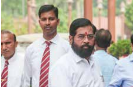
(એજન્સી) મુંબઈ | તા.02

મહારાષ્ટ્રના રાજકારણમાં છેલ્લા કેટલાક દિવસોથી શિવસેનાના બંને જૂથો એટલે કે ઉદ્ધવ ઠાકરે જૂથ અને એકનાથ શિંદે જૂથ ફરી એક થશે તેવી અટકળોએ જોર પકડ્યું હતું. જોકે, મહારાષ્ટ્રના મુખ્યમંત્રી એકનાથ શિંદેએ આ તમામ ચર્ચાઓ પર પૂર્ણવિરામ મુકતા એક મહત્વપૂર્ણ નિવેદન આપ્યું છે. તેમણે સ્પષ્ટ કર્યું છે કે હાલના તબક્કે બંને જૂથોના મિલન અંગેની કોઈ પણ સંભાવનાઓ નથી.