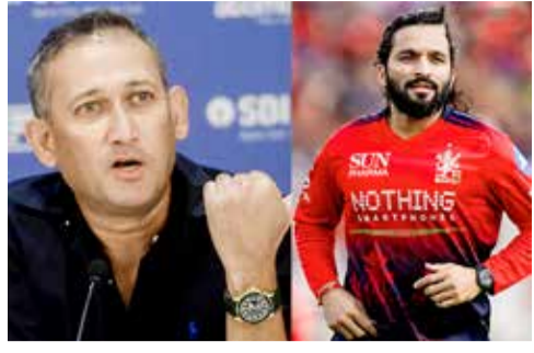
(એજન્સી) નવી દિલ્હી | તા. 08

આયર્લેન્ડ, ઈંગ્લેન્ડ અને એશિયન ગેમ્સ માટેની ભારતીય ટીમની જાહેરાત બાદ ક્રિકેટ જગતમાં એક મોટો વિવાદ ઊભો થયો છે. રવિવારે લંડનના ઐતિહાસિક વોટરલૂ ક્ષેત્રે પહેલીવાર એક લાઈવ ક્રિકેટ પિચમાં બદલી નાખવામાં આવ્યો હતો. આ અદભૂત નજારાએ માત્ર લંડન શહેરને જ નહીં, પરંતુ સમગ્ર વિશ્વના ક્રિકેટ પ્રેમીઓને મંત્રમુગ્ધ કરી દીધા હતા. ટુર્નામેન્ટના પ્રારંભ પહેલા તમામ 12 ટીમોના કેપ્ટનો આ ઐતિહાસિક ક્ષેત્ર પર એકઠા થયા હતા, જે મહિલા ક્રિકેટના વધતા જતા પ્રભાવનું એક શક્તિશાળી પ્રતીક બની રહ્યું.