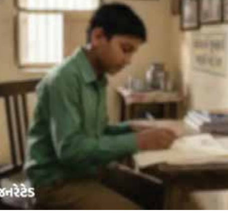
ધૂંધર જોષીને બાળકે બોમ્બ ધમકીની ચિઠ્ઠી લખી

(અજન્સી) અમદાવાદ | તા. 10 અમદાવાદની સ્પોર્ટ્સ ક્લબ પર 1 જૂને લશ્કરે તોઈબાના આતંકી હુમલાની ધમકી આપતી ચિઠ્ઠીનો ભેદ નારણપુરા પોલીસે ઉકેલી નાખ્યો છે, જેની પાછળ સુરતના વેપારીના એક 12 વર્ષના દીકરાનું કારસ્તાન હોવાનું સામે આવ્યું છે. સુરતના કાપડના વેપારીનો પરિવાર કલબના રૂમમાં રોકાયો હતો, જ્યાં તેમના 12 વર્ષના દીકરાએ 'ધુરંધર' મૂવી જોયા બાદ મજાક ખાતર પેલ્સિવલી અંગ્રેજીમાં દાઉદ અને લશ્કર-એ-તોઈબાના નામે ધમકીભરી ચિઠ્ઠી લખી હતી. બાળકે આ ચિઠ્ઠી લોકરમાં મૂકી દીધી હતી અને લોકર લોક થઈ જતાં તે અંદર જ રહી ગઈ હતી, ત્યારબાદમાં હાઉસફિંગ સ્ટાફને મળી આવતા પોલીસ અને BDSS દોડતા થયા હતા. સીસીટીવી ફૂટેજ અને લોકરના ડિજિટલ લોગની તપાસના આધારે પોલીસે સુરતના આ વેપારી પરિવાર સુધી પહોંચીને પૂછપરછ