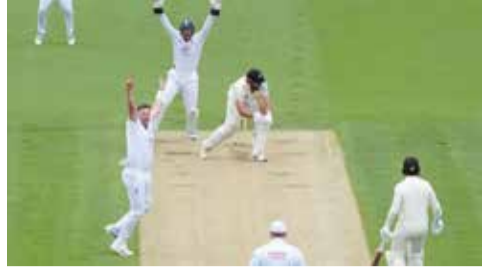
(એજન્સી) લંડન | તા. 10

ક્રિકેટ સ્ટેડિયમની પિચો પર સવાલ, પિચ વિવાદ બાદ આઈસીસીની સખત પગલાં