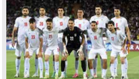
(એજન્સી) તિબુઆના | તા. 10

ફિફા વર્લ્ડ કપ ૨૦૨૬માં ભાગ લેવા જઈ રહેલી ઈરાનની ફટબોલ ટીમ માટે એક મહત્વપૂર્ણ સમાચાર સામે આવ્યા છે. અમેરિકન ડિપાર્ટમેન્ટ ઓફ હોમલેન્ડ સિક્યોરિટીએ સ્પષ્ટતા કરી છે કે, ઈરાની ખેલાડીઓને તેમની મેચના એક દિવસ પહેલા અમેરિકા પહોંચવાની મંજૂરી આપવામાં આવશે. આ જાહેરાત બાદ ટીમના ઐતિહાસિક અને ખેલાડીઓના પ્રદર્શન અંગેની અનિશ્ચિતતા દૂર થઈ છે. અગાઉ મીડિયા અહેવાલોમાં એવી ચર્ચાઓ હતી કે ઈરાની ટીમને મેચના દિવસે જ અમેરિકામાં પ્રવેશવું પડશે અને તે જ દિવસે પરત ફરવું પડશે, જેના કારણે ખેલાડીઓની રમત પર અસર પડવાની આશંકા હતી. જોકે, સત્તાવાર નિવેદનમાં આ દાવાઓને નકારી કાઢવામાં આવ્યા છે. પ્રમુખ ડોનાલ્ડ ટ્રમ્પના નિર્દેશો મુજબ, ઈરાની ટીમને મેચના એક દિવસ પહેલા આવવાની સુવિધા આપવામાં આવી છે. તેમના વિઝામાં પણ કોઈ ચોક્કસ સમયમર્યાદા અંગેનો પ્રતિબંધ નથી, જેથી ખેલાડીઓને ઘણી મોટી રાહત મળી છે. એક તરફ ટીમને પ્રવેશની મંજૂરી મળી છે, તો બીજા તરફ FFIRI એ ડિક્રિટ વિતરણને લઈને નારાજગી વ્યક્ત કરી છે. ફેરફારના જણાવ્યા મુજબ, વર્લ્ડ કપ શરૂ થવાના થોડા સમય પહેલા જ ઈરાન માટે ફાળવવામાં આવેલી ટિકિટો પાછી ખેંચી લેવામાં આવી છે. આ નિર્ણયને કારણે જે ચાહકોએ પહેલેથી જ પ્રવાસનું આયોજન કર્યું હતું, તેઓ હવે મેચ જોઈ શકશે નહીં. ઈરાની ફેરફારને આને આંતરરાષ્ટ્રીય રમતગમતની ભાવના અને સમાનતાના સિદ્ધાંતોની વિરુદ્ધ ગણાવ્યું છે.