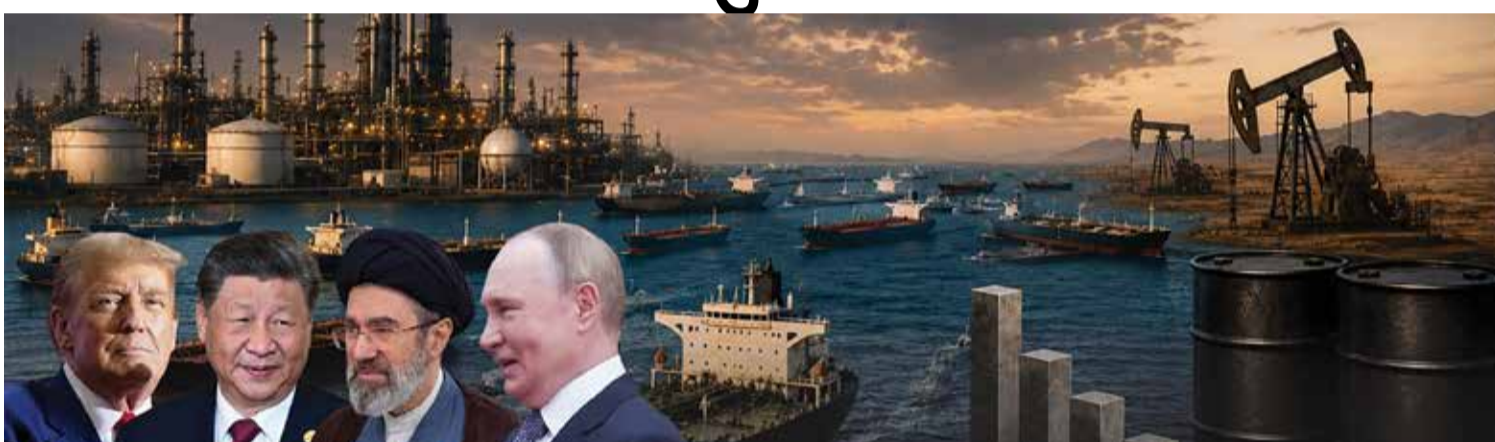
(એજન્સી) અમદાવાદ । તા. 13

ઑટરરાષ્ટ્રીય સ્તરે તેલ બજારમાં ચાલી રહેલા સમીકરણોમાં મોટો ફેરફાર જોવા મળી રહ્યો છે. અમેરિકા પ્રતિબંધો અને મજબૂત નૌસેનાની નાકાબંધી વચ્ચે ઈરાનનું અર્થતંત્ર ગંભીર સંકટમાં મુકાયું છે. ચીન જેવા મોટા ખરીદદારે હવે ઈરાનને બદલે રશિયા પાસેથી સસ્તું કૂડ ઓઈલ ખરીદવાનું નક્કી કરતા ઈરાન માટે તેલ નિકાસની આવક જાળવી રાખવી મુશ્કેલ બની ગઈ છે. છેલ્લા એક મહિનામાં ઈરાનનું તેલ ઉત્પાદન ૧૯ ટકા જેટલું ગરગટી ગયું છે, જે દેશની આર્થિક સ્થિતિ માટે ચિંતાનો વિષય છે.