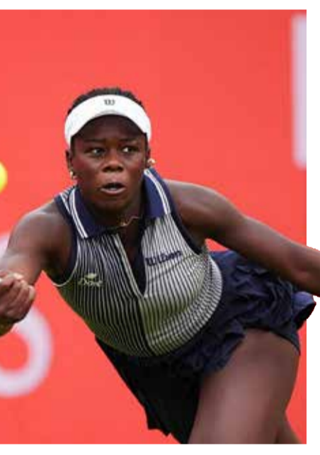
ટેવાની ફરજ પડી હતી.

વિશ્વ રેન્કિંગમાં ૮મા ક્રમે રહેલી પ્રતિભાશાળી વિક્ટોરિયા મ્હોકો એચએસબીસી ચેમ્પિયનશિપમાં કેરોલિના વ્લિસ્ટ્રોવા સામે રમી રહી હતી. મેચના બીજા સેટ દરમિયાન એક શોટ રીટર્ન કરવાનો પ્રયાસ કરતી વખતે બેઝલાઈન પાછળ તેનો પગ અચાનક લપસી ગયો હતો. પગ લપસતાની સાથે જ તે મેદાન પર પડી ગઈ હતી અને તેણે તરત જ પોતાના ડાબા ઘૂંટણને પકડી લીધો હતો. મેદાન પર આવેલા ફિઝિયોથેરાપિસ્ટને તેણે જણાવ્યું હતું કે તેના ઘૂંટણમાં કોઈ સ્થિરતા જણાતી નથી. આ ગંભીર પરિસ્થિતિને કારણે તેને મેચ અધવચ્ચેથી જ છોડી દેવાની ફરજ પડી હતી.