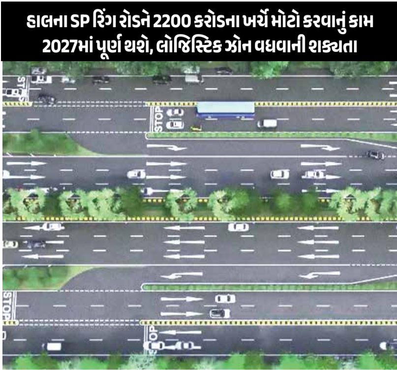
હાલના SP રિંગ રોડને 2200 કરોડના ખર્ચે મોટો કરવાનું કામ 2027માં પૂર્ણ થશે, લોજિસ્ટિક્સ ઝોન વધવાની શક્યતા

ગાંધીનગર | જો તમે ગુજરાતના કોઈપણ ખૂણેથી અમદાવાદ આવતા હો અને તમને ટ્રાફિક જામમાં ફસાવાની ધિંતા હોય તો હવે તમારે એ ધિંતા કરવાની જરૂર નથી. અમદાવાદમાં રોજબરોજ બનતા અકસ્માતો ઘટાડવા તેમજ લોકોને ટ્રાફિકમાંથી મુક્તિ અપાવવા માટે નવો રિંગ રોડ બનાવાશે. 2027ના ડિસેમ્બર સુધીમાં આ રિંગ રોડનું કામ પૂરું થવાની શક્યતાઓ છે. જેની પાછળ 2200 કરોડ રૂપિયાનો ખર્ચ થશે. હાલમાં અમદાવાદમાં રિંગ રોડના ત્રીજા અને આખરી તબક્કાનું કામ શરૂ કરાયું છે. જેમાં વિવિધ પ્રકારની સુવિધાઓ હશે. નાગરિકોને ટ્રાફિકના ભારમાંથી મુક્તિ મળે તે પ્રકારનું આયોજન છે. રોજ અહીંથી પસાર થઈ રહેલા એક લાખ વાહનોની સુરક્ષાનું પણ ધ્યાન રખાયું છે. નવો રિંગ રોડ બનાવવાથી અનેક ગામડાંઓનો વિકાસ થશે. 300 ફૂટનો આઉટર રિંગ રોડ બનાવવા માટે ઓડાએ તેની નવી 10 વર્ષીય વિકાસ યોજના (DIP)માં પ્રસ્તાવ મૂક્યો છે. આ રોડ 9 ગામોમાંથી ડેવલપમેન્ટ કોર્પોરેશનના અંતરે પસાર થાય છે. ઓડા વિસ્તારનો નવો ડીપી બનાવવાની કાર્યવાહી પણ હાથ ધરાઈ છે. હાલમાં ઓડામાં સમાવિષ્ટ ગામોના વિસ્તારને