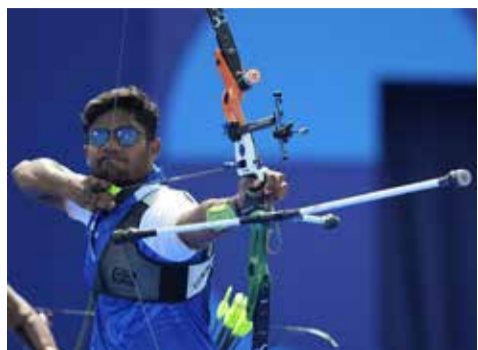
(એજન્સી) અંતાલ્યા | તા. 13

અંતાલ્યા ખાતે ચાલી રહેલા આર્ચરી વર્લ્ડ કપ સ્નેજ-ઉમા ભારતીય તીરંદાજ ધીરજ બોમ્બાદેવરાએ શાનદાર પ્રદર્શન કરતા રિકર્વ મેન્સ ઈન્ડિવિજ્યુઅલ સેમીફાઇનલમાં પ્રવેશ કર્યો છે. આ સિદ્ધિ સાથે ધીરજ હવે મેડલ જીતવાની પ્રબળ દાવેદારી નોંધાવી રહ્યા છે. ધીરજે ક્વાર્ટર્સ ફાઇનલમાં ઈટાલીના મેક્સિમિલિયાનો મેન્ચિયાને ૬-૨થી પરાજય આપીને અંતિમ ચારમાં સ્થાન સુરક્ષિત કર્યું હતું.