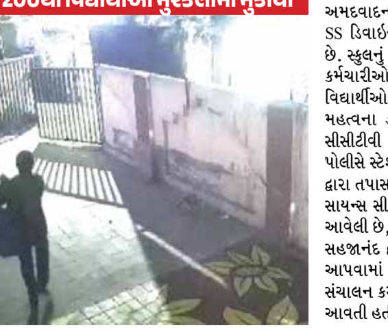
200થી વિદ્યાર્થીઓ મુશ્કેલીમાં મુકાયા

(એજન્સી) ગાંધીનગર | તા. 13 રાજ્યના ઔદ્યોગિક ક્ષેત્રને વેગ આપવા અને નવા રોકાણો આકર્ષવાના હેતુથી ગુજરાત સરકાર આગામી 15 જૂનના રોજ બહુપ્રતિભક્તિ 'ઔદ્યોગિક નીતિ-2026' સત્તાવાર રીતે જાહેર કરવા જઈ રહી છે. ગાંધીનગર સ્થિત મહાત્મા મંદિર ખાતે યોજાનાર એક વિશેષ કાર્યક્રમમાં રાજ્યના આગામી વર્ષોના ઔદ્યોગિક વિકાસના રોડમેપનું અનાવરણ કરવામાં આવશે. આ નવી નીતિનો મુખ્ય ઉદ્દેશ રાજ્યમાં ઔદ્યોગિક રોકાણો વધારવા, નવીન સંશોધનોને પ્રોત્સાહન આપવા તેમજ રોજગારીની નવી તકોનું સર્જન કરવાનો છે. વૈશ્વિક અને સ્થાનિક સ્તરે રોકાણકારો માટે ગુજરાત અગ્રણી રોકાણ સ્થળ બને તે દિશામાં આ નીતિમાં વિવિધ જોગવાઈઓ કરવામાં આવી હોવાની અપેક્ષા છે. આગામી 'ઔદ્યોગિક નીતિ-2026' માં ઉદ્યોગોના વિકાસ માટે નીચે મુજબના ક્ષેત્રોને વિશેષ પ્રાધાન્ય આપવામાં આવે તેવી સંભાવના સેવાઈ રહી છે: