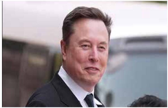
(એજન્સી) વ્યૂર્કોર્ક । તા. 13

અમેરિકન શેરબજારમાં રોકેટ મેકર કંપની સ્પેસએક્સની ધમાકેદાર અંદ્રી સાથે એક નવો ઈતિહાસ રચાયો છે. કંપનીના શેર બજારમાં લિસ્ટ થતાની સાથે જ તેમાં ૨૦ ટકાનો ઉછળાવો નોંધાયો હતો, જેના કારણે કંપનીના મુખ્ય કારોબારી અધિકારી ઈલોન મસ્ક વિશ્વના પ્રથમ ટ્રિલિયોનેર બનવાનું ગૌરવ પ્રાપ્ત કરી ચુક્યા છે. શેરબજારના આંકડા મુજબ, મસ્કની કુલ સંપત્તિ હવે ૧.૧ ટ્રિલિયન ડોલરના સ્તરે પહોંચી ગઈ છે, જે ટેકનોલોજીની દુનિયામાં એક સીમાચિહ્ન સમાન છે.