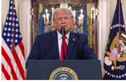
ઈરાન-અમેરિકા વચ્ચે શાંતિના સંકેત

રાજકીય વિશ્લેષકો આ ઓપરેશનને એક મોટી વ્યૂહરચનાના ભાગ રૂપે જોઈ રહ્યા છે. છેલ્લા બે દિવસથી ઈરાન પર થઈ રહેલા હુમલાઓને કારણે વૈશ્વિક બજારોમાં અસ્થિરતા સર્જાઈ હતી. હવે જ્યારે અમેરિકા અને ઈરાન શાંતિ સમજૂતીની ખૂબ નજીક હોવાનો દાવો કરી રહ્યા છે, ત્યારે વૈશ્વિક સ્તરેથી ધ્યાન અન્યત્ર વાળવા માટે વેનેઝુએલામાં આ મોટું ઓપરેશન હાથ ધરવામાં આવ્યું હોવાની ચર્ચા જોરશોરથી ચાલી રહી છે.