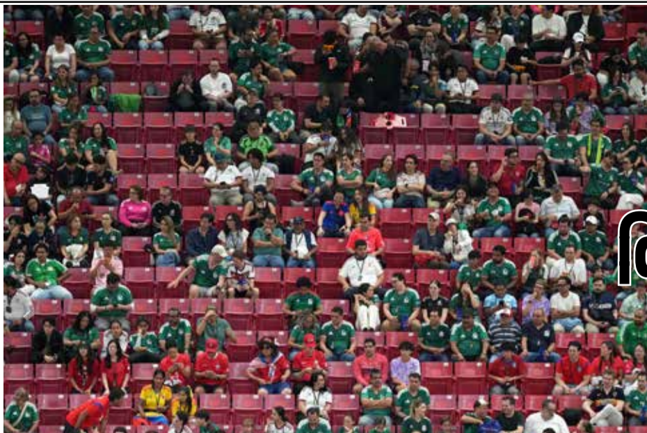
મેક્સિકો સિટી | તા. 13