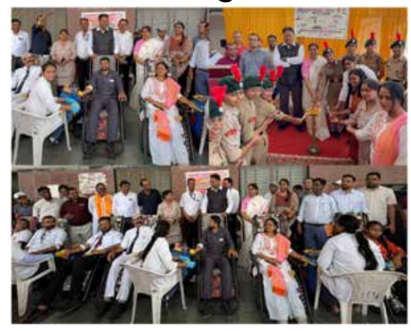
અમદાવાદ | વિશ્વ રક્તદાન દિવસના અવસરે આજે મહેસાણા રેલવે સ્ટેશન ખાતે સ્વેચ્છિક રક્તદાન શિબિરનું સફળ આયોજન કરવામાં આવ્યું હતું. આ સરાહનીય પહેલ મહેસાણા રેલવે સ્ટાફના રેલવે સેવાર્થ યુવ' દ્વારા કરવામાં આવી હતી, જેમાં રેલવે કમ્પાનીઓ અને તેમના પરિવારજનો ઉસ્સાહપૂર્વક જોડાયા હતા.આ કાર્યક્રમમાં મુખ્ય અતિથિ તરીકે અમદાવાદ મંડળના મંડળ રેલ પ્રબંધક શ્રી વેદ પ્રકાશ તથા પશ્ચિમ રેલવે મહિલા ક્લબના સંગઠન (WRWWO),અમદાવાદની અધ્યક્ષ શ્રીમતી શેક્ષલી ગુપ્તા ઉપસ્થિત રહ્યા હતા.રેલવે સેવાર્થ યુવ'ના આ સેવાકાર્યમાં રેલવે કમ્પાનીઓ અને તેમના પરિવારજનોએ સામાજિક