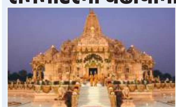
(એજન્સી) અયોધ્યા | તા.15

અયોધ્યા રામ મંદિરમાં ચઢાવામાંથી ચોરીનો મામલો ગરમાઈ રહ્યો છે. સરકારે તપાસ માટે શનિવારે SITની રચના કરી, જે રવિવાર રાત સુધીમાં અયોધ્યા પહોંચશે. સૂત્રો પાસેથી મળેલા સમાચાર મુજબ, 3 દિવસ પહેલા જ કેન્દ્ર સરકારે એક IPS અધિકારીને અહીં મોકલ્યા હતા. તેમની દેખરેખ હેઠળ ચઢાવા ચોરી કેસની ગુપ્ત તપાસ ચાલી રહી છે. જોકે, આ અંગે અધિકારીઓ હાલ મૌન સેવી રહ્યા છે. આ તરફ, ચઢાવા ચોરીમાં