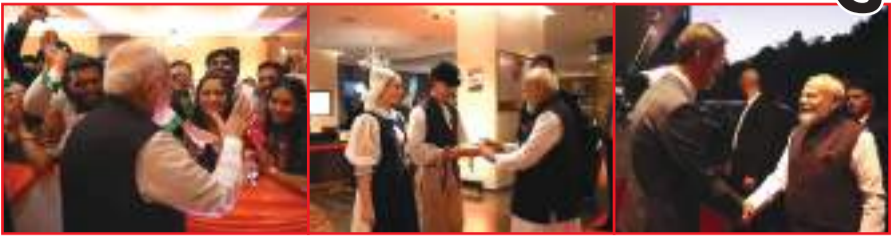
નવી દિલ્હી | તા.15

વડાપ્રધાન નરેન્દ્ર મોદી તેમના બે દેશોના પ્રવાસના બીજા તબક્કામાં રવિવારે રાત્રે 2:18 વાગ્યે સ્લોવાકિયા પહોંચ્યા. તેઓ અહીં 16 જૂન સુધી રહેશે. રાજધાની બ્રાતિસ્લાવામાં વિદેશ અને યુરોપિયન બાબતોના મંત્રી જુરાય બ્લાનાર દ્વારા તેમનું સ્વાગત કરવામાં આવ્યું.