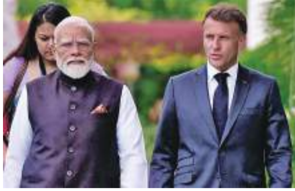
ઈનોવેશન અને ટેકનોલોજી પર ભાર

બંને નેતાઓ વચ્ચેની આ બેઠકમાં કુલ ૧૩ મહત્વના કરારો કરવામાં આવ્યા છે, જે બંને દેશોની વ્યૂહાત્મક ભાગીદારીને વધુ મજબૂત બનાવશે. આ સમજૂતીઓમાં હાઈ-સ્પીડ રેલવે સહયોગ, ક્લાસિકાઈડ ડેટાની સુરક્ષા માટેનો સંરક્ષણ કરાર અને પેરિસ તથા નીસ એરપોર્ટ પર ભારતના યુપીઆઈ પેમેન્ટ નેટવર્કનો વિસ્તાર કરવાનો સમાવેશ થાય છે. આ પગલાંથી પ્રવાસન અને ડિજિટલ લેવડ-દેવડમાં મોટો સુધારો આવશે.