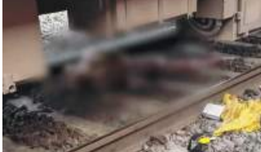
ચેન પુલિંગ અને અફવાને કારણે ઉતરીને ભાગ્યા મુસાફરો

માહિતી અનુસાર, આ દુર્ઘટના ઉત્તર મધ્ય રેલવેના ઝાંસી મંડળના હેતમપુર-ધોલપુર રેલવે પર થઈ. ટ્રેન નંબર 19665 ખજુરાહો-ઉદયપુર ઈન્ટરસિટી એક્સપ્રેસ રવિવારે લગભગ 4:15 વાગ્યે હેતમપુર અને ધોલપુર સ્ટેશન વચ્ચે અચાનક રોકાઈ ગઈ હતી.