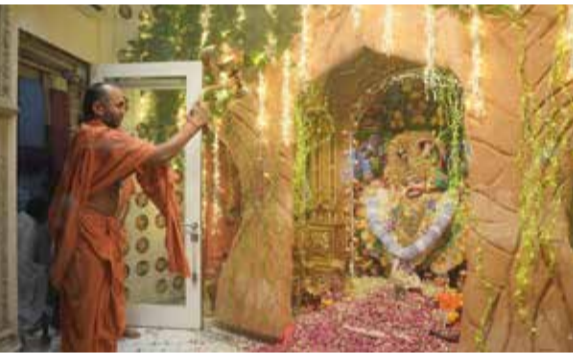
હનુમાન ચાલીસા યજ્ઞની શાસ્ત્રોક્ત વિધિથી પૂર્ણાહુતિ થઈ હતી. મારુતિ યજ્ઞનું આયોજન કરવામાં આવ્યું હતું, ૫૫૫ કિલો ડ્રાયફ્રુટનો અભિષેક: દાદાને ૫૫૫ કિલો ડ્રાયફ્રુટ (કાજુ, બદામ વગેરે) થી દિવ્ય મહાઅભિષેક કરવામાં આવ્યો હતો, ત્યારબાદ મોતીઓનો અભિષેક કરાયો હતો, જે ભક્તો માટે એક અદ્ભુત અને દર્શનીય ઝુમ્મરો હતો. ભવ્ય રાજોપયાર પૂજન: દાદાને રાજાધિરાજ સમાન ગણીને વૈદિક મંત્રોચ્ચાર સાથે રાજોપયાર વિધિથી પૂજન-અર્ચન કરવામાં આવ્યું હતું, જેમાં તેમને વિશેષ વાદા અને આભૂષણો ધરાવવામાં આવ્યા હતા. દીપોત્સવ: સાંજે ૦૭:૦૦ કલાકે સમૂહ મહાઆરતી, દીપોત્સવ દિવસાઓના પ્રકાશથી જળહળી ઉઠ્યું હતું. ભવ્ય આતશબાજી: ભવ્ય ધમાકેદાર આતશબાજી આકાશ રંગભેરથી રોશનીય રંગાઈ ગયું હતું. સાંજે ૦૪:૦૦ કલાકે શ્રીકૃષ્ણભંજનદેવ દાદાનું દિવ્ય રાજોપયાર પૂજનનું આયોજન કરવામાં આવ્યું હતું.