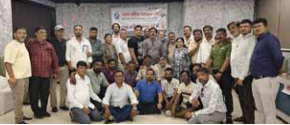
મલેક યસેદગીભી ભઝચ

ભઝચ જિલ્લામાં વિવિધ પ્રિન્ટ અને ઈલેક્ટ્રોનિક સમાચાર માધ્યમોમાં સક્રિય રીતે ફરજ બજાવતાં પત્રકારો, કેમેરામેનોનું ભઝચ સક્રિય પત્રકાર સંઘના નામે એક ખાસ સંગઠન છેલ્લાં 12 વર્ષથી કાર્યરત છે. આ વર્ષોમાં બીએજેએ (ભઝચ એક્ટિવ જર્નાલિસ્ટ એસોસીએશન) દ્વારા વિવિધ પ્રકારના સેવાકાર્યો કરવામાં આવ્યાં છે. જેમાં શહેરના ગરીબ વિસ્તારમાં મેડિકલ કેમ્પ, આંખોનો કેમ્પ, વૃદ્ધારોપણ, સ્વચ્છતા જાગૃતિ સહિતના અનેક પ્રકારના કાર્યો થકી લોકોની સેવાની સાથે સાથે લોક જાગૃતિના પણ વિવિધ કાર્યક્રમોને સફળતાં પૂર્વક પાર પાડ્યાં છે. ત્યારે શનિવારે ભઝચની ગંગોત્રી હોલમાં સાંજે 5 વાગ્યે ભઝચ સક્રિય પત્રકાર સંઘની 13મી વાર્ષિક સામાન્ય સભાનું આયોજન કરવામાં આવ્યું હતું. જેમાં જિલ્લાભરના અને ભઝચ સક્રિય પત્રકાર સંઘ સાથે જોડાયેલાં પત્રકાર સભ્યોએ ખાસ હાજરી આપી હતી.