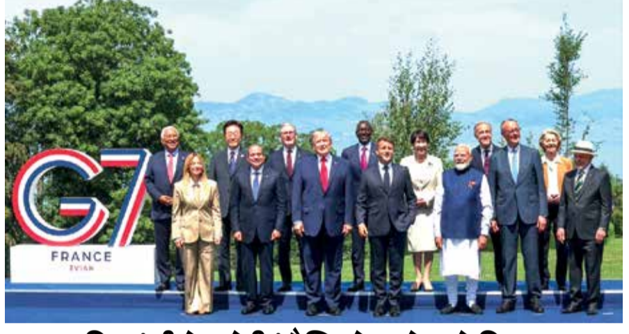
● G7 સમિટમાં પીએમ મોદીનું વૈશ્વિક નેતાઓ સાથે મિલન

(એજન્સી) એવિયન 1 તા. 16 ફ્રાન્સના એવિયન શહેરમાં આયોજિત G7 સમિટમાં ભારતના વડાપ્રધાન નરેન્દ્ર મોદી અને અમેરિકી રાષ્ટ્રપતિ ડોનાલ્ડ ટ્રમ્પની મુલાકાત ચર્ચાનો વિષય બની છે. લગભગ 16 મહિનાના લાંબા અંતરાલ બાદ બંને નેતાઓ એકબીજાને મળ્યા હતા. સમિટ દરમિયાન બંને નેતાઓ એકસાથે બેઠેલા જોવા મળ્યા હતા અને તેમની વચ્ચે અંદાજે 5 મિનિટ સુધી મહત્વપૂર્ણ વાતચીત થઈ હતી. વડાપ્રધાન મોદીની આ G7 મુલાકાત ભારતની વિદેશ નીતિની મજબૂતી અને તેની નેતૃત્વ ક્ષમતાને વૈશ્વિક સ્તરે પ્રસ્થાપિત કરે છે.