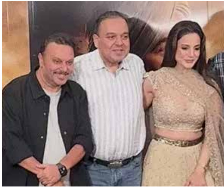
મુંબઈ | તા 16

ફિલ્મનો કેન્ડ એટલો બધો હતો કે સિનેમાઘરોની બહાર સવારથી લાંબી કતારો લાગી જતી હતી. તે જ દિવસે આમિર ખાનની ફિલ્મ 'લગાન' પણ રિલીઝ થઈ હતી, જોકે કલેશ છતાં બંને ફિલ્મોએ શાનદાર પ્રદર્શન કર્યું.