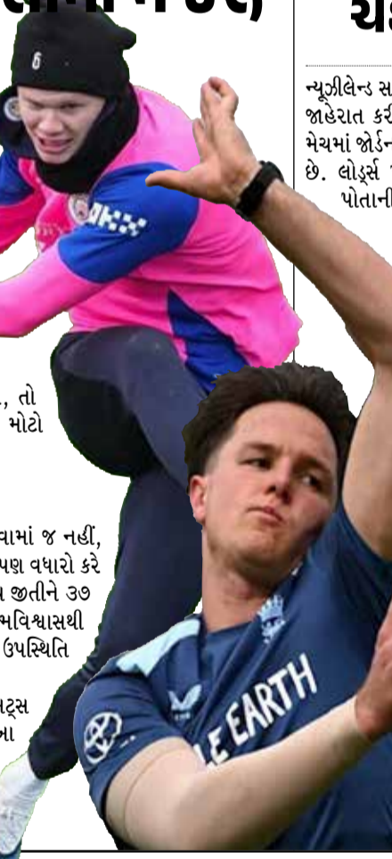
એલિંગને તક આપો છો, તો તે ગોલ કરવામાં માહિર છે અને તે વિશ્વકપમાં ચોક્કસપણે મોટો પ્રભાવ પાડશે.”

ફિફા વિશ્વકપમાં આજે નોર્વે અને ઈરાક વચ્ચેની મેચ પર સમગ્ર ફૂટબોલ જગતની નજર ટકેલી છે. ૨૮ વર્ષના લાંબા અંતરાલ બાદ નોર્વે વિશ્વકપમાં વાપસી કરી રહ્યું છે, ત્યારે તેમના સ્ટાર સ્ટ્રાઈકર એલિંગ હાલન્ડની રમતના જાદુને જોવા માટે ચાહકો આતુર છે. નોર્વેના કોચ સ્ટેલે સોલબાકેને હાલન્ડના વખાણ કરતા કહ્યું હતું કે, “જો તમે તે ગોલ કરવામાં માહિર છે અને તે વિશ્વકપમાં ચોક્કસપણે મોટો પ્રભાવ પાડશે.”