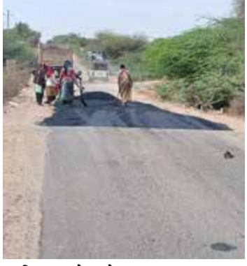
સુરક્ષિત બનશે અને વાહનવ્યવહાર સુગમ બનશે. સ્થાનિક ગ્રામજનોએ માર્ગ રહ્યું છે તેમજ પાપડી ઊભી ગયેલા આભાર વ્યક્ત કર્યો છે તથા બાકી રહેલા માર્ગના ભાગોમાં પણ ગુણવત્તાયુક્ત સમારકામ કરવાની માંગ કરી છે.