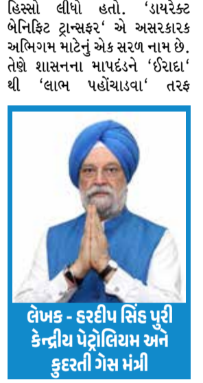
લોપક - સરવેપલ્લી સિંહ પુરી કેન્દ્રીય પેટ્રોલિયમ અને કુદરતી ગેસ મંત્રી

પહોંચ કેવી રીતે સુનિશ્ચિત કરવી તે શીખ્યા ન હતા. દિલ્હીમાં જાહેર કરાયેલી મજાનો અભાવ અને ગામડાઓમાં મળતા લાભો વચ્ચેનો તફાવત એ હતો કે બધા પૈસા ગાયબ થઈ ગયા. ભૂતપૂર્વ પ્રધાનમંત્રીનું માનવું હતું કે દરેક રૂપિયામાંથી માત્ર પંદર પૈસા ગરીબો સુધી પહોંચે છે, તે મોડેલ પર એક પ્રકારનો ચૂકાદો હતો. સરકાર યોજનાઓ બનાવી શકતી નથી. 2014માં મોદીજીના વારસાનો પણ આલો જ પ્રમાણિક હિસાબ જરૂરી છે. તેમણે એક એવી અર્થવ્યવસ્થાનો કાર્યભાર સંભાળ્યો જેને બજારોએ નાજુક પાંચમાં વર્ગીકૃત કરી હતી, એ અટકલા પ્રોજેક્ટ્સ, તાજી સ્મૃતિમાં રહેલી બે ઓકડાની મોંઘવારી, અને રાજ્યમાં જ જનતાના વિશ્વાસને ખતમ કરી નાખનારા ભ્રષ્ટાચારથી દબાયેલી હતી. તેમનો જવાબ એક તદ્દન અલગ મશીન હતી. યોજના આયોગના સ્થાને નીતિ આયોગ આવ્યું, જે રાજ્યોને સૂચના આપવાને બદલે તેમને અક્રિય કરે છે. ઓળખ (આધાર), એક બેંક ખાતું અને એક મોબાઈલ ફોનને એક સ્ટરમાં જોડવામાં આવ્યા, અને સરકારે નાગરિકોને સીધા જ ચૂકવણી કરવાનું શરૂ કર્યું, તે મધ્યસ્થીઓના બદલે જેમણે ચાર દાયકાઓ સુધી પોતાનો