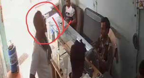
તેને વિશ્વાસમાં લીધો અને કહ્યું કે, 'હું મારા ફોન પે પરથી તમને રૂ. ૮,૦૦૦ મોકલી દઈ, તમે મને રોકડા આપો.' આમ કહીને તેણે

(એજન્સી) લાહર | તા.16 ભાભર ખાતે એસબીઆઈ બેંક નજીક આવેલા જન સેવા કેન્દ્ર પર એક વ્યક્તિ સાથે ફોન પેના બહાને રૂ. ૮,૦૦૦ની ઇન્ટરપિંડી થઈ છે. આ ઘટનામાં એક અજાણ્યો ઈસમ સીસીટીવી કેમેરામાં કેદ થયો છે. બનાવની વિગત મુજબ, ભાભર-દિયોદર રોડ પર આવેલા જન સેવા કેન્દ્ર ખાતે એક વ્યક્તિ અન્ય ખાતામાં રૂ. ૮,૦૦૦ જમા કરાવવા આવ્યો હતો. તે સમયે એક અજાણ્યો ઈસમે