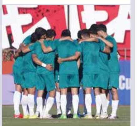
(એજન્સી) લોસ એન્જલસ । તા. 16

અમેરિકાના લોસ એન્જલસમાં રમાઈ રહેલા ફિફા વિશ્વકપ દરમિયાન એક અસામાન્ય દ્રશ્ય જોવા મળ્યું હતું. ઈરાનની ટીમ અને ન્યૂઝીલેન્ડ વચ્ચેની મેચ દરમિયાન ઈરાની સમર્થકોએ ફિફાના સખત પ્રતિબંધોને અવગણીને સ્ટેડિયમમાં ક્રાંતિ પૂર્વેના ઈરાની વ્જજ લહેરાવ્યા હતા. આ ઘટનાએ વિશ્વકપના સુરક્ષા અને નિયમોના અમલીકરણ પર અનેક સવાલો ઊભા કર્યાં છે.