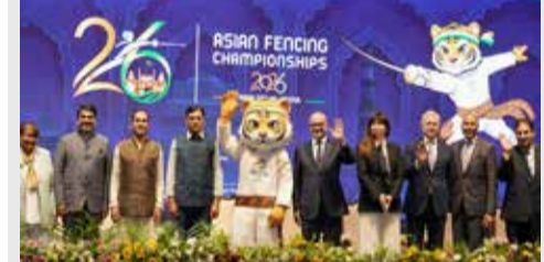
(એજન્સી) નવી દિલ્હી | તા. 20

દિલ્હીના આઈઓકોનિક ‘ભારત મંડપમ’ ખાતે ‘એક સ્વપ્ન, એક તલવાર, એક ગોરવ’ના સુત્ર સાથે સીનિયર એશિયન ફેન્સિંગ ચેમ્પિયનશિપ ૨૦૨૬નો ભવ્ય અને રંગારંગ પ્રારંભ થયો છે. ભારતમાં પ્રથમ વખત આટલી મોટી આંતરરાષ્ટ્રીય ફેન્સિંગ સ્પર્ધાનું આયોજન થઈ રહ્યું છે, જે દેશ માટે એક ઐતિહાસિક સિદ્ધિ સમાન છે. ઉદઘાટન સમારોહમાં ૩૦ થી વધુ દેશોના ૪૦૦ થી વધુ શ્રેષ્ઠ ખેલાડીઓનું સ્વાગત કરવામાં આવ્યું હતું. આ પ્રસંગે મુખ્ય અતિથિ તરીકે ઉપસ્થિત કેન્દ્રીય મંત્રી મનસુખ માંડવિયાએ ટૂર્નામેન્ટનું વિધિવત ઉદ્ઘાટન કર્યું હતું. તેમણે જણાવ્યું હતું કે, “વડાપ્રધાન નરેન્દ્ર મોદીના નેતૃત્વમાં ભારતીય રમતગમતનું ચિત્ર બદલાઈ રહ્યું છે. ફેન્સિંગ તો આપણી સંસ્કૃતિનો ભાગ છે, જે ઝડપ, રણનીતિ અને સાહસનું પ્રતીક છે.” મંત્રીશ્રીએ ભારતની ૨૦૩૬ ઓલિમ્પિક યોજવાની મહત્વકાંક્ષાનો ઉલ્લેખ કરતા કહ્યું કે, સરકાર રમતગમતના વિશ્વસ્તરીય માળખાના નિર્માણ માટે પ્રતિબદ્ધ છે. આ સ્પર્ધામાં આંતરરાષ્ટ્રીય ફેન્સિંગ ફેડરેશન અને એશિયન ફેન્સિંગ કોન્ફેડરેશનના ઉચ્ચ અધિકારીઓ પણ ઉપસ્થિત રહ્યા હતા. આંતરરાષ્ટ્રીય ફેન્સિંગ ફેડરેશનના પ્રમુખ અહેલમોનીમ હાલ હુસેનીએ ભારતની યજમાની વખાણ કરતા કહ્યું કે, એશિયા હવે ફેન્સિંગની ટુર્નામેન્ટમાં એક શક્તિશાળી કેન્દ્ર બની ગયું છે. આ આયોજનથી ભારતની ક્ષમતા અને આંતરરાષ્ટ્રીય સ્તરની સ્પર્ધાઓ યોજવાની તૈયારીઓ વિશ્વ સમક્ષ સ્પષ્ટ થઈ છે.