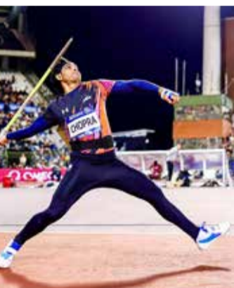
(એજન્સી) નવી દિલ્હી | તા. 20

ભારતના ભાલા ફેંકના દિગ્ગજ એથ્લીટ નીરજ ચોપરાએ લાંબા સમય બાદ આંતરરાષ્ટ્રીય મેદાન પર ફરી એકવાર પોતાની ક્ષમતા સાબિત કરી છે. કમરની ઈજાને કારણે છેલ્લા આઠ મહિનાથી સ્પર્ધાથી દૂર રહેલા નીરજ ચોપરાએ ઘોડા ડાયમંડ લીગ ૨૦૨૬માં શાનદાર વાપસી કરી છે. આ સ્પર્ધામાં તેમણે ૮૫.૬૯ મીટરના શ્રો સાથે આગામી કોમનવેલ્થ ગેમ્સ માટે ક્વોલિફાઈ કરીને પોતાના ચાહકોને મોટી ખુશખબર આપી છે.