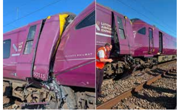
(એજન્સી) લંડન | તા. 20

બ્રિટનની રાજધાની લંડન નજીક શુક્રવારે સાંજે એક અત્યંત કડુણ અને ગમગીન ટ્રેન અકસ્માતની ઘટના સામે આવી છે. લંડનથી આશરે ૮૦ કિલોમીટર દૂર આવેલા બેડફોર્ડ વિસ્તારમાં બે પેસેન્જર ટ્રેનો સામ-સામે અથડાતા અરેરાટી વ્યાપી ગઈ છે. આ ભયાનક ટકરમાં એક ટ્રેન ચાલકનું મોત નીપજ્યું છે, જ્યારે ૮૮ થી વધુ મુસાફરો ઈજાગ્રસ્ત થયા છે. ઘટનાની ગંભીરતાને જોતા વહીવટીતંત્ર દ્વારા તાત્કાલિક ‘મેજર ઈન્સિડન્ટ’ જાહેર કરવામાં આવ્યો છે.