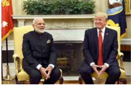
કુશળતાનો પુરાવો છે. ટ્રમ્પના મતે, આટલી વિશાળ વસ્તી ધરાવતા દેશનું નેતૃત્વ શાંતિપૂર્ણ રીતે કરવું એ કોઈ નાની સિદ્ધિ નથી.

અમેરિકાના પ્રમુખ ડોનાલ્ડ ટ્રમ્પે ફરી એકવાર ભારતના વડાપ્રધાન નરેન્દ્ર મોદીની નેતૃત્વ ક્ષમતાના મુક્તકંઠે વખાણ કર્યા છે. એક વિશેષ ઈન્ટરવ્યૂ દરમિયાન, ટ્રમ્પે વડાપ્રધાન મોદીને વિશ્વના બે સૌથી પ્રભાવશાળી અને મહાન નેતાઓમાં સ્થાન આપ્યું છે. ટ્રમ્પે સ્પષ્ટ શબ્દોમાં જણાવ્યું હતું કે, તેઓ નરેન્દ્ર મોદી અને ચીનના પ્રમુખ શી જિનપિંગની કાર્યશૈલીથી અત્યંત પ્રભાવિત છે. આ નિવેદન એવા સમયે આવ્યું છે જ્યારે ભારત વૈશ્વિક મંચ પર એક નિર્ણાયક શક્તિ તરીકે ઉભરી રહ્યું છે.