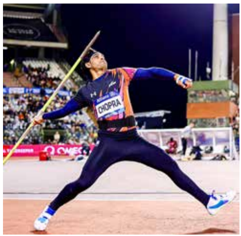
(એજન્સી) નવી દિલ્હી | તા. 20

ભારતના ભાલા ફેંકના દિગ્ગજ એથ્લીટ નીરજ ચોપરાએ લાંબા સમય બાદ આંતરરાષ્ટ્રીય મેદાન પર ફરી એકવાર પોતાની ક્ષમતા સાબિત કરી છે. કમરની ઈજાને કારણે છેલ્લા આઠ મહિનાથી સ્પર્ધાથી દૂર રહેલા નીરજ ચોપરાએ ઘોડા ડાયમંડ લીગ ૨૦૨૬માં શાનદાર વાપસી કરી છે. આ સ્પર્ધામાં તેમણે ૮૫.૬૯ મીટરનો શ્રો સાથે આગામી કોમનવેલ્થ ગેમ્સ માટે ક્વોલિફાઈ કરીને પોતાના ચાહકોને મોટી ખુશખબર આપી છે.