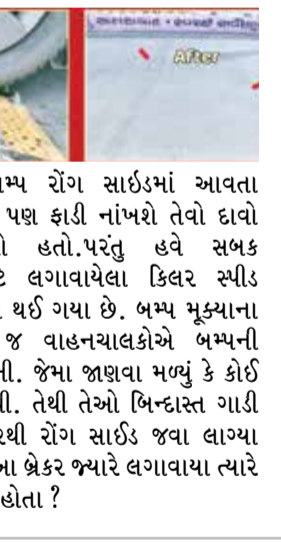
હતા. કિલર બમ્પ રોંગ સાઈડમાં આવતા વાહનોના ટાયર પણ ફાડી નાંખશે તેવો દાવો કરવામાં આવ્યો હતો. પરંતુ હવે સભક શીખવાડવા માટે લગાવાયેલા કિલર સ્પીડ બ્રેકરનું જ ગાયબ થઈ ગયા છે. બમ્પ મૂક્યાના થોડા સમયમાં જ વાહનચાલકોએ બમ્પની ચકાસણી કરી હતી. જેમાં જાણવા મળ્યું કે કોઈ ટાયર ફાટતા નથી. તેથી તેઓ બિન્દાસ્ત ગાડી લઈને તેના ઉપરથી રોંગ સાઈડ જવા લાગ્યા હતા. મતલબ કે આ બ્રેકર જ્યારે લગાવાયા ત્યારે જ કોઈ કામના નહોતા ?

અમદાવાદમાં રોંગ સાઈડ રાજુને રોકવા માટે મનપાએ ટાયર કિલર બમ્પ લગાવ્યા હતા. કિલર બમ્પ લગાવ્યા ત્યારથી તેને લઈને અનેક સવાલો પણ ઉભા થયા હતા. પરંતુ હવે તો આખેઆખા કિલર બમ્પ ગાયબ થઈ ગયા છે. અમદાવાદના ચાણક્યપુરીના બ્રીજના પાસે મનપાએ ઓગસ્ટ મહિનામાં કિલર બમ્પ લગાવ્યા હતા. આ કિલર બમ્પ અત્યારે ગાયબ થઈ ગયા છે. ટ્રાફિક નિયંત્રણ કરવા અને રોંગ સાઈડ આવતા વાહનોને રોકવા માટે કિલર બમ્પ નાખવામાં આવ્યા હતા. મનપાએ મોટા ઉપાડે મુકેલા કિલર બમ્પનું ક્યાંય નામોનિશાન જોવા મળતુ નથી. અમદાવાદમાં બેફામ ઝડપે ગાડી કંકારતા નબીરાઓ અને નાગરિકોને પાઠ ભણાવવા મનપાએ મોટા ઉપાડે ટાયર કિલર બમ્પ નાંખ્યા છે.