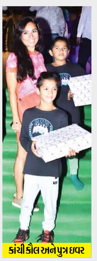
કાંગા રાણા અને પુત્ર ઇવર

જીતેન્દ્ર સફેદ કુર્તા-પાયજામામાં જોવા મળ્યા હતા. તેમણે ઉપર પીળા રંગનો ઓવરકોટ પહેર્યો હતો. આ પાર્ટીમાં તુષાર કપૂર પણ જોવા મળ્યો હતો. શિલા શેટ્ટી પતિ રાજ કુન્દ્રા અને પુત્રી સાથે જોવા મળી હતી. બંને તેમની પુત્રીનો હાથ પકડીને પાપારાઝી માટે પોઝ આપતા જોવા મળ્યા હતા. એકતા કપૂરના પુત્ર રવિનો જન્મ 27 જાન્યુઆરી 2019ના રોજ સરોગસી દ્વારા થયો હતો. તેમણે પોતાના પુત્રનું નામ રવિ તેના પિતા જીતેન્દ્રના સાચા નામ પરથી રાખ્યું છે. પિતાએ કહ્યું હતું- લગન કરો અથવા કામ કરો એકતાએ એક ઈન્ટરવ્યુમાં કહ્યું હતું- જ્યારે હું 17 વર્ષની હતી ત્યારે મારા પિતાએ કહ્યું હતું કે, 'કાં તો લગન કરી લો અથવા પાર્ટી કરવાને બદલે મારી ઈચ્છા મુજબ કામ કરો'. તેમણે મને કહ્યું કે તે મને પોકેટ મની સિવાય બીજું કંઈ નહીં આપે. પછી વધારાના પૈસા કમાવવા માટે મેં એક એડ એજન્સીમાં કામ કરવાનું શરૂ કર્યું હતું.