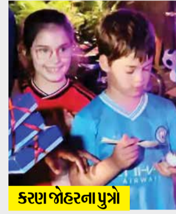
કારણા જોહરના પુત્રો