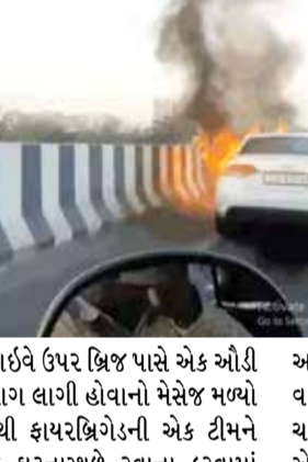
એસજી હાઈવે ઉપર બ્રિજ પાસે એક ઓડી કારમાં આગ લાગી હોવાનો મેસેજ મળ્યો હતો. જેથી ફાયરબ્રિગેડની એક ટીમને તાત્કાલિક ઘટનાસ્થળે રવાના કરવામાં

શહેરના એસજી હાઈવે ઉપર આવેલા ઝાયડસ બ્રિજ ઉપર આજે 26 જાન્યુઆરીના રોજ સાંજે ઓડી કારમાં અચાનક આગ લાગી હતી. એન્જિનમાંથી ધુમાડા નીકળતા કારચાલક બહાર નીકળી ગયો હતો. કારના આગળના એન્જિનના ભાગમાં ભીષણ આગ લાગી હતી. જેથી ફાયર બ્રિગેડની ટીમને જાણ કરવામાં આવતા ફાયરબ્રિગેડની એક ગાડી તાત્કાલિક ઘટનાસ્થળે રવાના કરવામાં આવી હતી.