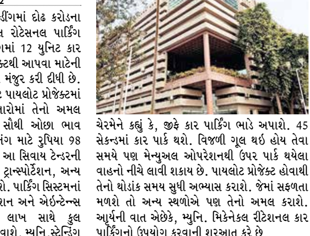
ચેરમેને કહ્યું કે, જુકે કાર પાર્કિંગ ભાડે અપાશે. 45 સેકન્ડમાં કાર પાર્ક થશે. વિજળી ગુલ થઈ હોય તેવા સમયે પણ મેન્યુઅલ ઓપરેશનથી ઉપર પાર્ક થયેલા વાહનો નીચે લાવી શકાય છે. પાયલોટ પ્રોજેક્ટ હોવાથી તેનો થોડાંક સમય સુધી અભ્યાસ કરાશે. જેમાં સફળતા મળશે તો અન્ય સ્થળોએ પણ તેનો અમલ કરાશે. આર્થિકની વાત એ છે, મ્યુનિ. મિકેનિકલ રોટેશનલ કાર પાર્કિંગનો ઉપયોગ કરવાની શરૂઆત કરે છે

મ્યુનિ.ના દાણાપીઠ ખાતેના બિલ્ડિંગમાં દોઢ કરોડના ખર્ચે પ્રાયોગિક ધોરણે મિકેનિકલ રોટેશનલ પાર્કિંગ બનાવશે. જેમાં એક નંગ પાર્કિંગમાં 12 યુનિટ કાર પાર્કિંગ રહેશે. પાંચ વર્ષના કોન્ટ્રાક્ટથી આપવા માટેની દરખાસ્ત મ્યુનિ.સ્ટેન્ડિંગ કમિટીએ મંજૂર કરી દીધી છે. ટ્રાફિકની સમસ્યાના નિવારણ માટે પાયલોટ પ્રોજેક્ટમાં સફળતા મળશે તો અન્ય વિસ્તારોમાં તેનો અમલ કરાશે. મ્યુનિ.દ્વારા ઈ-ટેન્ડરમાં સૌથી ઓછા ભાવ ભરનાર પાનગી કંપનીને પ્રતિ નંગ માટે રૂપિયા 98 લાખના ભાવથી કામ સોંપાયું છે. આ સિવાય ટેન્ડરની રકમ ઉપરાંત 18 ટકા જીએસટી, ટ્રાન્સપોર્ટેશન, અન્ય ખર્ચ પણ કંપનીને ચૂકવવામાં આવશે. પાર્કિંગ સિસ્ટમમાં પાંચ વર્ષના કોન્ટ્રાક્ટથી ઓપરેશન અને એઈન્ટેન્સ કોન્ટ્રાક્ટ માટે કુલ 23.03 લાખ સાથે કુલ 1,53,61,540 રકમ કંપનીને ચૂકવાશે. મ્યુનિ.સ્ટેન્ડિંગ