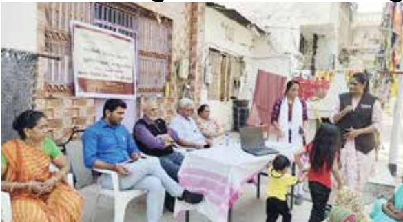
ગાંધીનગર સંવાદદાતા | વિજયવીર યાદવ

નિદાન અને અવેરનેસ કેમ્પનું આયોજન કર્યું છે. આ કેમ્પ ૨૯ એપ્રિલ ૨૦૨૪ સુધી વિવિધ તબક્કાઓમાં અમદાવાદ મ્યુનિસિપલ કોર્પોરેશનના તમામ ઝોન તેમજ વોર્ડમાં યોજાશે.