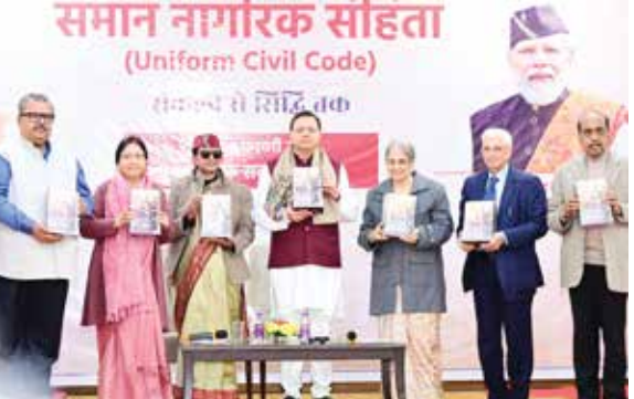
દેસાઈના નેતૃત્વમાં પાંચ સભ્યોની સમિતિની રચના કરવામાં આવી હતી. સિક્કિમ હાઈકોર્ટના ભૂતપૂર્વ મુખ્ય ન્યાયાધીશ શ્રી પ્રમોદ કોહલી, ઉત્તરાખંડના ભૂતપૂર્વ મુખ્ય સચિવ શ્રી શરુજન સિંહ, દૂન યુનિવર્સિટીના વાઈસ ચાન્સલર પ્રો. સુરેષા ડાંગવાલ અને સામાજિક કાર્યકર શ્રી મનુ ગોસ્વામી સમિતિમાં સમાવે કરવામાં આવ્યો હતો. સમિતિ દ્વારા બે પેટા સમિતિઓની પણ રચના કરવામાં આવી હતી. જેમાંથી એક પેટા સમિતિનું કામ 'કોડ'નો ડ્રાફ્ટ તૈયાર કરવાનું હતું. બીજી પેટા સમિતિનું કામ રાજ્યના રહેવાસીઓ પાસેથી સૂચનો આમંત્રિત કરવાનું અને સંવાદ સ્થાપિત કરવાનું હતું. સમિતિએ દેશના પ્રથમ ગામ માણાથી જનસંવાદ કાર્યક્રમની શરૂઆત કરી હતી અને રાજ્યના તમામ જિલ્લાઓમાં તમામ વર્ગના લોકો પાસેથી સૂચનો મેળવ્યા હતા.

દેહરાદૂન : ઉત્તરાખંડમાં યુનિફોર્મ સિવિલ કોડ માટે નિવૃત્ત ન્યાયાધીશ શ્રીમતી રજના પ્રકાશ દેસાઈના નેતૃત્વમાં રચાયેલી સમિતિએ શુક્રવારે મુખ્ય પ્રધાન શ્રી પુષ્કર સિંહ ધામીને ડ્રાફ્ટ સુપરત કર્યો હતો. મુખ્યમંત્રી કેમ્પ ઓફિસ સ્થિત મુખ્ય સેવક સન ખાતે આયોજિત એક કાર્યક્રમમાં મુખ્યમંત્રીએ કહ્યું કે 2022ની વિધાનસભાની ચૂંટણી પહેલા અમે ઉત્તરાખંડ રાજ્યના લોકોને વચન આપ્યું હતું કે અમે ઉત્તરાખંડમાં સમાન નાગરિક સંહિતા લાવીશું. ભારતીય જનતા પાર્ટી, મુખ્યમંત્રીએ જણાવ્યું હતું કે અમારા વચન મુજબ, સરકારની રચના પછી તરત જ પ્રથમ કેબિનેટ બેઠકમાં, અમે સમાન નાગરિક સંહિતા ઘડવા માટે નિષ્ણાત સમિતિની રચના કરવાની નિર્ણય લીધો હતો અને 27 મે 2022ના રોજ સુપ્રીમ કોર્ટના નિવૃત્ત ન્યાયાધીશ શ્રીમતી રજના પ્રકાશ