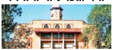
અમદાવાદ | તા.02

ગુજરાત યુનિવર્સિટીના નવા કુલપતિના એક નિર્ણયથી લાખો રૂપિયા ફી ભરેલા વિદ્યાર્થીઓ રખડતા થયા