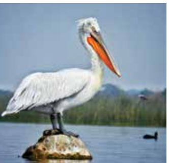
ગાંધીનગર સંવાદદાતા | વિજયવીર યાદવ

ગુજરાતનું પક્ષીતીર્થ નળસરોવર સહેલાણીઓ ઉપરાંત દેશ વિદેશમાં વિખ્યાત છે. ‘અમદાવાદથી આશરે ૬૨ કિ.મી જ્યારે સાણંદથી ૪૨ કિ.મી દૂર આવેલું નળસરોવર સૌથી મોટું જળપક્ષી અભયારણ્ય અને છીછરા પાણીના સૌથી મોટા સરોવર પૈકીનું એક છે. ગુજરાત વન્યપ્રાણી અને વન્યપક્ષી રક્ષણ અધિનિયમ-૧૯૮૬ની જોગવાઈઓ અંતર્ગત ૮ એપ્રિલ ૧૯૮૬ના રોજ નળસરોવરના ૧૧૫ ચો.કિ.મી વિસ્તારને પક્ષી અભયારણ્ય તરીકે જાહેર કરવામાં આવ્યું. ત્યારબાદ પાછળથી વધારાના ૫.૮૨ ચો.કિ.મી વિસ્તારને ૨૮