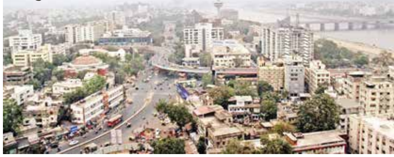
અમદાવાદ | તા.02

ગુજરાતના હવામાન વિભાગ દ્વારા સમગ્ર રાજ્યમાં આગામી પાંચ દિવસ વાતાવરણ કેવું રહેશે તે અંગેની આગાહી કરવામાં આવી છે. હવામાન વિભાગ દ્વારા કરવામાં આવેલી આગાહી મુજબ આગામી પાંચ દિવસ ગુજરાતમાં બેવડી ઋતુનો અનુભવ થશે. પવનની દિશા બદલાતા વહેલી સવારે થોડા અંશે ઠંડીનો અનુભવ થઈ શકે છે અને ધુમ્મસ ભર્યું વાતાવરણ રહેવાની શક્યતાઓ છે. આ સાથે જ બપોર બાદ