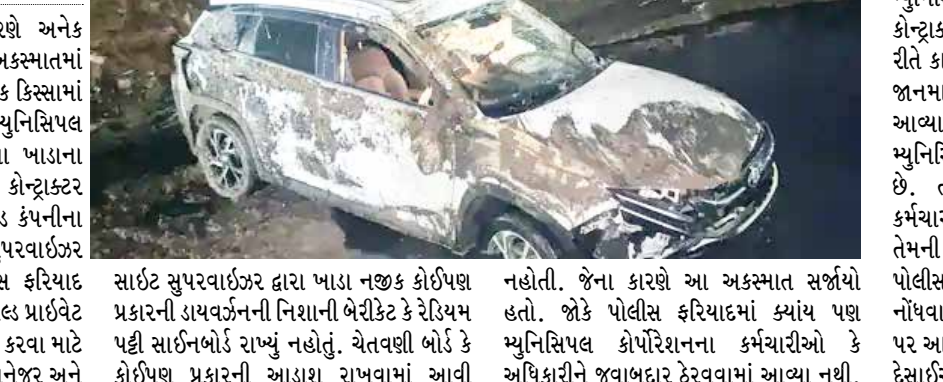
સાઈટ સુપરવાઇઝર દ્વારા ખાડા નજીક કોઈપણ પ્રકારની ડાયવર્જનની નિશાની બેરીકેટ કે રેરિયમ પટ્ટી સાઈનબોર્ડ રાખ્યું નહોતું. ચેતવણી બોર્ડ કે કોઈપણ પ્રકારની આગાશી રાખવામાં આવી નહોતી. જેના કારણે આ અકસ્માત સર્જાયો હતો. જોકે પોલીસ ફરિયાદમાં ક્યાંય પણ મ્યુનિસિપલ કોર્પોરેશનના કર્મચારીઓ કે અધિકારીને જવાબદાર ઠેરવવામાં આવ્યા નથી.

અમદાવાદ શહેરમાં ખાડાના કારણે અનેક અકસ્માતો થતા હોય છે. આ અકસ્માતમાં નાગરિકોને ઈજા પહોંચે છે તો કેટલાક કિસ્સામાં મૃત્યુ પણ થતા હોય છે. અમદાવાદ મ્યુનિસિપલ કોર્પોરેશન દ્વારા ખોદવામાં આવેલા ખાડાના કારણે થયેલા અકસ્માત મામલે કોન્ટ્રાક્ટર RKC ઈન્ક બિલ પ્રાઇવેટ લિમિટેડ કંપનીના પ્રોજેક્ટ મેનેજર અને સાઈટ સુપરવાઇઝર સહિતના કર્મચારીઓ સામે પોલીસ ફરિયાદ નોંધવામાં આવી છે. RKC ઈન્ક બિલ પ્રાઇવેટ લિમિટેડ નામની કંપનીએ રોડનું કામ કરવા માટે ખાડો કર્યો હતો. કંપનીના પ્રોજેક્ટ મેનેજર અને