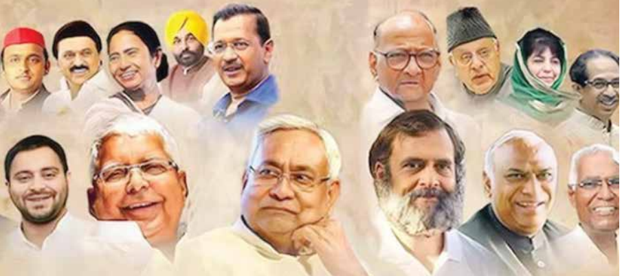
પ.બંગાળ પહોંચી ગઈ છે. ગુરુવારે ડાબેરી કાર્યકરો અને સમર્થકોની એક ભીડ રાહુલ ગાંધીની ભારત જોડો ન્યાય યાત્રામાં જોડાઈ હતી. સીપીઆઈ (એમ) ના પ્રદેશ સચિવ મોહમ્મદ સલીમે પાર્ટીની કેન્દ્રીય સમિતિના સભ્ય સુજન ચક્રવર્તી અને અન્ય નેતાઓ સાથે રઘુનાથગંગા ખાતે રાહુલ ગાંધી સાથે મુલાકાત કરી હતી.

નવી દિલ્હી : I.N.D.I.A ગઠબંધનને વધુ એક મોટો આંચકો લાગવાની તેવારી છે. નીતીશ કુમાર બાદ હવે તુણમૂલ કોંગ્રેસના સુપ્રીમો મમતા બેનરજી પર ગઠબંધન સાથે છેડો ફાડી શકે છે. પ.બંગાળના મુખ્યમંત્રી મમતા બેનરજી દ્વારા કોંગ્રેસ અને ડાબેરી પક્ષો પર સતત હુમલા વચ્ચે ડાબેરી પક્ષોના નેતાઓએ કોંગ્રેસ નેતા રાહુલ ગાંધી સાથે મુલાકાત કરી હતી. જેમાં તેમણે દાવો કર્યો કે તુણમૂલ કોંગ્રેસ ટૂંક સમયમાં જ I.N.D.I.A ગઠબંધનથી કિનારો કરી લેશે. ઉલ્લેખનીય છે કે રાહુલ ગાંધીની ભારત જોડો ન્યાય યાત્રા