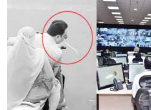
આવે. તેમજ જાહેર રોડ પાનની પિચકારીઓ મારી ગંદકી ન કરે તેના માટે અવેરનેસ કાર્યક્રમ કરવા માટે જણાવ્યું હતું. આજે મળેલી

જો હવે તમે રોડ ઉપર પાન-મસાલાની પિચકારી મારશો તો તમારે રૂપિયા 500 સુધીનો દંડ ચૂકવવો પડશે. રોડ ઉપર ચાલતા જતા અથવા તો ચિલિકલ ઉપર જતા લોકો પિચકારી મારી ગંદકી ફેલાવતા હોય છે, જેના કારણે શહેરમાં સ્વચ્છતા જળવાતી નથી. આજે મળેલી રીયુ બેઠકમાં મ્યુનિસિપલ કમિશનર એમ થેનારેસને સોલિડ વેસ્ટ મેનેજમેન્ટ વિભાગના અધિકારીઓને સૂચના આપી હતી કે, જાહેરમાં જે પણ લોકો થૂંકી ગંદકી ફેલાવે છે, તેવા લોકોને દંડ કરી કાર્યવાહી કરવામાં