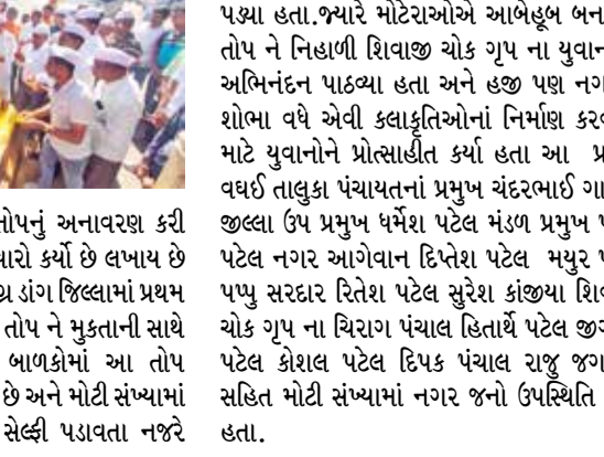
વિસ્તારોમાં ઠેર ઠેર શોભાયાત્રા અને રેલીનું આયોજન કરવામાં આવ્યું હતું. વઘઈ નગરમાં અંબા માતા ના મંદિરેથી લઈ શિવાજી ચોક થઈને ગાંધી મેદાન ચાર રસ્તા સુધી બાઈક રેલી નું આયોજન કરવામાં આવ્યું હતું.

સુશીલ પવાર | ડાંગ જિલ્લામાં છત્રપતિ શિવાજી મહારાજની જન્મ જયંતી નિમિત્તે ઠેર ઠેર રેલી અને શોભાયાત્રાનું આયોજન કરવામાં આવ્યું હતું. જેમાં મોટી સંખ્યામાં લોકો જોડાયા હતા અને એક તહેવારની જેમ જન્મ જયંતીને ઉજવી હતી. ભારત માતાના વીરસૂતોમાંના એક છત્રપતિ શિવાજી મહારાજને ભારતીય ગણરાજ્યના મહાનાયક માનવામાં આવે છે. ત્યારે મરાઠા સામ્રાજ્યનો પાયો નાખનાર એવા છત્રપતિ શિવાજી મહારાજની ૩૮૪ મી જન્મ જયંતી નિમિત્તે ડાંગ જિલ્લાના લોકોમાં ભારે ઉત્સાહ જોવા મળ્યો હતો. જિલ્લામાં આહવા, સાપુતારા, વઘઈ જેવા વિસ્તારોમાં ઠેર ઠેર શોભાયાત્રા અને રેલીનું આયોજન કરવામાં આવ્યું હતું. વઘઈ નગરમાં અંબા માતા ના મંદિરેથી લઈ શિવાજી ચોક થઈને ગાંધી મેદાન ચાર રસ્તા સુધી બાઈક રેલી નું આયોજન કરવામાં આવ્યું હતું.