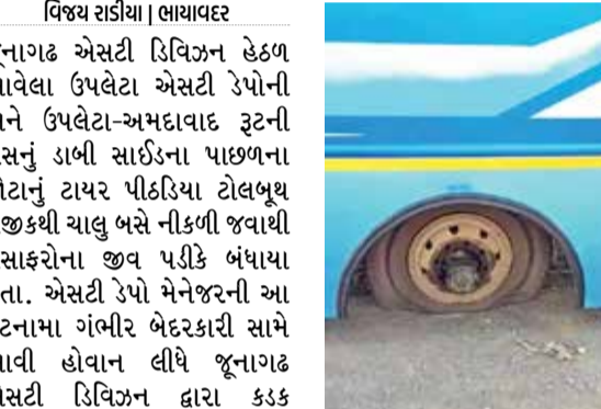
જૂનાગઢ એસટી ડિવિઝન હેટળ આવેલા ઉપલેટા એસટી ડેપોની અને ઉપલેટા-અમદાવાદ રૂટની બસનું ડાબી સાઈડના પાછળના જોટાનું ટાયર પીકડિયા ટોલબૂથ નજીકથી ચાલુ બસે નીકળી જવાથી મુસાફરોના જીવ પડીકે બંધાયા હતા. એસટી ડેપો મેનેજરની આ ઘટનામાં ગંભીર બેદરકારી સામે આવી હોવાન લીધે જૂનાગઢ એસટી ડિવિઝન દ્વારા કડક કાર્યવાહી કરવામાં આવી હતી અને ઉપલેટા એસટી ડેપોના મેનેજર સહિત ત્રણને સસપેન્ડ કરી દેવાયા હતા. વીરપુર પાસેના પીકડિયા ટોલ વાઝા પાસે શનિવારે ઉપલેટા ડેપોની એસટી

વિજય રાડીયા | ભાયાવદર જૂનાગઢ એસટી ડિવિઝન હેટળ આવેલા ઉપલેટા એસટી ડેપોની અને ઉપલેટા-અમદાવાદ રૂટની બસનું ડાબી સાઈડના પાછળના જોટાનું ટાયર પીકડિયા ટોલબૂથ નજીકથી ચાલુ બસે નીકળી જવાથી મુસાફરોના જીવ પડીકે બંધાયા હતા. એસટી ડેપો મેનેજરની આ ઘટનામાં ગંભીર બેદરકારી સામે આવી હોવાન લીધે જૂનાગઢ એસટી ડિવિઝન દ્વારા કડક કાર્યવાહી કરવામાં આવી હતી અને ઉપલેટા એસટી ડેપોના મેનેજર સહિત ત્રણને સસપેન્ડ કરી દેવાયા હતા. વીરપુર પાસેના પીકડિયા ટોલ વાઝા પાસે શનિવારે ઉપલેટા ડેપોની એસટી