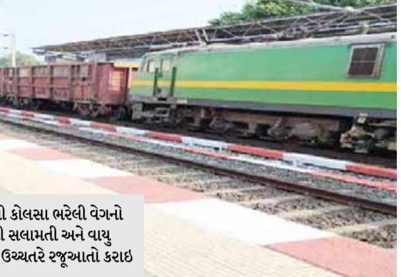
તાડપત્રી ઢાંક્યા વિના આયાતી કોલસા ભરેલી વેગનો વડોદરાથી, રેલવે મુસાફરોની સલામતી અને વાયુ પ્રદૂષણની સમસ્યાઓ સંબંધિત ઉચ્ચતરે રજૂઆતો કરાઈ

કરજણ | પશ્ચિમ રેલવે વડોદરા ડિવિઝનના દહેજ પોર્ટ રેલવે સ્ટેશનથી તાડપત્રી ઢાંક્યા વિનાના આયાતી કોલસા ભરેલા વેગનો વડોદરા તરફ જવા મિયાગામ કરજણ રેલવે સ્ટેશન ઉપરથી પૂરઝડપે રેલવે ગુડ્સ ટ્રેનો પસાર થતી હોય છે. તે દરમિયાન હવામાં કોલસાના રજકણો હવામાં ભળતાં તેમજ પ્લેટફોર્મ ઉપર નાનાંમોટાં ટુકડાંઓ પડતાં હતા. રેલવે મુસાફર જનતાની જાહેર સલામતી અને વાયુ પ્રદૂષણની સમસ્યાઓ સંબંધિત ઉચ્ચતરે રજૂઆતો કરાઈ છે. અદાણી પોર્ટ ખાતે આયાત થયેલા કોલસાના વેગનો નિયત કરતાં કન્ટેનરની બહાર એક થી ઘોઠ ફૂટ વધારે ઊંચાઈ સુધી ભરવામાં આવે છે. તેમજ રેલવેના નિયમોનુસાર કોલસાના ભુક્કા અને નાના ટુકડા ભરેલા હોય તેવા વેગનો ઉપર મજબુત તાડપત્રીઓ