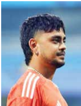
નવી મુંબઈ | તા.24

સ્ટાર ભારતીય ક્રિકેટર ઈશાન ક્રિશન છેલ્લા બે મહિનાથી ચર્ચામાં છે. ક્રિશન દક્ષિણ આફ્રિકા પ્રવાસમાંથી વિરામ લઈને ઘરે પરત ફર્યા બાદથી ક્રિકેટનાં મેદાનથી દૂર છે. આ દરમિયાન ભારતીય ક્રિકેટ