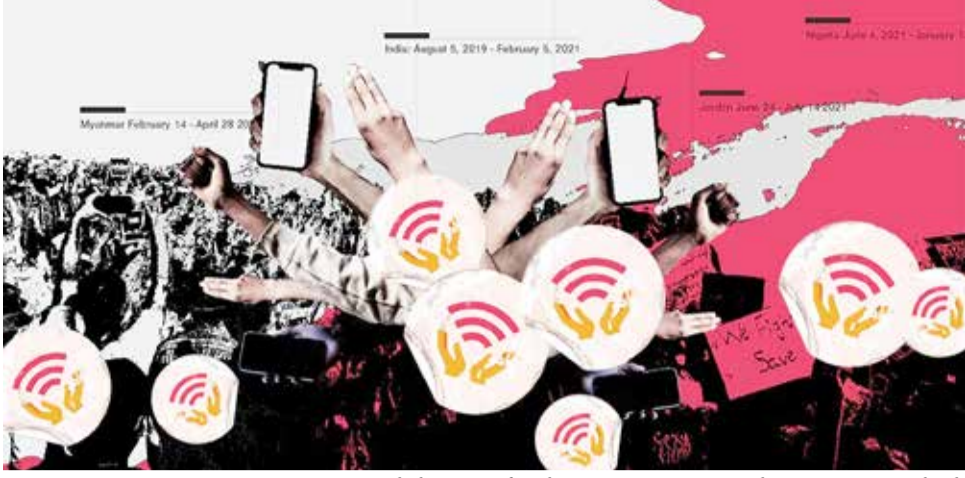
ચાલતી સત્તાની સાહમરી વિશ્વની નજરમાં ન આવે તે પણ છે. પાકિસ્તાનમાં ક્યારે નવી સરકાર રચાશે અને ક્યારે તૂટી પડશે તે કહી શકાતું નથી. પાકિસ્તાનમાં ટ્વિટર છેલ્લા ૭૨ કલાકથી બંધ છે. આમ

પાકિસ્તાનની યૂટીલીટી અને તેમાં થયેલી ઘાલમેલથી વિશ્વના ટોચના દેશો અને પાકિસ્તાનને નાણું ધીરતા દેશો નારાજ છે. પાકિસ્તાનની પ્રજા આર્થિક અંધારપટ, રાજકીય અંધારપટ બાદ હવે ડિજિટલ અંધારપટનો સામનો કરી રહી છે. છેલ્લા બે મહિનાથી પાકિસ્તાનના ૧૨૮ મિલિયન જેટલા ઇન્ટરનેટ વપરાશકારો માથું ફૂટી રહ્યા છે. ફેસબુક, યુટ્યુબ અને ઇન્સ્ટાગ્રામ જેવા સોશિયલ મીડિયા પ્લેટફોર્મ અવારનવાર ઠપ્પ થઈ રહ્યા છે. આપણે ત્યાં કિસાન ઓફલાઇન દરમ્યાન અફવાઓને કારણે આંધાધૂંધી ન ફેલાય તે માટે પંજાબ-હરિયાણાના અમુક હિસ્સાઓમાં ઇન્ટરનેટ બંધ કરી દેવાયું હતું. મહિલાઓના હિંસાચાર દરમ્યાન પણ ઇન્ટરનેટ બંધ હતું, તો ઉત્તરાખંડમાં તાજેતરમાં થયેલાં તોફાનો વખતે પણ ઇન્ટરનેટ બંધ કરી દેવામાં આવ્યું હતું. ભારતમાં ઇન્ટરનેટ બંધ થાય તોય તે બહુ ટૂંકી અવધિ માટે હોય છે અને તે પણ મર્યાદિત વિસ્તારોમાં જ. આ અંગે આગોતરી જાહેરાત પણ કરી દેવામાં આવે છે. પાકિસ્તાનમાં તો કશી જ પૂર્વસૂચના વગર આખા દેશમાં ઇન્ટરનેટ બંધ રખાયું છે. પાકિસ્તાનમાં ઇન્ટરનેટ બંધ રાખવાનું એક કારણ ત્યાં