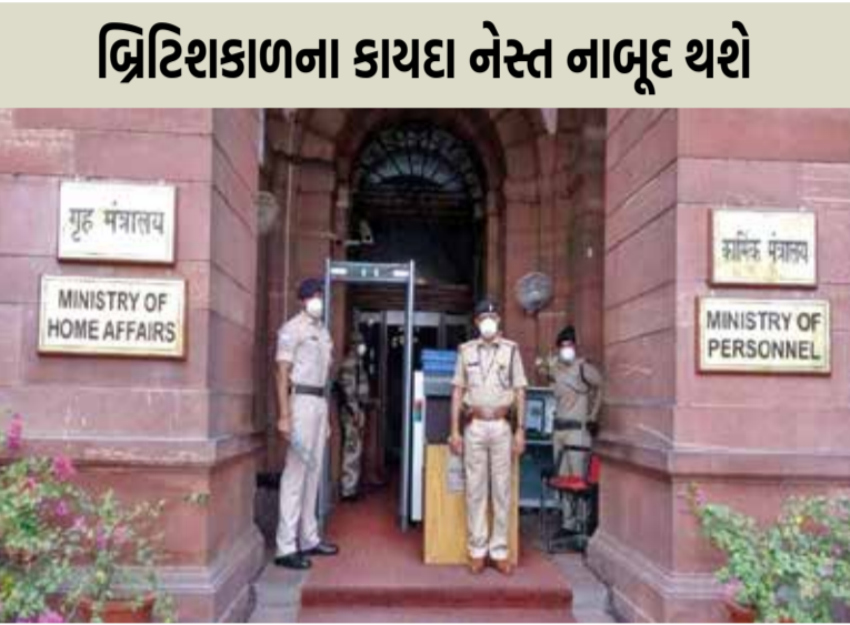
બ્રિટિશકાળના કાયદા નેસ્ટ નાબૂદ થશે

દેશમાં ક્રિમિનલ જસ્ટિસ સિસ્ટમને સંપૂર્ણપણે બદલવા માટે 1 જુલાઈથી ત્રણ નવા કાયદા અમલમાં આવશે. આ ત્રણ કાયદા ભારતીય ન્યાયિક સંહિતા, ભારતીય નાગરિક સુરક્ષા સંહિતા અને ભારતીય પુરાવા અધિનિયમ છે. આ ત્રણેય કાયદાઓને ગયા વર્ષે 21 સપ્ટેમ્બરે સંસદે મંજૂરી આપી હતી. જે બાદ 25 ડિસેમ્બરે રાષ્ટ્રપતિ દ્રૌપદી મુર્મુએ પણ તેમને મંજૂરી આપી હતી. 1 જુલાઈથી ત્રણ નવા કોજદારી કાયદા અમલમાં આવશે. કેન્દ્ર સરકારે આજે આ અંગે જાહેરનામું બહાર પાડ્યું છે. તેમાં કહેવામાં આવ્યું છે કે બ્રિટિશયુગના ભારતીય દંડ સંહિતા (IPC), ભારતીય પુરાવા અધિનિયમ અને ક્રિમિનલ પ્રોસિજર કોડને બદલે 3 નવા કોજદારી કાયદા 1 જુલાઈથી અમલમાં આવશે. 3 કોજદારી કાયદા ભારતીય ન્યાય સંહિતા, ભારતીય નાગરિક સંરક્ષણ સંહિતા અને ભારતીય પુરાવા અધિનિયમ છે.