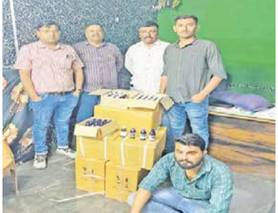
કોઈ જગ્યાએ જથ્થો રાખ્યો છે કે કેમ તે દિશામાં તપાસની કાર્યવાહી હાથ ધરવામાં આવી રહ્યું છે.

ભાવનગર | ભાવનગરમાં ફરી સિરપકાંડ બહાર આવ્યું છે. શહેરના માલધારી સોસાયટી વિસ્તારમાં આઈ મેડીકલ એજન્સી ચલાવતા શાપ્સ ડોક્ટરના પ્રિસ્ક્રિપ્શન વિના નશાના હેતુથી કફ સિરપ વેચતો હોવાની ચોક્કસ હકીકતના આધારે સ્પેશિયલ ઓપરેશન ગુરુપની ડ્રગ્સ ઈન્સ્પેક્ટરની સંયુક્ત ટીમે તલાશી લેતા કફ સિરપની પૉલ બોટલ મળી આવતા એજન્સીને સીલ મારી દેવામાં આવ્યા હતા.