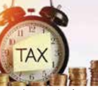
હતો. એડવાન્સ ટેક્સ અને એડવાન્સ ટેક્સ કલેક્શન શું છે? એડવાન્સ ટેક્સ સામાન્ય ટેક્સ જેવો છે, પરંતુ તે વર્ષના અંતે એકવાર જમા કરાવવાને બદલે હપ્તામાં જમા કરાવવો પડે છે. તેની ચૂકવણી માટેની ચૂ એટ આવકવેરા વિભા દ્વારા નક્કી કરવામાં આવે છે. આવકવેરા અધિનિયમની કલમ 208 મુજબ, જે વ્યક્તિ પર કોઈ એક નાણાકીય વર્ષમાં 10,000 રૂપિયાથી વધુની અંદાજિત ટેક્સ લાયબિલિટી હોય છે. તેણે એડવાન્સ ટેક્સ ભરવો પડશે. 60 વર્ષથી વધુ ઉંમરના લોકોને આમાંથી મુક્તિ આપવામાં આવી છે.

નવી દિલ્હી | આજે (15 માર્ચ) નાણાકીય વર્ષ 2023-24ના ચોથા ક્વાર્ટર માટે એડવાન્સ ટેક્સ ભરવાની છેલ્લી તારીખ છે. જો તેમને આજે જમા નહીં કરાયો તો તમારે પેનલ્ટી અને વ્યાજ ચૂકવવું પડી શકે છે. નાણાકીય વર્ષ 2024ના પ્રથમ ત્રણ હપ્તાના પ્રોવિઝનલ આંકડા મુજબ, 17 ડિસેમ્બર, 2023 સુધી સરકારે કુલ રૂ. 6,25,249 કરોડનો એડવાન્સ ટેક્સ વસૂલ કર્યો હતો. જે પાછલા નાણાકીય વર્ષના સમાન સમયગાળા એટલે કે 2022-23 કરતાં 19.94% વધુ હતો. લોકોએ FY2022-23ના ત્રણ હપ્તામાં રૂ. 5,21,302 કરોડનો એડવાન્સ ટેક્સ ભર્યો હતો. એકત્ર કરાયેલા કુલ એડવાન્સ ટેક્સમાંથી કોર્પોરેશન ટેક્સ (CIT) રૂ. 4,81,840 કરોડ અને પર્સનલ ઇન્કમ ટેક્સ (PIT) રૂ. 1,43,404 કરોડ