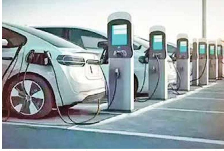
અને ઈ-બસને આ પ્રકારનું કોઈ પ્રોત્સાહન આપવામાં આવશે નહીં. વધતી જતી માંગને પહોંચી વળવા અને ઈવી ઉત્પાદકો પર ભોજ વધારવા માટે સરકારે ટૂ-વ્હીલર પર મહત્તમ

અમદાવાદ | દેશમાં ઇલેક્ટ્રિક ટૂ-વ્હીલર અને થ્રી-વ્હીલરને પ્રોત્સાહન આપવા માટે કેન્દ્ર સરકારે બુધવારે ઇલેક્ટ્રિક મોબિલિટી પ્રમોશન સ્કીમ 2024 રજૂ કરી છે. ભારે ઉદ્યોગ મંત્રી મહેન્દ્ર નાથ પટેલે કહ્યું કે કેન્દ્ર સરકારે નવી યોજના માટે ૫૦૦ કરોડ રૂપિયા ફાળવ્યા છે, જે એપ્રિલથી આગામી ૪ મહિના માટે લાગુ રહેશે. પારિએ કહ્યું કે, હાલની ફાસ્ટર એડોપ્શન અને મેન્યુફેક્ચરિંગ ઇલેક્ટ્રિક વ્હીકલ ફેઝ-૨ પહેલને બદલે આગામી સ્કીમ ૧ એપ્રિલથી અમલમાં આવશે. ફાળવેલ ૩, ૫૦૦ કરોડનો ઉપયોગ ૪ મહિનાના સમયગાળામાં લગભગ ૪ લાખ ટૂ-વ્હીલર અને થ્રી-વ્હીલરને આયક સપોર્ટ માટે કરવામાં આવશે. નવી યોજના હેઠળ સરકાર દ્વારા ઈ-ટૂ-વ્હીલર અને ઈ-થ્રી-વ્હીલર પર પ્રોત્સાહન આપવામાં આવી રહ્યું છે, પરંતુ નવી સ્કીમ હેઠળ ઈ-કાર વ્હીલર