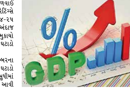
મુંબઈ | ભારતના અર્થતંત્રનો મજબૂત વિકાસ જળવાઈ રહેશે તેવી અપેક્ષા સાથે મૂડી'સ બાદ ફ્રી રેટિંગ્સે પણ આગામી નાણાં વર્ષ એટલે કે વર્ષ ૨૦૨૪-૨૫ માટે ભારતના આર્થિક વિકાસ દર ૭.૫૦ ટકા મુકાયો હતો. બીજા બાજુ ચીનના જીડીપી અંદાજમાં ઘટાડો કરાયો છે. આગામી નાણાં વર્ષના જુલાઈથી ડિસેમ્બરના ગાળામાં રિઝર્વ બેન્ક વ્યાજ દરમાં અડધા ટકાનો ઘટાડો કરશે તેવી પણ ધારણાં છે. ૨૦૨૪ના અંત સુધીમાં રિટેલ ફુગાવો તબક્કાવાર ઘટી ૪ ટકા પર આવી જવાની આશા છે. ચીનને બાદ કરતા ઊભરતી બજારો ખાસ કરીને ભારતનું ભાવિ ઉજળું હોવાનું ફ્રી દ્વારા તૈયાર કરાયેલા રિપોર્ટમાં જણાવાયું હતું. વર્તમાન નાણાં વર્ષમાં ભારતનો આર્થિક વિકાસ દર ૭.૮૦ ટકા તથા આગામી નાણાં વર્ષમાં ૭ ટકા રહેવા અપેક્ષા છે. બંને વર્ષના અંદાજમાં નોંધપાત્ર વધારો કરાયો છે. તેમજ ત્રણ ત્રિમાસિક ગાળામાં ભારતનો આર્થિક વિકાસ દર આઠ ટકાની ઉપર રહ્યો છે. દરમિયાન ૨૦૨૪માં ચીનનો આર્થિક વિકાસ દર ૪.૬૦ ટકાથી ઘટાડી ૪.૫૦ ટકા કરાયો છે. ચીનમાં પ્રોપર્ટી ક્ષેત્રના