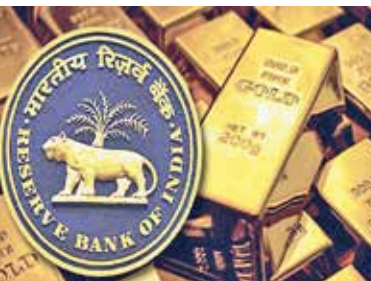
સોથી વધુ ખરીદી સેન્ટ્રલ બેંક ઓફ ટુર્કી દ્વારા કરવામાં આવી હતી. ટુર્કીની સેન્ટ્રલ બેંકે આ સમયગાળા દરમિયાન તેના સોનાના ભંડારમાં ૧૨ ટનનો વધારો કર્યો છે. જાન્યુઆરી ૨૦૨૪ ના અંત સુધીમાં, ટુર્કીનો સોનાનો ભંડાર વધીને ૫૫૨ ટન થયો હતો. ચીનની સેન્ટ્રલ બેંક પીપલ્સ બેંક ઓફ ચાઈના ૧૦ ટન સોનું ખરીદવા સાથે બીજા સ્થાને હતી. જાન્યુઆરી ૨૦૨૪માં આશરે ૯ ટન સોનાની ખરીદી સાથે ભારતની મધ્યસ્થ બેંક આરબીઆઈ ત્રીજા ક્રમે આવી હતી. ભારતનો ગોલ્ડ રિઝર્વ હવે વધીને ૮૧૨ ટન થઈ ગયો છે. ઓક્ટોબરના ૨૦૨૩ પછી પહેલીવાર ઈમ્પેના સોનાના ભંડારમાં કોઈ મહિનામાં વધારો થયો છે. ઉપરાંત, જુલાઈ ૨૦૨૨ પછી આરબીઆઈના સોનાના ભંડારમાં આ સૌથી મોટો વધારો છે.

નવી દિલ્હી | ભારતની રિઝર્વ બેંક ઓફ ઈન્ડિયાએ નવા વર્ષની શરૂઆતમાં ફરી એકવાર સોનાની જંગી ખરીદી કરી છે. નવા વર્ષના પ્રથમ મહિનામાં આરબીઆઈની ખરીદી વધીને ૨૦ મહિનામાં સર્વોચ્ચ સ્તરે પહોંચી ગઈ છે. જો કે ગત વર્ષના છેલ્લા બે મહિના દરમિયાન આરબીઆઈએ સોનું ખરીદવાનું ટાળ્યું હતું. સોનાના ભાવમાં વધારો કરવામાં કેન્દ્રીય બેંકની ખરીદીએ મુખ્ય ભૂમિકા ભજવી છે. સોનાના ભાવમાં હાલમાં રેકોર્ડ વધારો જોવા મળી રહ્યો છે. સ્થાનિક બજારમાં જ્યાં સોનું ૬૭,૦૦૦ના સ્તરને પાર કરી ગયું છે. જ્યારે આંતરરાષ્ટ્રીય ભાવ ૨,૨૦૦ ડોલરના રેકોર્ડ સ્તરે છે. વર્લ્ડ ગોલ્ડ કાઉન્સિલના નવીનતમ અહેવાલ મુજબ, જાન્યુઆરી ૨૦૨૪ દરમિયાન વિશ્વભરની કેન્દ્રીય બેંકો દ્વારા ૩૯ ટન સોનાની