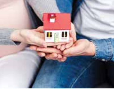
કિંમત ચૂકવવી પડશે. હોમ લોન વસૂલ કરવા માટે મ્યુચ્યુઅલ ફંડ એસઆઈપી દ્વારા કરી શકો છો. આ માટે હોમ લોનની ઈએમઆઈ શરૂ થતાં જ ટેન્ચોર માટે માસિક એસઆઈપી શરૂ કરવી જોઈએ. મુખ્ય રકમ અને વ્યાજ સહિત હોમ લોનની રકમ વસૂલવા માટે ઈએમઆઈની 20-25 ટકા રકમ સાથે એસઆઈપી શરૂ કરવી જોઈએ. આનાથી હોમ લોન પૂર્ણ થાય ત્યાં સુધી બેંકને જેટલી રકમ ચૂકવશો તેટલી રકમ સરળતાથી બનાવી શકશો.

મુંબઈ | આજના સમયમાં હોમ લોનની મદદથી પોતાનું ઘર ખરીદવું ખૂબ જ સરળ બની ગયું છે, પરંતુ હોમ લોનના ઈકેવેટ મંથલી ઈન્સ્ટોલમેન્ટ (EMI) દ્વારા લાંબા સમય સુધી ભારે વ્યાજ ચૂકવવું પડે છે. હોમ લોનનો સમયગાળો જેટલો લાંબો હશે, તેટલું વ્યાજ વધારે હોય છે. જેથી લોકો ઘર ખરીદવા માટે વધુ કિંમત ચૂકવે છે અને પછી પસ્તાઈ છે. પરંતુ સિસ્ટમેટિક ઈન્વેસ્ટમેન્ટ પ્લાન (SIP) દ્વારા હોમ લોનની સંપૂર્ણ કિંમત વસૂલ કરી શકો છો. તો જાણો આ માટે શું કરવું પડશે... એક બેંકમાંથી 25 વર્ષ માટે 30 લાખ રૂપિયાની લોન લીધી છે. આ બેંકમાં હોમ લોન પર વ્યાજ દર 9.55 ટકા છે. બેંક હોમ લોન કેલ્ક્યુલેટર અનુસાર 25 વર્ષમાં બેંકને 78,94,574 રૂપિયા ચૂકવવા પડશે. જો 20 વર્ષ માટે લોન લીધી છે, તો 67,34,871 રૂપિયા ચૂકવવા પડશે અને 15 વર્ષ માટે લોન લીધી છે, તો 9.55 ટકાના દરે 56,55,117 રૂપિયા ચૂકવવા પડશે. ટેન્ચોર જેટલો લાંબો હશે, તો ઈએમઆઈ ઘટી જાય છે. પરંતુ લોન માટે વધુ