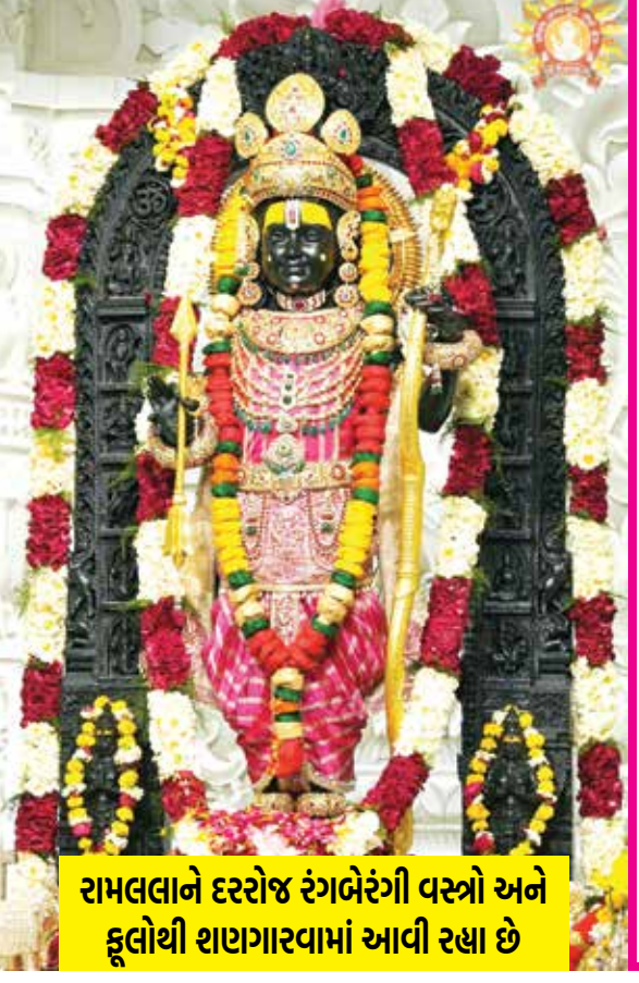
રામલલાને દરરોજ રંગબેરંગી વસ્ત્રો અને ફૂલોથી શાણાગરવામાં આવી રહ્યા છે

(એજન્સી) અયોધ્યા, તા. 24 ભગવાન કૃષ્ણના જન્મસ્થળ મથુરા અને વૃંદાવનની હોળી દેશ-દુનિયામાં પ્રખ્યાત છે. તેમાં ભાગ લેવા માટે લાખો ભક્તો મથુરા-વૃંદાવન પહોંચે છે. પરંતુ આ વર્ષે ભગવાન શ્રી રામના જન્મસ્થળ અયોધ્યામાં હોળીના તહેવારને લઈને પણ સ્થિતિ એવી જ છે. 22 જાન્યુઆરીના રોજ અયોધ્યાના નવનિર્મિત ભવ્ય રામ મંદિરમાં