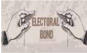
પાંચ વર્ષમાં લિસ્ટેડ કંપનીઓ દ્વારા રાજકીય ભંડોળ પેટે એકદરે રૂપિયા ૬૨૮ કરોડનો ખર્ચ

(એજન્સી) મુંબઈ : બીએસઈ સેન્સેક્સ ઘટકમાંની ૩૦માંથી માત્ર આઠ કંપનીઓએ છેલ્લા પાંચ વર્ષના તેમના વાર્ષિક રિપોર્ટમાંથી કોઈ એક વર્ષમાં ઈલેક્ટોરલ બોન્ડની ખરીદી અથવા રાજકીય પક્ષોને નાણાકીય ભંડોળ પૂરું પાડ્યું હોવાની માહિતી પૂરી પાડી છે. છેલ્લા પાંચ વર્ષમાં આ કંપનીઓએ રાજકીય ભંડોળ પેટે એકદરે રૂપિયા ૬૨૮ કરોડનો ખર્ચ કર્યો હોવાનું તેમના વાર્ષિક રિપોર્ટમાં જણાય છે. પ્રાપ્ત આંકડા પર નજર નાખીએ તો એક જાણીતી ટેલિકોમ કંપનીએ ૨૪૧ કરોડ સાથે સૌથી વધુ ભંડોળ આપ્યું છે જ્યારે રૂપિયા ૧૭૫ કરોડ સાથે એક સ્ટીલ કંપનીનો સમાવેશ થાય છે. આઠમાંથી કોઈ કંપનીએ એક વખત તો કોઈકે પાંચે વર્ષમાં ઈલેક્ટોરલ બોન્ડની ખરીદી કરી છે. એક રિસર્ચ પેઢીના રિપોર્ટ પ્રમાણે એક કંપનીએ પાંચ વખત જ્યારે પાંચ કંપનીઓએ માત્ર એક વર્ષ જ ભંડોળ પૂરું પાડ્યું છે જ્યારે અન્ય બે કંપનીઓએ બે વર્ષ