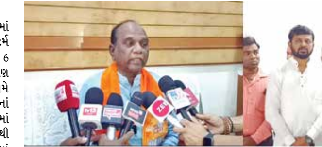
ભરૂચ લોકસભા મતવિસ્તારમાં ભાજપ નાં સિનિયર સાંસદ 7 મીટી થી ચૂંટણી લડી રહ્યા છે. અને 6 લાખની લીડ થી જીતવાનો દાવો પણ કરી ચૂક્યા છે. જ્યારે તેમની સામે ઈન્ડિયા ગઠબંધન માં આપનાં ધારાસભ્ય ચૈતર વસાવા ને મેદાનમાં ઉતાર્યા છે. ત્યારે બંને વચ્ચે પહેલાથી ચાલતો ગજગ્રાહ હવે રાજકારણ માં ચૂંટણી ટાણે ચરમસીમા એ પહોંચ્યો છે. સોશિયલ મીડિયા માં સાંસદ મનસુખ વસાવાએ મૂકેલી પોસ્ટ માં આપ ના નેતાઓ ઉપરાણી કરતા હોવાની છે સાથે રેડીયાપાડા અને સાગબારા માં હોળી ના બહાને અધિકારીઓ અને કોન્સ્ટ્રક્ટરો ને ડરાવી ધમકાવીને આપ ના નેતાઓ ઉપરાણી કરે છે.તેવો સીધો આક્ષેપ કરતા આપ ના નેતા ઇછેડાયા છે. જેના જવાબ માં ધારાસભ્ય ચૈતર વસાવા એ કહ્યું અમે બે મહિનાથી નર્મદા માં ગયા નથી.

અમે કોઈ ઉપરાણી કરી નથી અને ડ્રિપિયા માંગ્યા નથી ઉલટાની ભાજપ વાળા કમલમ બનાવવા અધિકારીઓ અને કોન્સ્ટ્રક્ટરો પાસે ડ્રિપિયા માંગે છે તેના પુરાવા છે. જાતે મનસુખભાઈ તેમના નિવેદનોમાં બોલ્યા છે. મનસુખભાઈની વાત બિલકુલ ખોટી છે. સાંસદ મનસુખ વસાવા એ જવાબમાં કહ્યું, મારી પાસે પૂરાવા આવ્યા ત્યારેજ મે વાત કરી આપ નાં લોકો અધિકારીને ખખડાવી ડ્રિપિયાની માંગણી કરી રહ્યા છે. અમારાં ભાજપ કાર્યાલય ની વાત કરી છે ત્યારે એ પાર્ટી ફંડ આપે છે, અને થોડી ઘણી જરૂર પડે તો અમે દાન લીધું હોય જેની રસીદ પણ આપી છે. કોઈ પણ અધિકારી કે કોન્સ્ટ્રક્ટર ને ધમકાવી ડ્રિપિયાની માંગણી કર્યા નથી કરી તેમ મનસુખ વસાવા એ કહ્યું હતું. આમ બીજાની અને આપ વચ્ચે આક્ષેપ પ્રતિઆક્ષેપો વચ્ચે રાજકારણ ગરમાયું છે.