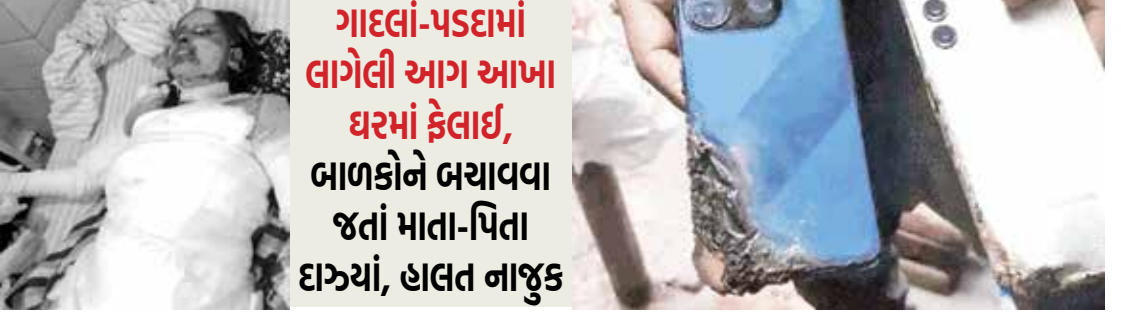
ગાદલાં-પડદામાં લાગેલી આગ આખા ઘરમાં ફેલાઈ, બાળકોને બચાવવા જતાં માતા-પિતા દાગ્યાં, હાલત નાજુક

(એજન્સી) મેરઠ, તા. 24 મેરઠમાં મોટી રાત્રે મોબાઈલ બ્લાસ્ટના કારણે એક ઘરમાં આગ લાગી હતી. અકસ્માતમાં 6 લોકો ગંભીર રીતે દાગી ગયા હતા. હોસ્પિટલમાં સારવાર દરમિયાન 4 બાળકોનો મોત થયાં હતાં. દરમિયાન તેમનાં માતા-પિતાની હાલત નાજુક છે. આ ઘટના પલ્લવપુરમ પોલીસ સ્ટેશન વિસ્તારની જન્તા કોલોનીમાં બની હતી. ચાર્જરમાં શોર્ટ સર્કિટ થતાં મોબાઈલમાં વિસ્ફોટ થયો હતો. વિસ્ફોટ એટલો જોરદાર હતો કે ગાદલાં અને પડદામાં આગ લાગી જે આખા ઘરમાં ફેલાઈ ગઈ હતી. થોડી જ વારમાં આગ આખા ઘરમાં ફેલાઈ ગઈ અને ચારેય બાળકો તેમાં ફસાઈ ગયાં. સંતાનોને બચાવવાના પ્રયાસમાં માતા-પિતા પણ દાગી ગયાં હતાં. આગની જ્વાળાઓમાં કોઈને બહાર આવવાની તક મળી ન હતી.