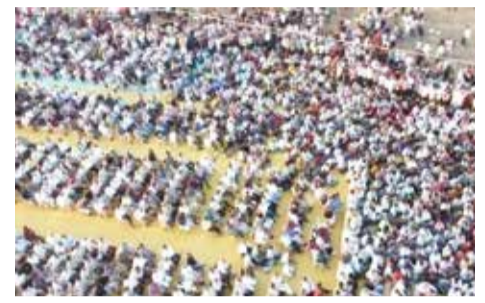
જાલાએ આ વિરોધને યોગ્ય ગણાવ્યો છે. તેમને કહ્યું કે, આવા નિવેદનો કોઈપણ સંજોગોમાં ના ચલાવી લેવાય. મતદાન સુધી આ લડત ચાલુ રાખવા હુકાર કર્યો છે.

કેન્દ્રીયમંત્રી પરશોત્તમ રૂપાલા વિરુદ્ધ ક્ષત્રિય સમાજનો વિરોધ હાલ પણ યથાવત છે. આજે અમદાવાદના ધંધુકા ખાતે સાંજે ક્ષત્રિય સમાજનું અસ્મિતા સંમેલન યોજાયું હતું, જેમાં મોટી સંખ્યામાં સમાજના અગ્રણીઓ અને લોકો ઉપસ્થિત રહ્યા હતા. સમાજના આગેવાનોનું કહેવું છે કે અગામી સમયમાં નિર્ણય નહીં આવે તો રાજ્યકક્ષાએ આંદોલન કરવામાં આવશે. ક્ષત્રિય સમાજની એક જ માંગ છે કે રૂપાલાની ટિકિટ રદ થાય. અગાઉ સંમેલનને લઈ ગોતા ખાતે આવેલા રાજપૂત ભવનમાં ક્ષત્રિય આગેવાનો તેમજ પોલીસની બેઠક યોજાઈ હતી.