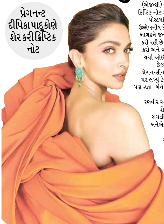
પ્રેગનન્સી દીપિકા પાદુકોણે શેર કરી ક્રિસ્ટિક નોટ