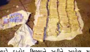
ત્યારે દાહોદ જિલ્લાને ઝીડીને આવેલ મધ્ય પ્રદેશની પીટોલ બોર્ડર ખાતે વાહન ચેકિંગ દરમિયાન એક બસમાંથી એક કરોડ ઉપરાંતની રોકડ રકમ તેમજ ચાંદી કબજે કરવામાં આવ્યું છે. જ્યારે મધ્ય પ્રદેશના ઝાબુવા જિલ્લાના પીટોલ બોર્ડર પરથી રાત્રે એસએસટી તેમજ એકએસટીની ટીમોએ સ્થાનિક પોલીસની સાથે મળી ઉજ્જૈન પાસિંગની રાહુલ ટ્રાવેલ્સની બસની તપાસ કરતા

ચૂંટણી સમયે દેશભરમાં ચેકિંગ સહન બનાવવામાં આવ્યું છે. ત્યાં મધ્ય પ્રદેશ અને ગુજરાત બોર્ડર પાસે આવેલી પીટોલ બોર્ડર પરથી 1 કરોડથી વધુની કેશ ઝડપાઈ છે. જેમાં એક કરોડથી વધુ રોકડ અને ચાંદીનો જથ્થો ઝડપાયો છે. જેને લઈ મધ્ય પ્રદેશ પોલીસએ કાયદેસરની કાર્યવાહી કરી છે. લોકસભા ચૂંટણીને લઈ પોલીસ અને એસઆઈટી દ્વારા મુદ્દામાલ ઝડપી વધુ તપાસ હાથ ધરી છે. મધ્યપ્રદેશ નજીક પીટોલ બોર્ડર ઉપરથી ઈન્ડોરથી આવતી પાનગી ટ્રાવેલ્સમાંથી બિનવારસી હાલતમાં રોકડ રકમ અને ચાંદી મળી આવી છે. જેમાં પોલીસ દ્વારા હાલમાં ચૂંટણીને ધ્યાનમાં રાખીને સરહદી વિસ્તારોમાં વાહનોનું સહન ચેકિંગ અભિયાન ચલાવવામાં આવી રહ્યું છે.