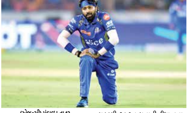
(એજન્સી) મુંબઈ | તા 13

આઈપીએલ 2024ની વચ્ચે મુંબઈ ઈન્ડિયન્સનો કેપ્ટન હાર્દિક પંડ્યાને લઈને માઠા સમાચાર સામે આવી રહ્યા છે. પંડ્યા ફરી એકવાર ઈજાગ્રસ્ત થયા છે. તે વનડે વિશ્વકપ સમયે પણ ઈજાગ્રસ્ત રહ્યો હતો પણ લાંબા સમય બાદ આઈપીએલમાં વાપસી માટે સફળ રહ્યા છે. હવે આઈપીએલની સાથે પંડ્યાએ ફરીથી ઈજાગ્રસ્ત થવાનો દાવો કર્યો છે. હાર્દિક સાથે જ ઈજાગ્રસ્ત છે તે તેની અસર મુંબઈ ઈન્ડિયન્સની સાથે સાથે ટીમ ઈન્ડિયાની મુશ્કેલીઓ પણ વધારી શકે છે. ટીમ ઈન્ડિયા માટે પણ ખરાબ સમાચાર આવનારા મહિનાની પહેલા અઠવાડિયામાં આઈસીસી ટી20 વિશ્વકપ 2024ને માટે બીસીસીઆઈ ભારતીય ટીમ માટે સ્વોડનની જાહેરાત કરી શકે છે. એવામાં જો પંડ્યા ઈજાગ્રસ્ત છે તો ટીમ ઈન્ડિયામાંથી તેમનું નામ બાકાત થઈ શકે છે. આ સાથે જ ભારતીય ટીમને પણ મોટો ઝટકો લાગી શકે છે. પંડ્યા સારી બેટિંગ માટે જાણીતા છે. આરસીબીની સામે તેઓએ 6 બોલમાં 3 સિક્સનની