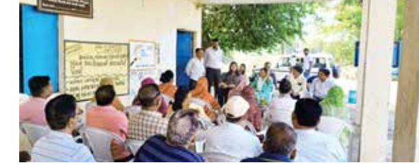
જોડે લઈ ને આવે અને યુનાવ મતદારો પણ ઉત્સાહ સાથે જોડાય. તેમણે નાગરિકોને અચૂક મતદાન કરી લોકશાહીના આ પર્વને ગર્વભરે ઉજવવા અપીલ કરી હતી તથા BLO, સ્થાનિક આગેવાનો, આશા વર્કરો, તલાટી કમ મંત્રી, મમયો સંચાલકોએ ડોર ડોર મતદાર જાગૃતિ માટે પ્રચાર/પ્રસાર કરવા અંગે સમજૂતી કર્યાં. આ સાથે

જિલ્લા ચૂંટણી અધિકારી શ્રીમતી નેહા કુમારીના અધક્ષતામાં ૧૨૩-વિધાનસભા મતદાન વિભાગના મતદાન મથક નંબર-૭૦ દીવડા-૨ માં ગત લોકસભા ચૂંટણીમાં ૫૦%થી ઓછું મતદાન થયેલ હોવાથી ગ્રામ પંચાયત દિવડા ખાતે 'મતદાર જાગૃતિ અભિયાન' કાર્યક્રમ અંતર્ગત યુનાવ પાઠશાળા નું આયોજન કરવામાં આવ્યું. આ પ્રસંગે જિલ્લા ચૂંટણી અધિકારી શ્રીમતી નેહા કુમારી એ જણાવ્યું હતું કે, વધુને વધુ લોકો આ અવસરમાં જોડાઈને પોતે તો મત કરે પણ આજુ બાજુના લોકોને પણ મતદાનના દિવસે મતદાન કરવા