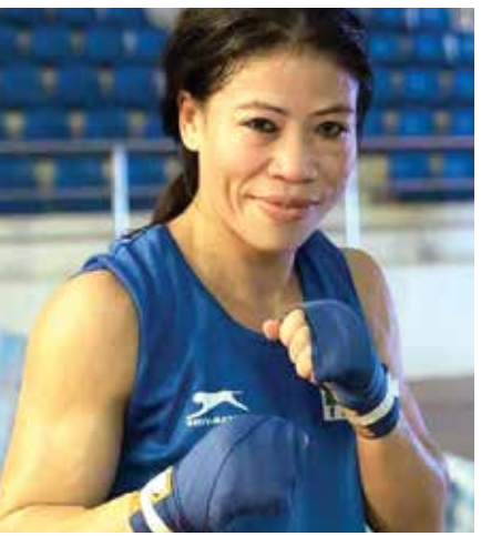
(એજન્સી) નવી દિલ્હી | તા 13

બોક્સિંગ વિજેન્સ મેરી કોમે અંગત કારણોને ટાંકીને આગામી પેરિસ ઓલિમ્પિક 2024 માટે ભારતના શેફ-ડી-મિશન તરીકે રાજીનામું આપ્યું છે. ભારતીય ઓલિમ્પિક સંઘ (IOA)ના પ્રમુખ પીટી ઉપાએ શુક્રવારે આની જાહેરાત કરી હતી. પીટી ઉપાને લખેલા પત્રમાં કોમે કહ્યું હતું કે, હું મારા દેશની દરેક સંભવ રીતે સેવા કરવાને સન્માન માનું છું અને તેના માટે હું માનસિક રીતે તૈયાર હતું. જો કે, મને અફસોસ છે કે હું જવાબદારી નિભાવી શકીશ નહીં અને અંગત કારણોસર રાજીનામું આપવા માગુ છું. પીટી ઉપાએ કહ્યું કે, અમને એ વાતનું દુ:ખ છે કે ઓલિમ્પિક મેડલ વિજેતા બોક્સર અને IOA એથેટ કમિશનના પ્રમુખ મેરી કોમે