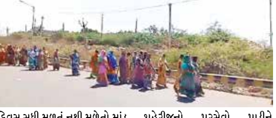
દિવસ સુધી મળતું નથી મળેતો માંડ અશ્વે કલાક આપે તે પણ સાવ ધીમું આવે છે. ચૂંટણી નજીક છે. ત્યારે પણ લોકોની હાલત કફોડી છે. છતાં નેતાઓ પણ આ વિસ્તારમાં લોકોની સમસ્યાઓ ઉકેલવા માટે ડોકતા નથી આથી રોષે ભરાયેલી આ વિસ્તારની ૧૦૦ જેટલી મહિલાઓ એ રેલી કાઢી હતી અને પાલિકા તથા મામલતદાર કચેરીએ આવેદનપત્ર આપવામાં આવ્યું અને સામાકાંઠા ની સમસ્યાઓ વિશે જણાવ્યું કે પીપળીકાંઠા વિસ્તારમાં ઠેકઠેકાણે ગંદકી દુર કરવા તથા સફાઈ વેરો વર્ષોથી સામાકાંઠા ની જનતા ભરી રહી હોવા છતાં સાફસફાઈ કરવામાં આવતી ન હોવા છતાં પણ પાલિકા વેરો વસુલાત કરવામાં આવી રહ્યો છે. સફાઈ માટે કામદારો મુકવા આવે તથા

જાફરાબાદના સામાકાંઠે આવેલ પીપળીકાંઠા વિસ્તારમાં અનેક સમસ્યાઓ વિકટ જેવીકે પીવાનાપાણીની સમસ્યા દિન-પ્રતિદિન વધતી જતી હોય આ સમસ્યાનો અંત લાવવા માટે મહિલાઓ દ્વારા મામલતદાર સાહેબ ને આવેદનપત્ર આપવામાં આવ્યું પીપળીકાંઠા ના સામાકાંઠા વિસ્તારમાં અનેક બાબતની સમસ્યાઓનો સામનો કરતી આમજનતા જાફરાબાદના સામાકાંઠા વિસ્તારમાંથી આક્રોશ સાથે ૧૦૦ મહિલાઓ દ્વારા આવેદનપત્ર આપ્યું. સમસ્યા ન ઉકેલાયતો આંદોલન જાફરાબાદના પીપળીકાંઠા વિસ્તારમાં મોટાભાગે ખારવા સમાજની વસ્તી છે. અને મોટા ભાગના લોકો અહીં માછીમારીનું વ્યવસાય કરે છે. એક તરફ અરબી સમુદ્ર ના પાણીનો અખાષ પ્રવાહ ધુવધે છે. પરંતુ દરિયાનાં કાંઠે જ લોકો ને પીવાના પાણી માટે વલખાં મારી રહ્યા હોય તેવી પરિસ્થિતિ નિર્માણ થયું છે. આ વિસ્તારમાં છેલ્લા કેટલાક સમયથી લોકોને જીવનજરૂરીયાત પછી ૧૫થી૨૦