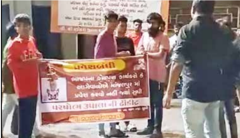
આ તો માત્ર ટ્રેલર છે, હજુ પિક્ચર બાકી છે

લોકસભાની ચૂંટણી માથે છે અને હાલમાં ફોર્મ ભરવાની પ્રક્રિયા ચાલી રહી છે. ત્યારે ભ્રષ્ટ્ર સમાજ પર રાજકોટના ઉમેદવાર પુરુષોત્તમ રૂપાલાએ કરેલી ટિપ્પણીને લઈ હજુ વિવાદ શમ્યો નથી. વડોદરા જિલ્લાના ગ્રામ્ય વિસ્તાર બાદ હવે શહેરના માંજલપુર વિસ્તારમાં મોડીરાતે 'ભાજપના કોઈપણ કાર્યકર અને આગેવાને પ્રવેશવું નહીં, જ્યાં સુધી પુરુષોત્તમ રૂપાલાની ટિકિટ રદ ન થાય ત્યાં સુધી' એવાં બેનરો લાગતાં પોલીસ ઘોડતી થઈ હતી. આ બાબતે આગેવાને પોલીસને ભાજપની ગુલામ કહી હતી. આગામી લોકસભાની ચૂંટણીમાં પુરુષોત્તમ રૂપાલાના ભ્રષ્ટ્ર સમાજ વિરુદ્ધ કરવામાં આવેલા નિવેદનને ધ્યાનમાં રાખીને શહેરના માંજલપુરમાં ભાજપના કાર્યકરો, ઉમેદવારોને પ્રવેશબંધી કરતાં બેનરો રાતોરાત લગાવી દેતાં શહેરમાં પણ વિરોધ શરૂ થયો છે. હાલમાં શહેરમાં લોકસભાની ચૂંટણીને લઈને તમામ રાજકીય પક્ષોએ પોતાના ઉમેદવારોના ચૂંટણીપ્રચાર શરૂ કરી દીધા છે, જેમાં ઘરે ઘરે ફેરણી, વિસ્તારોમાં રેલીઓ યોજવામાં આવી રહી છે, પરંતુ બીજી તરફ પુરુષોત્તમ રૂપાલાના ભ્રષ્ટ્ર સમાજ વિરુદ્ધ કથિત નિવેદનને પગલે જ્યાં એક તરફ સમગ્ર રાજ્યમાં રૂપાલાનો વિરોધ કરવામાં આવી રહ્યો છે, સાથે જ રૂપાલાની ઉમેદવારી રદ કરવા માંગ ઊભી છે. ત્યારે શહેરના માંજલપુરમાં પણ હવે રાજપૂત કરણસિંહના તથા ભ્રષ્ટ્ર સમાજ દ્વારા રાત્રે બેનર લગાવી વિરોધ નોંધાવ્યો છે. બેનરમાં લખ્યું છે કે ભાજપના કોઈપણ કાર્યકર કે આગેવાને પ્રવેશવું નહીં, જ્યાં સુધી ટિકિટ રદ ન થાય ત્યાં સુધી. આ અંગે ભ્રષ્ટ્ર આગેવાન રવિરાજસિંહ સોલંકીએ જણાવ્યું હતું કે ભ્રષ્ટ્ર સમાજ વિરુદ્ધ, હિન્દુસ્તાન માટે પોતાના સમાજની વાત આવે તો મરતા કે મારતા અચકારો નહીં. ભાજપની સરકાર સમાજને દબાવવા માંગે છે.