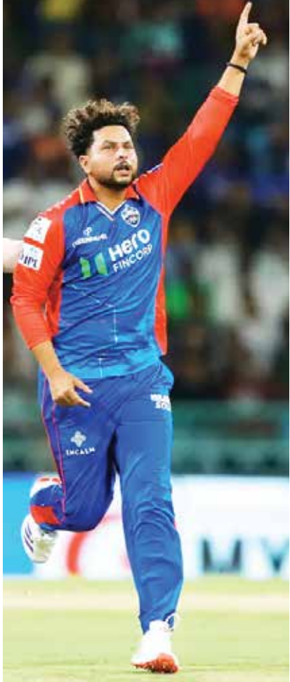
(એજન્સી) નવી દિલ્હી | તા 13

દિલ્હી કેપિટલ્સ (DC) એ ઈન્ડિયન પ્રીમિયર લીગ (IPL)માં લખનઉ સુપર જાયન્ટ્સ (LSG) સામે તેમની પ્રથમ જીત હાંસલ કરી છે. ટીમે વર્તમાન સિઝનની 26મી મેચમાં સુપરજાયન્ટ્સને 6 વિકેટથી હરાવ્યું હતું. સતત બે હાર બાદ દિલ્હીની આ પ્રથમ જીત છે, જ્યારે લખનઉ સતત ત્રણ જીત બાદ હાર્યું છે. શુક્રવારે લખનઉમાં દિલ્હીએ 168 રનનો ટાર્ગેટ 18.1 ઓવરમાં 4 વિકેટ ગુમાવીને મેચ જીતી. અગાઉ લખનઉએ પોતાના હોમ ગ્રાઉન્ડ એકાના સ્ટેડિયમમાં ટોસ જીતીને બેટિંગ કરી હતી અને 20 ઓવરમાં 7 વિકેટે 167 રન બનાવ્યા