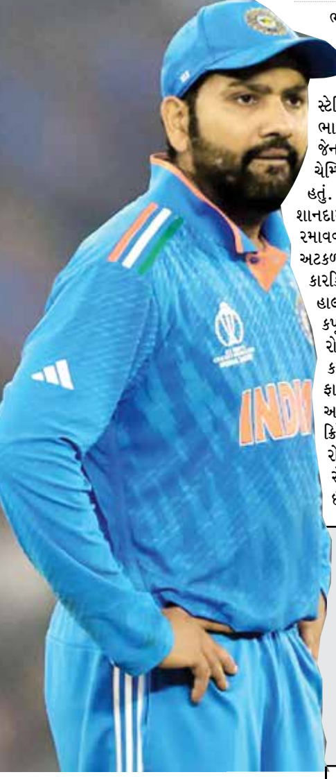
(એજન્સી) મુંબઈ | તા 13

ભારતીય ટીમ 2023 વર્લ્ડ કપમાં ફાઇનલમાં ભારતે ફાઇનલ સુધીનો પ્રવાસ ખેંચ્યો હતો. અમદાવાદના નરેન્દ્ર મોદી સ્ટેડિયમમાં રમાયેલી વર્લ્ડ કપ ફાઇનલમાં ભારતનો ઓસ્ટ્રેલિયા સામે પરાજય થયો હતો, જેના કારણે ભારતીય ટીમનું ત્રીજા વખત વર્લ્ડ ચેમ્પિયન બનવાનું સપનું યકબાચૂર થઈ ગયું હતું. આ આખી ટુર્નામેન્ટમાં રોહિતની કેપ્ટનશિપ શાનદાર હતી. હવે જૂનમાં T20 વર્લ્ડ કપ રમવાનો છે. સોશિયલ મીડિયા પર હવે એવી અટકળો ચાલી રહી છે કે T20 વર્લ્ડ કપ રોહિતની કારકિર્દીની છેલ્લી મોટી ટુર્નામેન્ટ હશે. પરંતુ હાલમાં જ બ્રેકફાસ્ટ વિષય ચેમ્પિયન ગોરવ કપૂરને આપેલા ઈન્ટરવ્યૂમાં ભારતીય કેપ્ટન રોહિતે શર્માએ પોતાના ભવિષ્ય વિશે વાત કરી હતી. હું વર્લ્ડ કપ રમવા ઈચ્છું છું, WTC ફાઇનલ પણ રમવા માગુ છું રોહિતે સંકેત આપ્યો છે કે તે હજુ 3 થી 4 વર્ષ આંતરરાષ્ટ્રીય ક્રિકેટ રમવા માગે છે. આનો અર્થ એ થયો કે શું રોહિતે 2027નો વર્લ્ડ કપ રમવા માગે છે. રોહિતે આ અંગે પ્રતિક્રિયા આપી છે અને ઈન્ટરવ્યૂ દરમિયાન કહ્યું છે કે, 'મેં હજુ સુધી