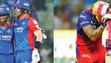
બેંગલોર | તા 13