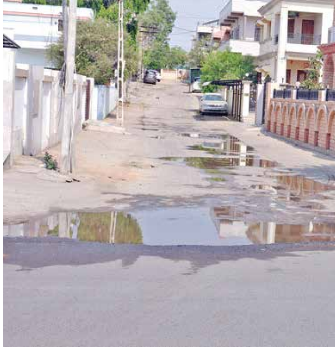
પાણીનો વેડફાટ જોવા મળે તો ફોટોગ્રાફી સાથે રિપોર્ટ કરવા વોર્ડમેન-વાલ્વમેનોને સુચના આપતો પરિપત્ર

ભુજ શહેરની સોસાયટી કોલોની વિસ્તારમાં પાણીનો વેડફાટ કર્યો તો ખેર નથી. જો આવું પાલિકાની નજરે પડશે તો પાણીના કનેક્શન જ કાપી નખાશે. આજે ભુજ નગરપાલિકાએ ખાસ પરિપત્ર બહાર પાડીને વોર્ડમેન-વાલ્વમેનોને સુચના આપી છે કે જો પાણી વેડફાટ કોઈ કરે તો ફોટોગ્રાફી સાથે પાલિકાને જાણ કરે. ભુજમાં સર્જાયેલા જળ સંકટ બાદ પાણી વિતરણ બાદ હવે પાણી વેડફાટની ફરિયાદો સામે આવી રહી છે. ત્યારે, આજરોજ ભુજ નગરપાલિકાના ચીફ ઓફિસરે પરિપત્ર બહાર પાડીને પાણીનો વેડફાટ કરનારના કનેક્શન જ કાપી દેવાની ચિમકી આપી છે. પરિપત્રમાં વાલ્વ મેન અને વોર્ડમેનોને સુચના આપવામાં આવી છે કે, ભુજ શહેરના જુદા જુદા વિસ્તારોમાં ઘરોના ખાનગી ટાંકાના વાલ્વ લિંક હોવાથી પાણીનો દુરુપયોગ થાય છે. રોડ પર પાણીનો વેડફાટ જોવા મળે છે. શેરીઓમાં પાણી વહી રહ્યા છે. ત્યારે, દરેક વોર્ડ મેન અને વાલ્વ મેનોને જો શેરી કે ઘરની બહાર પાણીનો વેડફાટ દેખાય તો ફોટોગ્રાફી સાથે રિપોર્ટ કરે. ત્યારબાદ પાણીનો વેડફાટ કરનારના પાણીના કનેક્શન જ કાપી દેવાશે.