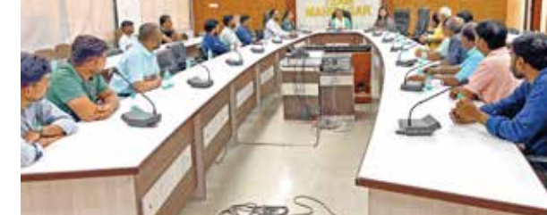
આવશ્યક છે જે અનુસાર જુદા જુદા વ્યવસાયકારોને તેમની વ્યવસાયના સ્થળે સેલ્ફી પોર્ટન્ટ, બેનર, સ્ટીકર તથા સ્ટેમ્પિંગ સ્વોગન લગાવવા તથા પત્રિકાઓ પ્રદર્શિત કરવા અને મતદાનના દિવસે મત આપીને આવેલા મતદારોને ખાસ ડીસ્કાઉન્ટ તેમજ તેમનું સન્માન કરવા જેવા કાર્યક્રમો આયોજીત કરવા ચર્ચા

લોકસભા સામાન્ય ચૂંટણી-૨૦૨૪ નું મતદાન તા.૦૭/૦૫/૨૦૨૪ના રોજ યોજાનાર છે જે અંતર્ગત જિલ્લા ચૂંટણી અધિકારીશ્રી ધ્વારા વિવિધ માધ્યમો ધ્વારા મતદાનની ટકાવારી વધે તે હેતુસર ઘણા કાર્યક્રમો તથા નવતર પ્રયોગો કરવામાં આવી રહેલ છે જે અંતર્ગત આજરોજ લુણાવાડાના વિવિધ વ્યવસાયો સાથે જોડાયેલ વેપારીઓ, મેડીકલ સ્ટોરના માલિકો તથા મોલ અને હોટેલના સંચાલકો સાથે બેઠકનુ આયોજન કરવામાં આવ્યું. મતદાર જાગૃતિ કાર્યક્રમમાં તમામ સંસ્થાઓની સહભાગીતા