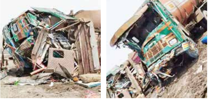
(એજન્સી) સુરેન્દ્રનગર | તા.13

ખારાઘોડા રણમાં ધૂળની ડમરીઓ વચ્ચે બે ટ્રક સામસામે અથડાતા એક વ્યક્તિનું મોત થયું હતું. જ્યારે એક યુવાન ગંભીર રીતે ઈજાગ્રસ્ત થયો હતો. અકસ્માતમાં ઈજાગ્રસ્તોને પ્રાથમિક સારવાર અર્થે પાટડી સરકારી હોસ્પિટલે લઈ જવાયા બાદ વધુ સારવાર અર્થે અમદાવાદ હોસ્પિટલે લઈ જવાતાં એક યુવાનનું સારવાર દરમિયાન મોત નીપજ્યું હતું. અકસ્માત એટલી હદે ગોઝારો હતો કે, રણમાં ટ્રકમાંથી ઈજાગ્રસ્તોને બહાર કાઢવા કેને બોલાવવી પડી હતી.