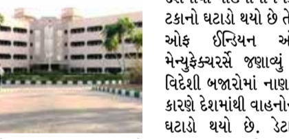
પ્રોગ્રામની રચના કરવામાં આવી છે. ઈએમએસઆઈટી પ્રોગ્રામની વિશિષ્ટ વિશેષતાઓમાંની એક તેનું એકીકરણ અને ઉદ્યોગના સુક્ષ્મ ઓળખપત્રોની માન્યતા છે. આ અનોખો અભિગમ વિદ્યાર્થીઓને તેમના શૈક્ષણિક ધ્યેયો હાંસલ કરવા માટે લવચીક માર્ગો પૂરા પાડીને તેમના આગાહના શિક્ષણ અને વ્યાવસાયિક અનુભવોનો લાભ લેવા માટે પરવાનગી આપે છે. ઉદ્યોગના ધોરણો સાથે સંરેખિત કરીને, પ્રોગ્રામ એ સુનિશ્ચિત કરે છે કે વિદ્યાર્થીઓ આજના ગતિશીલ IT લેન્ડસ્કેપ દ્વારા માંગવામાં આવતી કુશળતા અને જ્ઞાનથી સજ્જ છે. ઈએમએસઆઈટી પ્રોગ્રામનો અભ્યાસક્રમ હેન્ડ-ઓન પ્રોજેક્ટ્સ અને રીઅલ-વર્લ્ડ એલિમેન્ટ્સ પર ધ્યાન કેન્દ્રિત કરીને વ્યાપક અને વ્યવહારુ બનાવવા માટે રચાયેલ છે.

(એજન્સી) મુંબઈ | તા.14 ઈન્ટરનેશનલ ઈન્સ્ટિટ્યુટ ઓફ ઈન્ફોર્મેશન ટેકનોલોજી હૈદરાબાદ (IIITH) એ તાજેતરમાં Coursera પર ઓનલાઇન માસ્ટર ઓફ સાયન્સ ઈન ઈન્ફોર્મેશન ટેકનોલોજી (eMSIT) લોન્ચ કરવાની જાહેરાત કરી છે, જે ઓનલાઇન શિક્ષણના ક્ષેત્રમાં એક મહત્વપૂર્ણ સીમાચિહ્નરૂપ છે. આ પહેલનો ઉદ્દેશ્ય ઈન્ફોર્મેશન ટેકનોલોજી (IT)ના ક્ષેત્રમાં ઉચ્ચ ગુણવત્તાવાળા શિક્ષણની એક્સેસને લોકશાહી બનાવવાનો અને સમગ્ર ભારતમાં અને તેનાથી બહારના વિદ્યાર્થીઓને સશક્ત કરવાનો છે. eMSIT પ્રોગ્રામ તેના પ્રકારનો પહેલો કાર્યક્રમ છે, જે વૈશ્વિક સ્તરે માન્યતા પ્રાપ્ત ઓનલાઇન લર્નિંગ પ્લેટફોર્મ Coursera પર ભારતીય યુનિવર્સિટી દ્વારા ઓફર કરવામાં આવે છે. તે IIIT હૈદરાબાદના સંશોધન-આગળિત શિક્ષણના વારસા અને નવીન શિક્ષણના અનુભવો પહોંચાડવા માટેની તેની પ્રતિબદ્ધતા પર નિમોણ કરે છે. આઈટી અને કોમ્પ્યુટર સાયન્સમાં તેમની કારકિર્દીને આગળ વધારવા માંગતા શીખનારાઓની જરૂરિયાતોને પૂરી કરવા માટે આ