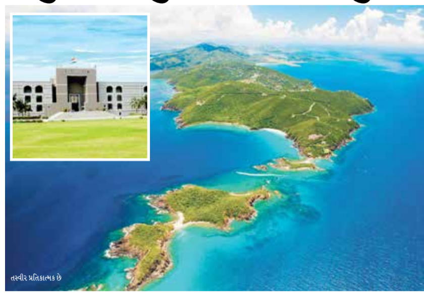
તસ્વીર પ્રતિકાશ્ચક છે

(એજન્સી) અમદાવાદ 1 તા.16 ગુજરાતથી 9 લોકો કેરેબિયન ટાપુઓ થઈને ગેરકાયદેસર રીતે અમેરિકા જઈ રહ્યા હતા. કેરેબિયન ટાપુ પરથી આ નવ લોકો ગાયબ થઈ ગયા છે. જેને લઈને હાઈકોર્ટમાં જાહેરહિતની અરજી દાખલ કરવામાં આવી હતી. આજે આ મુદ્દે ચીફ જજ સુનિતા અગરવાલ અને જ આનિરુદ્ધ માધીની બેન્ચ સમક્ષ સુનાવણી હતી. જો કે, હાઈકોર્ટે આ બાબતે જુદાઈ મહિનાના પહેલા અડવાડિયામાં મુદત રાખી છે. જ્યારે અરજદારના વકીલની માગ જૂન મહિનામાં ચૂંટણી પછી મુદત રાખવા માટે હતી.