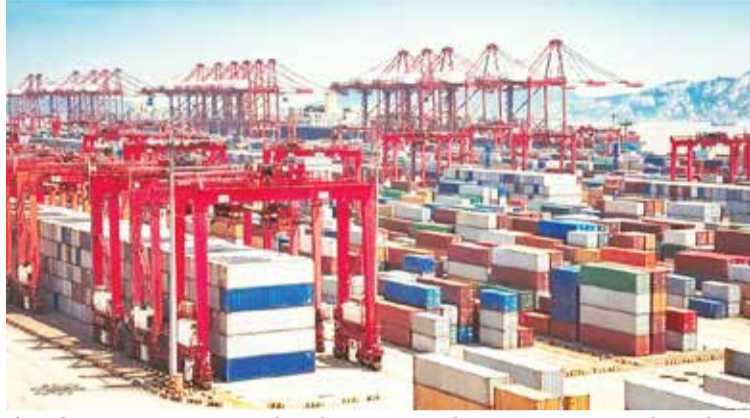
નોટિફિકેશન બહાર પાડ્યું હતું. નોટિફિકેશન મુજબ, ટાપુ રાષ્ટ્રમાં આવશ્યક ચીજવસ્તુઓની નિકાસ માત્ર ચાર નિયુક્ત કસ્ટમ સ્ટેશનો દ્વારા જ મંજૂરી આપવામાં આવશે: મુન્દ્રા સી પોર્ટ, તુતીકોરિન સી પોર્ટ, ન્હાવા શેવા સી પોર્ટ અને ICD તુગલકાબાદ. આ પગલું માલદીવ સરકારની વિનંતી પર, નાણાકીય વર્ષ 2024-25 માટે આવશ્યક ચીજવસ્તુઓની ચોક્કસ માત્રાની નિકાસને મંજૂરી આપતા ભારત દ્વારા શરૂ કરવામાં આવેલી અનન્ય ટ્રિપલક્ષીય પદ્ધતિને અનુસરે છે. આ મિકેનિઝમનો હેતુ માલદીવની અર્થવ્યવસ્થાની ચોક્કસ જરૂરિયાતોને સંબોધિત કરતી વખતે બંને રાષ્ટ્રો વચ્ચે વેપારને સરળ બનાવવાનો છે.

(એજન્સી) નવી દિલ્હી | તા.16 તાજેતરના વિકાસમાં, ભારતે માલદીવમાં આવશ્યક ચીજવસ્તુઓની નિકાસ પર પોર્ટ પ્રતિબંધો લાદીને એક મહત્વપૂર્ણ પગલું ભર્યું છે. આ પગલું બંને દેશો વચ્ચેના રાજદ્વારી તણાવની પૃષ્ઠભૂમિ વચ્ચે આવ્યું છે, જે તેમના વેપાર સંબંધોમાં પરિવર્તનનો સંકેત આપે છે. યાલો આ વિકાસ અને તેની અસરોની વિગતોમાં વધુ ઊંડાણપૂર્વક તપાસ કરીએ. ભારત અને માલદીવ વચ્ચે લાંબા સમયથી રાજદ્વારી સંબંધોનો ઇતિહાસ છે. જે કે, તાજેતરના વર્ષોમાં, તણાવ સપાટી પર આવ્યો છે, ખાસ કરીને પ્રમુખ મુર્દુજીએ પદ સંભાળ્યું ત્યારથી. રાષ્ટ્રપતિની ચૂંટણી દરમિયાન અને પછી નવી દિલ્હીની તેમની ટીકાએ બંને દેશો વચ્ચેના પરંપરાગત રીતે મૈત્રીપૂર્ણ સંબંધોને વણસા છે. પોર્ટ પ્રતિબંધો લાદવામાં ડિસ્કોરેટ જનરલ ઓફ ફોરેન ટ્રેડ (DGFT) એ તાજેતરમાં માલદીવમાં આવશ્યક ચીજવસ્તુઓની નિકાસ પર પોર્ટ પ્રતિબંધો લાદવાની વિગતો આપતાં