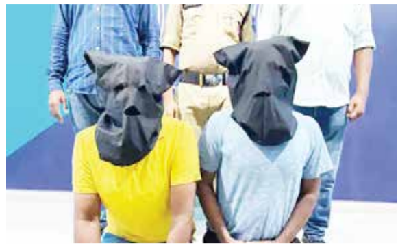
અજન્સી સુરત તા 16