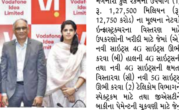
છે ("પ્રાઈઝ બેન્ડ"). એન્ડર ઈન્વેસ્ટર બિડિંગ તારીખ મંગળવાર, 16 એપ્રિલ, 2024 રહેશે. બિડ/ઓફર ગુરુવારે, 18 એપ્રિલ, 2024ના રોજ સબ્સ્ક્રિપ્શન માટે ખુલશે અને સોમવાર, 22 એપ્રિલ, 2024ના રોજ બંધ થશે. કંપની ઈકિવટી શેર્સના ફેશ ઈશ્યુથી

(એજન્સી) અમદાવાદ | તા.16 વોડાફોન આઈડિયા લિમિટેડ ગુરુવારે, 18 એપ્રિલ, 2024ના રોજ ઈકિવટી શેર્સની તેની ફર્થ પબ્લિક ઓફરિંગ (એફપીઓ)ના સંદર્ભે તેની બિડ/ઓફર ખોલશે. કુલ ઓફર સાઈઝમાં રૂ. 1,80,000 મિલિયન સુધીના મૂલ્યના (રૂ. 18,000 કરોડ) ઈકિવટી શેર્સના ફેશ ઈશ્યુનો સમાવેશ થાય છે. ("ફેશ ઈશ્યુ") ("કુલ ઈશ્યુ સાઈઝ"). ઓફરનો પ્રાઈઝ બેન્ડ ઈકિવટી શેર ઈટ ૩.10થી રૂ. 11 પર ફિક્સ કરવામાં આવ્યો છે. બિડ્સ લઘુત્તમ 1,298 ઈકિવટી શેર્સ અને ત્યારબાદ 1,298 ઈકિવટી શેર્સના ગુણાંકમાં કરી શકાય