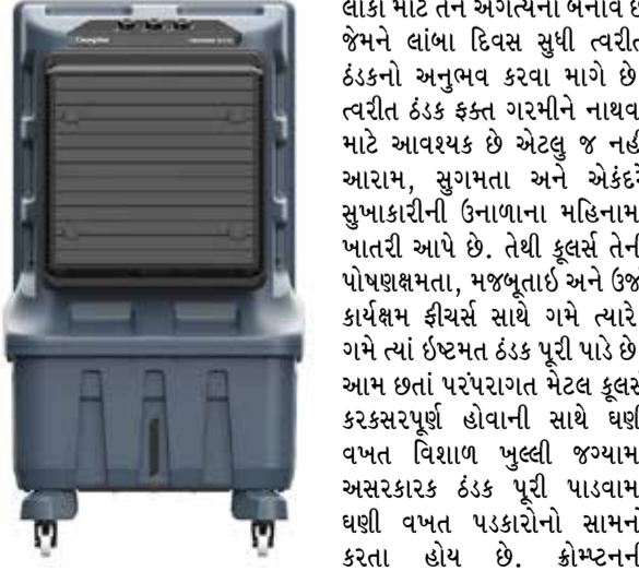
એક નક્કર વાસ્તવિકતા બની ગઈ છે અને તાપમાન અણધારી સ્તરે વધી ગયું છે ત્યારે આપણે આગામી સિઝનમાં ભારે ગરમીનો સામનો કરીશું તેવી શક્યતા છે. આ તીવ્ર ગરમી અને બળતા તાપમાન એવા લોકો માટે તેને અગત્યના બનાવે છે જેમને લાંબા દિવસ સુધી ત્વરિત ઠંડકનો અનુભવ કરવા માગે છે. ત્વરિત ઠંડક ફક્ત ગરમીને નાથવા માટે આવશ્યક છે એટલું જ નહીં આરામ, સુગમતા અને એકંદરે સુખાકારીની ઉનાળાના મહિનામાં ખાતરી આપે છે. તેથી ફૂલીંગ તેની પોષણક્ષમતા, મજબૂતાઈ અને ઊર્જા કાર્યક્ષમ ક્ષમતા સાથે મેળવે ત્યારે, ગમે ત્યાં ઈન્ટરનલ ઠંડક પૂરી પાડે છે. આમ છતાં પરંપરાગત મેટલ ફૂલર્સ કરકસરપૂર્ણ હોવાની સાથે ઘણી વખત વિશાળ ખુલ્લી જગ્યામાં અસરકારક ઠંડક પૂરી પાડવામાં ઘણી વખત પડકારોનો સામનો કરતા હોય છે. કોમ્પનિની ગ્રાહકોના અનુભવમાં વધારો કરવાની પ્રતિબદ્ધતા અનુસાર કંપનીએ ઓદ્યોગિક એર કુલર્સની નવી રેન્જ - IndiBreeze શ્રેણી રજૂ કરી છે જેથી ઉનાળાની સિઝનમાં "જલ્દી ફૂલીંગ" પૂરું પાડી શકાય.

(એજન્સી) મુંબઈ | તા.16 એલાયસીસમાં ગુણવત્તા અને નવીનતાઓમાં આગવી પોતાની પ્રતિબદ્ધતા માટે જાણીતી કોમ્પનિ ગ્રીન્સ કન્સ્યુમર ઈલેક્ટ્રિકલ્સ લિમિટેડે તમારી લિવીંગ સ્પેસને અદ્યતનતા અને અસમારીત શૈલી સાથે સતત પુનઃવ્યાખ્યાયિત કરવાનું ચાલુ રાખ્યું છે. તેને નવા સ્તરે લઈ જતા, કોમ્પનિ ફરી એક વખતે IndiBreeze (ઈન્ડિબ્રીઝ) ઈન્ડસ્ટ્રીયલ ફૂલર રેન્જના લોન્ચ સાથે ફૂલીંગ સોલ્યુશન્સને પ્રસ્થાપિત કરી રહી છે. 95L અને 135Lની ક્ષમતામાં ઉપલબ્ધ આ ઓદ્યોગિક ગ્રેડના ફૂલર્સની રસોડું અને વિશાળ લોબી વિસ્તારો ધરાવતા ફેક્ટરીઓ, વેરહાઉસિસ, રેસ્ટોરન્ટ જેવી ઓટો પુલ્લી જગ્યા ધરાવનારાઓની તાત્કાલિક જરૂરિયાતોને પહોંચી વળવા માટે ખાસ રચના કરવામાં આવી છે. જ્યારે આંબોહવા પરિવર્તન