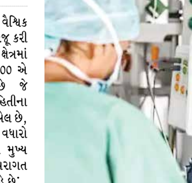
એક્સેસ કરવાની મંજૂરી આપે છે, જાણકાર નિર્ણય લેવાની સુવિધા આપે છે. વપરાશકર્તા-મૈત્રીપૂર્ણ ઈન્ટરફેસ: સિસ્ટમ એક સરળ રૂપરેખાંકન અને સાહજિક વપરાશકર્તા ઈન્ટરફેસ ધરાવે છે, જે ખાતરી કરે છે કે તબીબી વ્યાવસાયિકો દર્દીના રેડાને ઝડપથી અને સચોટ રીતે અર્થઘટન કરી શકે છે.

(એજન્સી) મુંબઈ | તા.16 મેડિકલ અને સેક્ટરી ટેકનોલોજીમાં વૈશ્વિક અગ્રણી ડ્રેગરે ભારતમાં Vista 300 રજૂ કરી છે, જે દર્દીની દેખરેખ પ્રણાલીના ક્ષેત્રમાં નોંધપાત્ર સીમાચિહ્નરૂપ છે. વિસ્તા 300 એ એક ગ્રાઉન્ડબ્રેકિંગ સોલ્યુશન છે જે હોસ્પિટલોના વિવિધ વિભાગોમાં માહિતીના પ્રવાહને ઓપ્ટિમાઇઝ કરવા માટે રચાયેલ છે, જેનાથી ક્લિનિકલ કેર ડિલિવરીમાં વધારો થાય છે. વિસ્તા 300 સિસ્ટમ ઘણી મુખ્ય સુવિધાઓ પ્રદાન કરે છે જે તેને પરંપરાગત દર્દી મોનિટરિંગ સિસ્ટમથી અલગ પાડે છે: સીમલેસ ઈન્ટિગ્રેશન: Vista 300 ની સૌથી નોંધપાત્ર વિશેષતાઓમાંની એક એ છે કે તે દર્દીના રેડા, હેડવર્ણ સંકેતો અને થેરાપી રિવાઈસ 300, 300નું ક્લિનિકલ વર્કફ્લોમાં સીમલેસ એકીકરણ છે. આ એકીકરણ તબીબી વ્યાવસાયિકોને બહુવિધ સ્ત્રોતોમાંથી વ્યાપક તબીબી સંભાળ માહિતીને