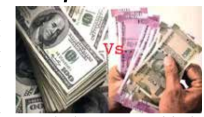
પ્રવાસ અને વિદેશમાં અભ્યાસ પણ મોંઘો થશે. વિશ્વના 85 ટકા વેપાર અમેરિકી ડોલર મારફત થાય છે. વિદેશી રોકાણ પણ ઘટવાની ભીતિ દર્શાવાઈ છે. મોટાભાગની આયાતમાં એક્સચેન્જ રેટ તરીકે ડોલરનો ઉપયોગ થતો હોવાથી કુગાવો વધી શકે છે. ઈરાન-ઈઝરાયલ યુદ્ધના પગલે કૂડ

(એજન્સી) મુંબઈ | તા.16 ઈરાન-ઈઝરાયલ વચ્ચે વણસી રહેલા તણાવના પગલે ડોલર ઈન્વેક્સ મજબૂતાઈથી આગળ વધી રહ્યો છે. ડોલર સામે રૂપિયો આજે 9 પૈસા તુટી 83.53ની રેકોર્ડ તળિયે પહોંચ્યો છે. અગાઉ 22 માર્ચ, 2024ના રોજ રૂપિયો 83.45ના તળિયે નોંધાયો હતો. ઈરાન-ઈઝરાયલ વચ્ચે તણાવ વધી રહ્યો છે, જેનો સપોર્ટ ડોલરને મળ્યો છે. બીજી બાજુ અમેરિકી ફેડ રિઝર્વ પણ હાલ રેટ કટમાં વિલંબ કરે તેવો આશાવાદ નિષ્ણાતો દર્શાવી રહ્યા છે. જેના લીધે યુએસ ડોલર ઈન્વેક્સ 6 માસની ટોચે પહોંચ્યો છે. રૂપિયામાં કડાકાના પગલે ભારત દ્વારા થતી આયાતો મોંઘી થશે. વિદેશ