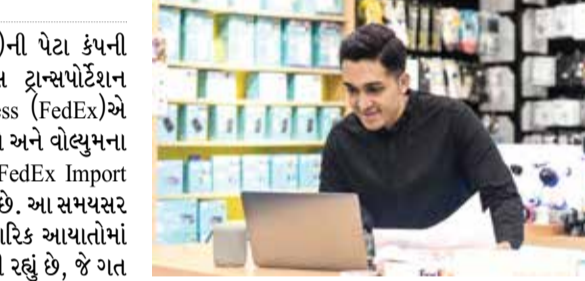
અને યુઝર-કેન્દ્રિત ડિઝાઇન એકીકરણ સાથે FIT આયાત પ્રક્રિયામાં પરિવર્તન લાવવા, કાર્યક્ષમતા, અનુપાલન અને એકંદરે એન-ટુ-એન શિપમેન્ટ કામગીરીમાં સુધારો લાવવા સજજ છે.

(એજન્સી) મુંબઈ | તા.16 FedEx Corp. (NYSE: FDX)ની પેટા કંપની અને વિશ્વની સૌથી મોટી એક્સપ્રેસ ટ્રાન્સપોર્ટેશન કંપનીઓ પૈકીની એક FedEx Express (FedEx)એ ભારતમાં આયાતોની વધતી જટિલતાઓ અને વોલ્યુમના સમાધાન માટે અત્યાધુનિક સોલ્યુશન FedEx Import Tool (FIT) રજૂ કરવાની જાહેરાત કરી છે. આ સમયસર લોચ મહત્વપૂર્ણ છે જ્યારે ભારત વ્યાપારિક આયાતોમાં 12.2 ટકાનો નોંધપાત્ર વધારો અનુભવી રહ્યું છે, જે ગત વર્ષના જાન્યુઆરીમાં 54.4 બિલિયન ડોલરથી વધીને ફેબ્રુઆરી, 2024માં 60.11 બિલિયન યુએસ ડોલર થઈ છે. આયાત ક્ષેત્રની જટિલતાઓના વ્યવસ્થાપન માટે સ્પાઈ, વધુ કાર્યક્ષમ ઉકેલની જરૂર છે. અદ્યતન ટેકનોલોજી