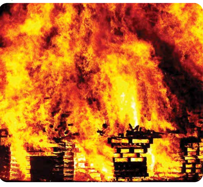
મુંબઈ | ભારતના મહાનગરમાં, આગ જેવી કટોકટી અસામાન્ય નથી. ગુરુવારે, મુંબઈના રોડ વિસ્તારમાં મોટા પાયે આગ ફાટી નીકળી જોવા મળી હતી, જેના કારણે આજુબાજુમાં આંકડાની લાગણી ફેલાઈ હતી. સદનસીબે, અધિકારીઓના તાત્કાલિક પગલાંથી અત્યાર સુધી કોઈ જાનહાનિ થતી અટકી છે.