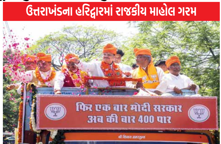
ઉત્તરાખંડના પૂર્વ મુખ્યમંત્રી ત્રિવેન્દ્ર સિંહ રાવત આગામી ચૂંટણીમાં ભાજપનું પ્રતિનિધિત્વ કરી રહ્યા છે. બીજી તરફ ઉત્તરાખંડના પૂર્વ મુખ્યમંત્રી હરીશ રાવતના પુત્ર વીરેન્દ્ર રાવત કોંગ્રેસની ટિકિટ પર ચૂંટણી લડી રહ્યા છે.

ત્રિવેન્દ્ર સિંહ રાવત સક્રિયપણે પ્રચાર કરી રહ્યા છે, વિકાસ, ઈન્ફ્રાસ્ટ્રક્ચર અને ગવર્નન્સ જેવા મુખ્ય મુદ્દાઓ પર ધ્યાન કેન્દ્રિત કરી રહ્યા છે. મુખ્ય પ્રધાન તરીકેનો તેમનો કાર્યકાળ વિવિધ પહેલો દ્વારા ચિહ્નિત કરવામાં આવ્યો છે, જેનો તેઓ મતદારો પાસેથી સમર્થન મેળવવા માટે ઉપયોગ કરી રહ્યા છે. વીરેન્દ્ર રાવત તેમના પરિવારના વારસા અને હરિદ્વારના વિકાસ માટેના પોતાના વિઝન પર આધાર રાખે છે. તેમની ઝુંબેશ બેરોજગારી, આરોગ્યસંભાળ અને શિક્ષણ સહિતના પાયાના મુદ્દાઓ પર ભાર