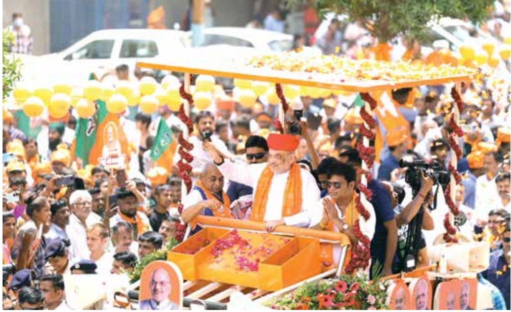
(એજન્સી) અમદાવાદ । તા.18

ગાંધીનગર લોકસભા બેઠકના ભાજપના ઉમેદવાર અને કેન્દ્રીય ગૃહ તેમજ સહકારિતા મંત્રી અમિત શાહ 19 એપ્રિલે ઉમેદવારી ફોર્મ ભરવા જવાના છે. તે પહેલાં આજે 18 એપ્રિલના રોજ ગાંધીનગર લોકસભા હેઠળ આવતી સાણંદ વિધાનસભા વિસ્તારના APMC સર્કલથી મેગારેલી યોજાઈ ચૂંટણી પ્રચારના શ્રીગણેશ કર્યા હતા. જેમાં મોટી સંખ્યામાં ભાજપના કાર્યકરો જોડાયા હતા. ત્યાર બાદ કલોલ વિધાનસભા વિસ્તારમાં રોડ શો યોજ્યો હતો. ત્યાર બાદ સાબરમતી વિધાનસભા ક્ષેત્રના રાષ્ટ્રીય શાક માર્કેટથી રોડ શો શરૂ કર્યો હતો. જે ઘાટલોડિયા વિધાનસભા ક્ષેત્ર, નારણપુરા વિધાનસભા ક્ષેત્ર અને અંતમાં વેજલપુર વિધાનસભા વિસ્તારમાં પૂર્ણ કર્યો હતો. ત્યારબાદ અમિત શાહે વેજલપુરમાં જ જાહેર સભા સંબોધી