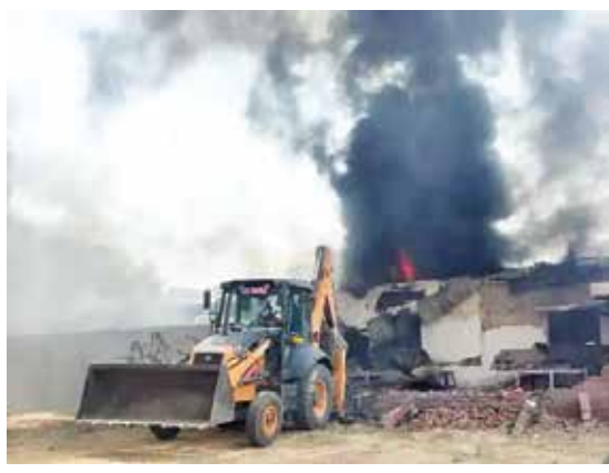
(એજન્સી) અમદાવાદ । તા.18

અમદાવાદના કુબડથલ ગામે આવેલી કંપનીમાં લાગેલી વિકરાળ આગમાં મોટા ઘડાકા થયા, 3 કલાકના જહેમતથી માંડ ઠરી