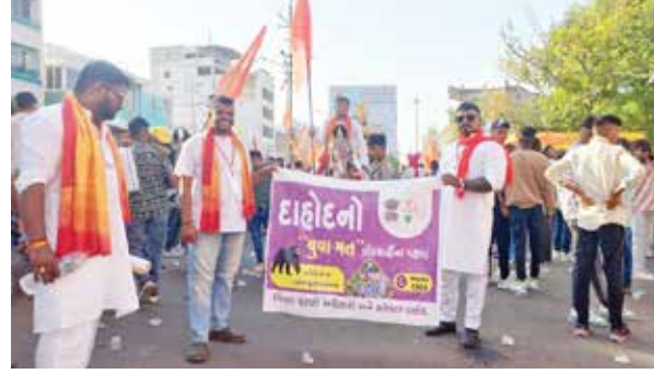
લોકશાહીને જીવંત રાખે છે. દેશનો દરેક મતદાર લોકશાહીના આ મહાપર્વમાં સહભાગી બને તે માટે વિસ્તૃત માહિતી આપી પરિવાર સાથે અવશ્ય મતદાન કરી અન્ય લોકોને પણ મતદાન માટે પ્રેરિત કરવા અનુરોધ કરવામાં આવ્યો હતો. વધુમાં, રામનવમી પર્વ નિમિત્તે મતદારોને જાગૃત કરવામાં આવ્યા હતા. ઘાણેદ શહેરના મુખ્ય માર્ગો પરથી પસાર થયેલી આ યાત્રામાં મતદાર જાગૃતિ અંગેના બેનરો તથા પોસ્ટરો લગાવી મત આપવા માટે સહી ઝુંબેશ, સેલ્ફી સ્ટેન્ડ સાથે મતદારોને જાગૃત કરવામાં આવ્યા મતદારોને મતદાનનું મહત્વ સમજાવી આગામી ચૂંટણીમાં સહપરિવાર સાથે અવશ્ય મતદાન કરવા સંદેશો આપવામાં આવ્યો હતો.

લોકસભા સામાન્ય ચૂંટણી - ૨૦૨૪ અન્વયે ઘાણેદ જિલ્લા ચૂંટણી અધિકારી અને કલેક્ટર શ્રી યોગેશ નિરગુડના માર્ગદર્શન હેઠળ જિલ્લામાં મતદારો મતદાનની નૈતિક ફરજ અચૂક નિભાવી મહત્તમ મતદાન કરે તે માટે વિવિધ પ્રયાસો હાથ ધરવામાં આવી રહ્યા છે. ઘાણેદ મદદનીશ ચૂંટણી અધિકારી અને પ્રાંત અધિકારી શ્રી સુશ્રી નીલાંજસા રાજપુતના માર્ગદર્શન હેઠળ ઘાણેદ ખાતે રામનવમી પર્વ નિમિત્તે મતદાન જાગૃતિ કાર્યક્રમ યોજવામાં આવ્યો હતો. આ પર્વ નિમિત્તે ચૂંટણી સાથે જોડાયેલા અધિકારી શ્રીઓ અને કમચારી શ્રીઓ દ્વારા મતદાન કરવા અંગે જાગૃત કરવામાં આવ્યા હતા. ચૂંટણી લોકશાહી વ્યવસ્થાનું અતિ મહત્વનું અંગ હોય, મતદારો જ લોકશાહીને જીવંત રાખે છે. દેશનો દરેક મતદાર લોકશાહીના આ મહાપર્વમાં સહભાગી બને તે માટે વિસ્તૃત માહિતી આપી પરિવાર સાથે અવશ્ય મતદાન કરી અન્ય લોકોને પણ મતદાન માટે પ્રેરિત કરવા અનુરોધ કરવામાં આવ્યો હતો. વધુમાં, રામનવમી પર્વ નિમિત્તે મતદારોને જાગૃત કરવામાં આવ્યા હતા. ઘાણેદ શહેરના મુખ્ય માર્ગો પરથી પસાર થયેલી આ યાત્રામાં મતદાર જાગૃતિ અંગેના બેનરો તથા પોસ્ટરો લગાવી મત આપવા માટે સહી ઝુંબેશ, સેલ્ફી સ્ટેન્ડ સાથે મતદારોને જાગૃત કરવામાં આવ્યા મતદારોને મતદાનનું મહત્વ સમજાવી આગામી ચૂંટણીમાં સહપરિવાર સાથે અવશ્ય મતદાન કરવા સંદેશો આપવામાં આવ્યો હતો.