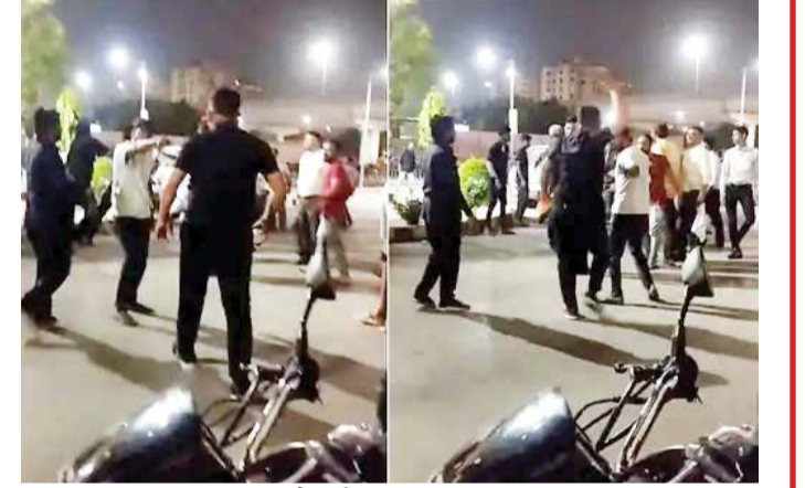
(એજન્સી) અમદાવાદ | તા.24

અમદાવાદ શહેરમાં અનેક સ્થળ પર સિક્કોરિટી ગાર્ડ અને સામાન્ય જનતા વચ્ચે ઝડપી ઘટના બનતી હોય છે. આવી જ ઘટના અમદાવાદની સોલા સિવિલ હોસ્પિટલમાં બની હતી. ગઈકાલે મોડી સાંજે સોલા સિવિલ હોસ્પિટલમાં દર્દીના સગાને અટકાવતા મારામારીની ઘટના બની હતી. જેનો વીડિયો સામે આવ્યો છે.