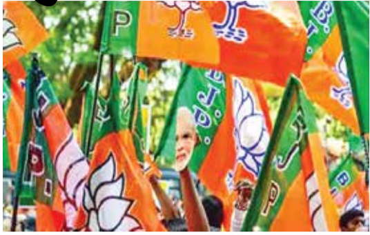
(એજન્સી) સુરત | તા 24

સુરત લોકસભા બેઠક ઉપર મહદંશે દબદબો ભારતીય જનતા પાર્ટીનો રહ્યો છે. સુરતનું સંગઠન ખૂબ જ મજબૂત હોવાને કારણે ચૂંટણી જીતવામાં ભાજપને વધુ કોઈ મુશ્કેલી થતી નથી. વિધાનસભાની ચૂંટણી હોય, કોર્પોરેશનની ચૂંટણી હોય કે લોકસભાની ચૂંટણી હોય સંગઠન ખૂબ સારી રીતે કામ કરે છે અને તેનું પરિણામ પણ મળતું હોય છે. હાલ જ્યારે સુરત લોકસભા બેઠક બિનહરીફ જાહેર કરવામાં આવી છે ત્યારે સુરતના હોદ્દાદારો અને કાર્યકર્તાઓનો ઉપયોગ કરવાનો અંકશન ધ્યાન તૈયાર કરી દેવાયો છે. સુરત સંગઠનની ટીમ ફરી