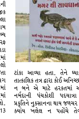
ટાંકા આવ્યા હતા. તેને ધ્યાનમાં રાખી તાત્કાલિક તંત્ર દ્વારા કોઈ અનિચ્છનિય બનાવ ન બને એ માટે હરકતમાં આવી હતી. નર્મદાની પંચકોશી પદયાત્રા દરમિયાન પ્રકૃતિને નુકસાનના થાય જળચર પ્રાણીને પણ ક્યાંય ખદેલ ન પહોંચે તેવી તકેદારી

પદયાત્રીઓએ રાખવી જોઈએ. ખાસ કરીને નર્મદા નદીમાં મગરો પણ વિચરણ કરતા હોવાથી તેની કાળજી લેવી આવશ્યક બને છે. પદયાત્રીઓ મગરોને અને મગરોથી પદયાત્રીઓને કોઈ હાનિ ના થાય તે માટે વન વિભાગ દ્વારા માર્ગદર્શિકા આપવામાં આવી છે. કહ્યું છે કે, મગરોના સંવનન કાળ અને ઈંડા મુકવાનો સમય હોઈ તેઓ છંછેડાઈને કોઈને એટક ન કરે તે માટે અગમચેતી રાખવા જણાવ્યું હતું. નર્મદા નદીના વિસ્તારોમાં મગરોનો વસવાટ અને વસ્તી મોટા પ્રમાણમાં છે. મુખ્યત્વે આવા વિસ્તારમાં માનવીની અવર-જવરથી મગર ભયભીત બને છે. તેમજ આવા વિસ્તારમાં મગર ઈંડા મુકતા હોય તેને મગરોને રક્ષણ આપવાના કારણે મગરો દ્વારા માનવ ઉપર