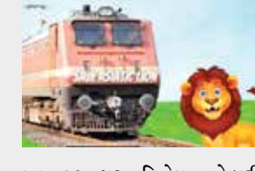
આ રૂટ પર વિશેષ તકેદારી રાખવામાં આવી રહી છે.

રાજુલા પીપાવાવ રેલવે ટ્રેક પર ગતરાત્રીના એક સિંહ ચડી આવ્યો હતો, જેને જોઈને લોકો પાઈલોટે ટ્રેન રોકી હતી અને સિંહ ટ્રેક ઓળંગી ગયા બાદ ટ્રેન રવાના કરી હતી. આમ લોકો પાઈલોટની સજાગતાથી વધુ એક સિંહનો જીવ જતો બચી ગયો હતો. રાજુલા પીપાવાવ વચ્ચે દોડતી ટ્રેનની હડકેટે સિંહના મોતની ગંભીર બાબત અંગે હાઈકોર્ટે રેલવે અને વનવિભાગને કડક આદેશ કર્યો હતો. જેના અનુસંધાને રેલવે વિભાગ દ્વારા