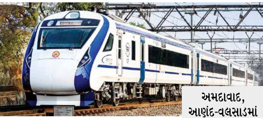
અમદાવાદ, આણંદ-વલસાડમાં અકસ્માત નડ્યો

અમદાવાદથી મુંબઈ જતી વંદે ભારત ટ્રેનના દરવાજા જ ના ખૂલતા મુસાફરો પરેશાન બન્યા હતા. સુરત રેલવે સ્ટેશન પર દરવાજા ન ખૂલતા ટ્રેન એક કલાકથી વધુ સમય સુધી અટવાઈ હતી. સુરત ખાતે સવારે 8.20 વાગ્યે વંદે ભારત ટ્રેન પહોંચે છે. પરંતુ ટેકનિકલ કારણોસર ટ્રેનના દરવાજા ન ખૂલતા મુસાફરો સ્ટેશન પર ઊંતરવા માટે પરેશાન બન્યા હતા. ટ્રેનમાં લાઈટ, એસી બંધ કરવા છતાં પણ દરવાજા ખૂલ્યા નહોતા. મેન્યુઅલી દરવાજા ખોલવા માટે રેલવે સ્ટાફ મજબૂર બન્યો હતો. ટ્રેનના સી-14 કોચનો દરવાજો મેન્યુઅલી ખોલવામાં આવ્યો હતો. વંદે ભારત ટ્રેનમાં સુરત રેલવે સ્ટેશન પર ઊંતરનારા તમામ મુસાફર સી-14 કોચના દરવાજામાંથી બહાર નીકળ્યા હતા. અમદાવાદથી મુંબઈ જતી વંદે ભારત ટ્રેન સુરત સ્ટેશન ઉપર સવારે પહોંચી હતી. વંદે ભારત ટ્રેન અંદાજે 8.20 વાગ્યે સુરત રેલવે સ્ટેશન ઉપર પહોંચતા મુસાફરો પોતાના કોચમાંથી બહાર જવા માટે ઊભા થયા હતા. પરંતુ ટ્રેનના કોચના દરવાજા ખૂલ્યા નહોતા. જેના કારણે મુસાફરો અંદર જ બેસી રહ્યા હતા. થોડીવાર માટે તો કોચમાં બેઠેલા મુસાફરો કંઈ સમજી શક્યા નહોતા. ત્યારબાદ રેલવે સ્ટાફ વંદે ભારત ટ્રેન પાસે પહોંચી ગયો હતો.