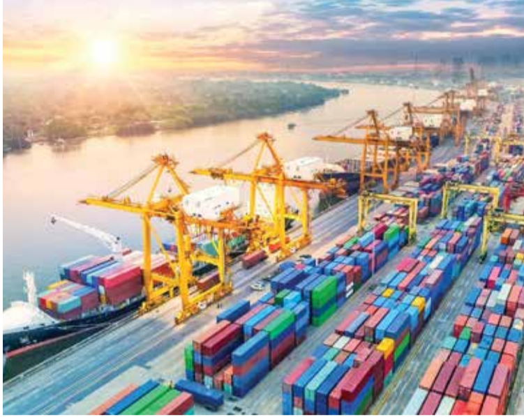
જે ૩૦.૧૩ અબજ ડોલર રહી હતી તે નાણાં વર્ષ ૨૦૨૩-૨૪માં ૧૮.૨૫ ટકા વધી ૩૫.૬૩ અબજ ડોલર રહી હતી જ્યારે આજ ગાળામાં આયાત ૨૮.૭૯ અબજ ડોલરથી ૬૧ ટકા વધી

(એજન્સી) મુંબઈ | તા.14 FTA : જે દેશો સાથે ભારતના મુક્ત વેપાર કરાર છે તેમની સાથે ભારતની નિકાસ કરતા છેલ્લા પાંચ વર્ષમાં આયાતમાં નોંધપાત્ર વધારો થયો છે. મુક્ત વેપાર કરાર સાથેના દેશો ખાતેથી ભારતની માલસામાનની આયાત છેલ્લા પાંચ વર્ષમાં અંદાજે ૩૮ ટકા વધી ૧૮૭.૯૨ અબજ ડોલર રહી હોવાનું ગ્લોબલ ટ્રેડ રિસર્ચ ઈનિશિએટિવ (જીટીઆરઆઈ) દ્વારા જણાવ્યું હતું. આની સામે આજ ગાળામાં નિકાસ ૧૪.૪૮ ટકા વધી ૧૨૨.૭૨ અબજ ડોલર રહી હતી. મુક્ત વેપાર કરાર સાથેના દેશો ખાતેથી ૨૦૧૮-૧૯માં આયાત અંક જે ૧૩૬.૨૦ અબજ ડોલર રહ્યો હતો તે ૩૭.૯૭ ટકા વધી ૧૮૭.૯૨ અબજ ડોલર રહ્યો હતો. જ્યારે નિકાસ આ ગાળામાં ૧૦૭.૨૦ અબજ ડોલરથી વધી ૧૨૨.૭૨ અબજ ડોલર રહ્યાનું પણ પ્રાપ્ત આંકડા જણાવે છે. મુક્ત વેપાર કરારને કારણે ભારતના વિદેશ વેપારના ગણિતોમાં નોંધપાત્ર બદલાવ જોવા મળી રહ્યાનું જીટીઆરઆઈના આંકડા પરથી કહી શકાય એમ છે. ૨૦૧૮-૧૯માં યુએઈ ખાતે ભારતની નિકાસ