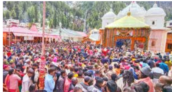
(એજન્સી) અમદાવાદ | તા.14

આ વર્ષે યારધામ યાત્રાનો પ્રારંભ થવાની સાથે જ વિક્રમી સંખ્યામાં યાત્રિકો યમનોત્રી, ગંગોત્રી, કેદારનાથ અને બદ્રીનાથ પહોંચી રહ્યાં છે. મોટી સંખ્યામાં યાત્રિકો ઉમટી પડતા તંત્ર દ્વારા યાત્રિકો માટે કરાયેલ વ્યવસ્થા ખોરવાઈ જવા પામી છે. જેના કારણે ગંગોત્રી અને યમનોત્રીના યાત્રા માટે ઓફલાઈન રજીસ્ટ્રેશન આગામી 23મી મે સુધી બંધ કરી દેવામાં આવી છે. આ દરમિયાન યારધામની યાત્રાએ ગયેલા અનેક ગુજરાતી યાત્રિકો રસ્તામાં ફસાયા હોવાનું સામે આવ્યું છે.