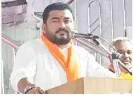
ગીર સોમનાથ (વેરાવળ) | તા.20