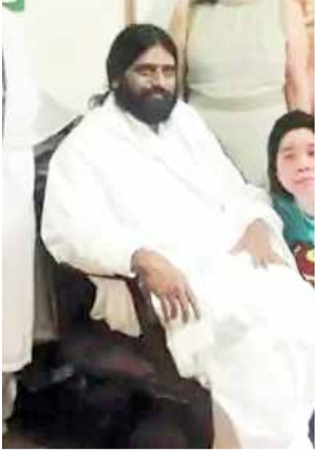
એજન્સી સિંગાપોર તા ૦૧

ઈરાનમાં સંવિધાન પ્રમાણે પ્રમુખપદ માટે ઓછામાં ઓછા ૫૦ ટકા મત મળવા જરૂરી છે ૧ કરોડ ૨૦ લાખ મતમાંથી ૬૦ લાખ કે તેથી વધુ મત મળે તે જ પ્રમુખપદે આવી શકે છે