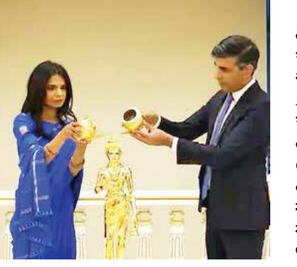
એજન્સી લંડન તા ૦૧

બ્રિટિશ વડાપ્રધાન ઋષિ સુનક અને તેમની પત્ની અક્ષતા મૂર્તિ લંડનમાં નીસડન મંદિર પહોંચ્યા અને દેશમાં ૪ જુલાઈએ યોજાનારી ચૂંટણીના ૪ દિવસ પહેલા પૂજા કરી.