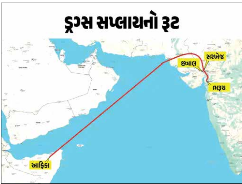
ડ્રગ્સ સપ્લાયનો રૂટ

પ્રતિબંધિત દવાઓનું પણ હવે ગુજરાતમાં વધી રહ્યું છે. એમાં પણ ખાસ કરીને ઇન્ડસ્ટ્રિયલ એસિડના અંદર પ્રતિબંધિત દવાઓ બનાવવાનો રીતસરનો કારોબાર શરૂ થયો છે. થોડા સમય પહેલાં કસ્ટમ વિભાગ અને ભુજ પોલીસ દ્વારા ટ્રેમ્પોલનું આખું કન્સાઇનમેન્ટ પકડવામાં આવ્યું હતું. ભરૂચ અંકલેશ્વર પાસેની એક ફેક્ટરીમાં પ્રતિબંધિત ટ્રેમ્પોલ દવાઓનું ઉત્પાદન થઈ રહ્યું છે અને એ સંદર્ભે ભરૂચ પોલીસને સાથે રાખીને ત્યાં રેડ કરવામાં આવી હતી. આ સમગ્ર ઓપરેશન દરમિયાન 31 કરોડનું રો-મટીરિયલ લિક્વિડ ફોર્મમાં મળી આવ્યું હતું. હવે આ કેસમાં ત્રણ શખસ છત્રાલમાં આવેલી એક ફેક્ટરીમાં ટ્રેમ્પોલનું ઉત્પાદન કરી આફ્રિકા સપ્લાય કરતાનો પર્દાફાશ થયો છે. આ ત્રણેય શખસની ધરપકડ કરી લેવામાં આવી છે, જેમાં એક તો ડ્રગ્સ રેકેટનો માસ્ટરમાઈન્ડ નીકળ્યાનું સામે આવ્યું છે. આ પહેલાં ગુજરાત બોર્ડર રેન્જ તરફથી કેટલાક ઇનપુટને આધારે કસ્ટમ સાથે મળીને મોટી રેડ કરી હતી, જેમાં ટ્રેમ્પોલ દવા સપ્લાય થતી હોવાનું પકડાયું હતું, આથી તાત્કાલિક જાગેલી ગુજરાત એટીએસે ફરીથી આ પ્રકારની રેડ કરીને કામગીરી કરી હોવાનું બતાવ્યું હતું.