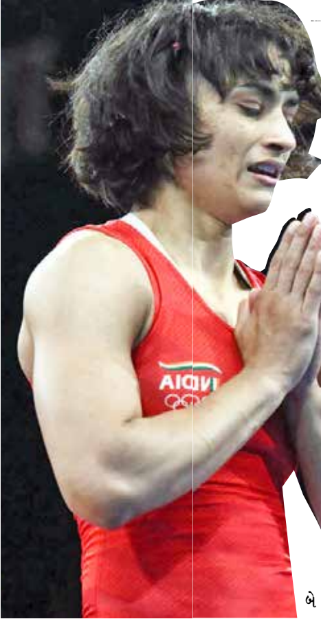
(એજન્સી) પેરિસ તા 10

આંતરરાષ્ટ્રીય ઓલિમ્પિક સમિતિના પ્રમુખનું મોટું નિવેદન