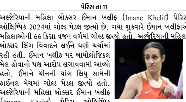
પેરિસ તા 11

અલ્જેરિયાની મહિલા બોક્સર ઈમાન ખલીફ (Imane Khelif) પેરિસ ઓલિમ્પિક્સ 2024માં ગોલ્ડ મેડલ જીત્યો છે. ગયા શુક્રવારે ઈમાન ખલીફએ મહિલાઓની 66 કિગ્રા વજન વર્ગમાં ગોલ્ડ જીત્યો હતો. અલ્જેરિયાની મહિલા બોક્સર લિંગ વિવાદને લઈને ઘણી ચર્ચામાં રહી હતી. ઈમાન ખલીફ પર બાયોલોજિકલ મેલ હોવાનો પણ આરોપ લગાવવામાં આવ્યો હતો. ઈમાને ચીનની યાંગ લિયુ સામેની ફાઇનલ મેચમાં ગોલ્ડ મેડલ જીત્યો હતો. અલ્જેરિયાની મહિલા બોક્સર ઈમાન ખલીફ (Imane Khelif) પેરિસ ઓલિમ્પિક્સ 2024માં ગોલ્ડ મેડલ જીત્યો છે. ગયા શુક્રવારે ઈમાન ખલીફએ મહિલાઓની 66 કિગ્રા વજન વર્ગમાં ગોલ્ડ જીત્યો હતો. અલ્જેરિયાની મહિલા બોક્સર લિંગ વિવાદને લઈને ઘણી ચર્ચામાં રહી હતી. ઈમાન ખલીફ પર બાયોલોજિકલ મેલ હોવાનો પણ આરોપ લગાવવામાં આવ્યો હતો. ઈમાને ચીનની યાંગ લિયુ સામેની ફાઇનલ મેચમાં ગોલ્ડ મેડલ જીત્યો હતો. આંતરરાષ્ટ્રીય ઓલિમ્પિક સમિતિનું માનવું હતું કે તે તેમના માનક્રોમાં ખરી ઉતરી છે, જેના કારણે તેને સ્પર્ધામાં ભાગ લેવાની મંજૂરી આપવામાં આવી હતી. ઈમાન આખરે ગોલ્ડ મેડલ જીત્યો. પરંતુ નોંધનીય બાબત એ છે કે અલગ-અલગ મેચોમાં ભાગ લેનાર વિવિધ દેશોની મહિલા બોક્સરોએ ઈમાન વિરુદ્ધ અવાજ ઉઠાવ્યો હતો. ઈમાન ખલીફને ઈટાલીની બોક્સર એન્જેલા કેરિની સામે 16મા રાઉન્ડની મેચ રમી હતી. ઈટાલિયન બોક્સરે થોડી જ સેકન્ડમાં ઈમાન ખલીફ સામે ફાઈટ છોડી દીધી હતી અને તે રિંગમાંથી બહાર નીકળી ગઈ હતી. આ પછી ઈમાન ખલીફએ ફાઇનલ સુધી તેની તમામ મેચો એકતરફી જીતી લીધી હતી.