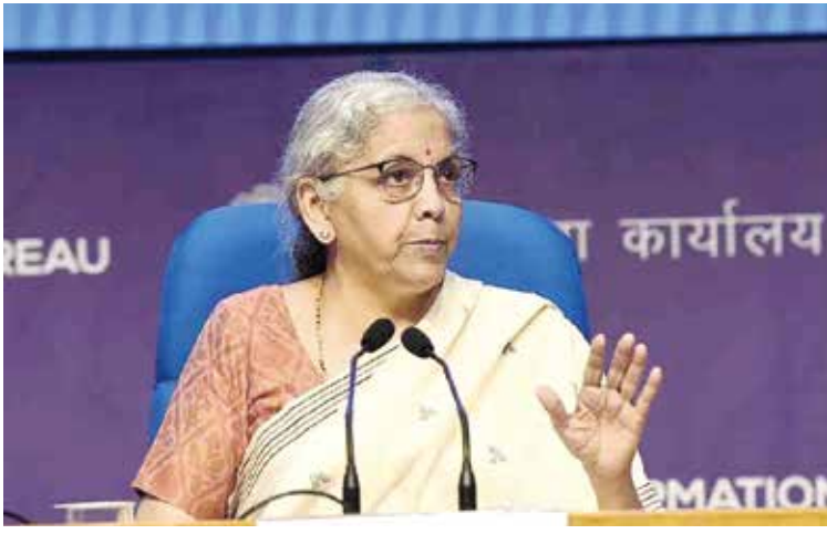
તેમની મુખ્ય વ્યવસાયિક પ્રવૃત્તિઓ પર ધ્યાન કેન્દ્રિત કરવા માટે કહી રહ્યા છે. તેઓએ આકર્ષક રીતે થાપણો મેળવવા અને

નાણા મંત્રી નિર્મલા સીતારમણે લોકો બેન્કોમાં પૈસા જમા કરાવવાથી દૂર રહેતાં હોવા મામલે ચિંતા વ્યક્ત કરી છે. શનિવારે રિઝર્વ બેન્ક ઓફ ઈન્ડિયાના બોર્ડ ઓફ ડિરેક્ટર્સની બેઠકને સંબોધિત કર્યા પછી, તેમણે કહ્યું કે બેન્કોએ તેમની મુખ્ય કામગીરી પર ધ્યાન કેન્દ્રિત કરવાની જરૂર છે અને લોકોને નાણાં જમા કરાવવા આકર્ષિત થાય તે માટે નવી અને આકર્ષક યોજનાઓ રજૂ કરવાની જરૂર છે. બજેટ બાદ, નાણા મંત્રી સીતારમણે રીતે આરબીઆઈના બોર્ડ ઓફ ડિરેક્ટર્સની બેઠકને સંબોધિત કરે છે. તેમણે કહ્યું કે સ્થાનિક અર્થવ્યવસ્થા વધુ અન્ય રોકાણ પ્રોડક્ટ્સમાં જઈ રહી છે, તેથી આ મુદ્દે ધ્યાન આપવાની જરૂર છે. સીતારમણે કહ્યું કે આરબીઆઈ અને સરકાર બંને બેન્કોને