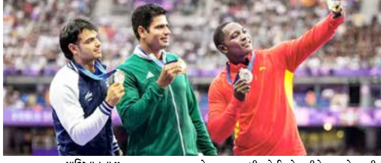
પાકિસ્તાન તા 11

પાકિસ્તાનનો અરશદ નદીમને એ એવોર્ડથી નવાજવાની જાહેરાત કરી છે. જેને મેળવનાર પહેલો પાકિસ્તાની ખેલાડી હશે. ઈમરાન ખાનથી લઈ બાબર અઝમ સુધી મોટા મોટા ક્રિકેટરને પણ આ એવોર્ડ મળ્યો નથી. પેરિસ ઓલિમ્પિક્સમાં ઈતિહાસ રચ્યા બાદ અરશદ નદીમ પોતાના વતન પરત થઈ છે. પાકિસ્તાનના લાહોર એરપોર્ટ પર યેલેના લેન્ડિંગ સાથે તેનું સ્વાગત કરવામાં આવ્યું હતું. પાકિસ્તાન સરકારે અરશદ નદીમના વતન પરત ફરતા પહેલા દેશના સૌથી મોટા એવોર્ડમાંથી એકથી નવાજવાની જાહેરાત કરી છે. અરશદ નદીમને પાકિસ્તાન સરકારે જે સન્માનથી જાહેરાત કરવાની જાહેરાત કરી છે.