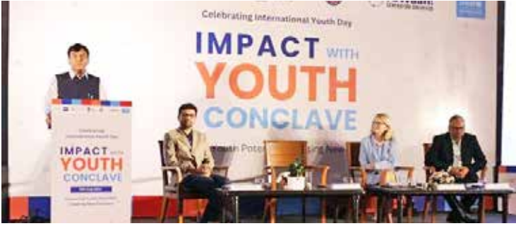
આવતીકાલના જ નહીં, પરંતુ આજના પરિવર્તન ઘડનારાઓ પણ છે. તમારી ઊર્જા, નવીનતા અને સમર્પણ માનનીય પ્રધાનમંત્રીના વર્ષ 2047 સુધીમાં વિકસિત ભારતનાં વિઝનને સાકાર કરવા માટે

અમદાવાદ 11 ડી.12 કેન્દ્રીય યુવા બાબતો અને રમતગમત તથા શ્રમ અને રોજગાર મંત્રી ડો. મનસુખ માંડવિયાએ આજે ગુજરાતના અમદાવાદમાં 'ઇમ્પેક્ટ વીથ યુથ કોન્ક્લેવ 2024'માં મુખ્ય સંબોધન કર્યું હતું. યુવા બાબતો અને રમતગમત મંત્રાલયના સહયોગથી સંયુક્ત રાષ્ટ્ર ભારત, યુનિસેફ, યુનિસેફ યુવાહ અને એલિફિન્ડર ફાઉન્ડેશન દ્વારા સંયુક્ત રીતે આયોજિત આ કાર્યક્રમમાં સેંકડો ઉત્સાહી યુવાનોને પોતાની ક્ષમતાને ખોલવા માટે સમર્પિત કરવામાં આવ્યા હતા. વિકસિત ભારતના સ્વપ્નને સાકાર કરવામાં યુવાનોની ભૂમિકા પર પ્રકાશ પાડતા ડો. માંડવિયાએ જણાવ્યું હતું કે, 'યુવાનો માત્ર