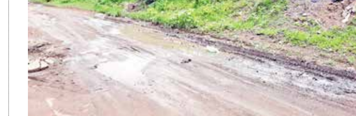
સિહોર | તા.12