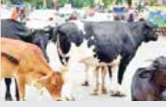
એજન્સી દ્વારા કરવામાં નહીં આવતા મહાપાલિકા દ્વારા કરવામાં આવી રહી છે પરંતુ ઓછા ઢોર પકડવામાં આવી રહ્યા છે તેથી ઢોરનો ત્રાસ ઘટતો નથી ત્યારે વધુમાં વધુ ઢોર પકડવાની કામગીરી કરવામાં આવે તેવું લોકો ઈચ્છી રહ્યા છે.

ભાવનગર મહાપાલિકાએ રખડતા ઢોરને પુરવા માટે ચાર ઢોર ડબ્બા બનાવ્યા છે અને આ ચારેય ઢોર ડબ્બામાં આશરે ૨,૫૦૦ ઢોર છે અને આ તમામ ઢોરનો મહાપાલિકા દ્વારા નિભાવ કરવામાં આવી રહ્યો છે. રખડતા ઢોર પકડવાની કામગીરી એજન્સી દ્વારા કરવામાં નહીં આવતા મહાપાલિકા દ્વારા કરવામાં આવી રહી છે પરંતુ ઓછા ઢોર પકડવામાં આવી રહ્યા છે તેથી ઢોરનો ત્રાસ ઘટતો નથી ત્યારે વધુમાં વધુ ઢોર પકડવાની કામગીરી કરવામાં આવે તેવું લોકો ઈચ્છી રહ્યા છે.