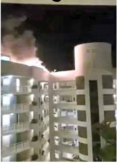
(એજન્સી) ઓસ્ટ્રેલિયા તા 12

દેશ અને દુનિયામાં દરરોજ પ્લેન અને હેલિકોપ્ટર કેશની ઘટનાઓ બની રહી છે. આજે ફરી એક હેલિકોપ્ટર કેશ થયું છે. આ અકસ્માત ઓસ્ટ્રેલિયામાં થયો હતો અને હેલિકોપ્ટર 10 હજાર ફૂટની ઊંચાઈથી અચાનક ડોટલની છત પર પડી ગયું હતું. છત પર પડતાની સાથે જ હેલિકોપ્ટરમાં આગ લાગી હતી, જેમાં પાયલટનું મૃત્યુ થયું હતું, પરંતુ પાયલટે પોતાનો જીવ ગુમાવીને 400 લોકોનો જીવ બચાવ્યો હતો, કારણ કે તેણે હેલિકોપ્ટર કેશ થવાની સંભાવના