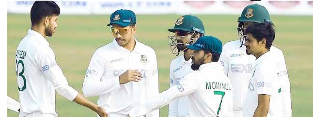
બાંગ્લાદેશ તા 12

પાકિસ્તાન અને બાંગ્લાદેશ વચ્ચે રમાશે બે ટેસ્ટ મેચ બાંગ્લાદેશ ક્રિકેટ બોર્ડે 15 સભ્યોની ટીમની જાહેરાત કરી તસ્કીન અહેમદની 15 સભ્યોની ટીમમાં વાપસી થઈ છે બાંગ્લાદેશ ક્રિકેટ બોર્ડે પાકિસ્તાન સામે 21 ઓગસ્ટથી રાવલપિંડીમાં શરૂ થનારી આગામી બે મેચની ટેસ્ટ સિરીઝ માટે ટીમની જાહેરાત કરી છે. તસ્કીન અહેમદની 15 સભ્યોની ટીમમાં વાપસી થઈ છે. તસ્કીન અહેમદે તેની છેલ્લી ટેસ્ટ મેચ જૂન 2023માં રમી હતી. ખભાની ઈજાને કારણે તેણે ટેસ્ટ ક્રિકેટમાંથી બ્રેક લીધો હતો. હાલમાં જ તેણે ટેસ્ટ ક્રિકેટમાં વાપસી કરવાની ઈચ્છા વ્યક્ત કરી છે. આ દરમિયાન તેણે બોર્ડને કહ્યું હતું કે તે ટેસ્ટ ક્રિકેટમાં રમી શકે છે. બાંગ્લાદેશની ટીમની