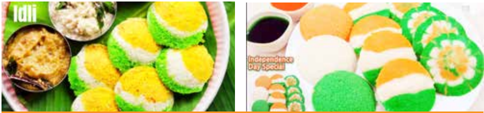
15મી ઓગસ્ટે તમે તિરંગા થીમમાં સ્વાદિષ્ટ ભાત બનાવી શકો

દેશભરમાં સ્વતંત્રતા દિવસની ઉજવણીની તૈયારીઓ શરૂ થઈ ગઈ છે. આ દિવસોમાં દેશભક્તિનો રંગ સર્વત્ર જોવા મળી રહ્યો છે. બજારમાં પણ તમે તિરંગાની થીમમાં કપડાં, પતંગ અને બીજી ઘણી વસ્તુઓ જોઈ શકો છો. સ્વતંત્રતા દિવસ શાળાઓ, ઓફિસો અને અન્ય તમામ જગ્યાએ ઉજવવામાં આવે છે. એ જ રીતે દેશભક્તિનો રંગ ભોજનમાં પણ જોવા મળે છે. આ દિવસોમાં બજારમાં કેસરી, સફેદ અને લીલા રંગમાં અનેક પ્રકારની વાનગીઓ ઉપલબ્ધ છે. જેને ટ્રાઈ કલર ડિશ પણ કહેવામાં આવે છે. તમે તેને ઘરે પણ બનાવી શકો છો. તમે ઘરે ટ્રાઈ કલરમાં કઈ વાનગી બનાવી શકો છો અને તમારા બાળકને પણ આ વાનગી ગમશે અને જો સ્વતંત્રતા દિવસ પર મહેમાનો આવશે તો તેમને પણ આ વાનગી ગમશે. 15મી ઓગસ્ટ તમે તિરંગા થીમમાં સ્વાદિષ્ટ ભાત બનાવી શકો છો. તમારે તેને નારંગી, સફેદ અને લીલા રંગના 3 સ્તરોમાં વહેંચવાનું છે. તેને બનાવવા માટે તમે ગાજર અને પાલકની પેસ્ટ પણ તૈયાર કરી શકો છો.