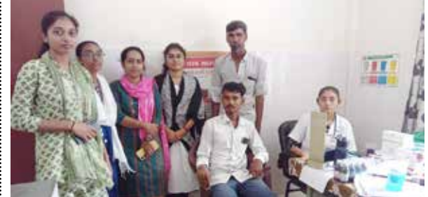
વિશાલ જે હરવરા : જામનગર

જામનગર જિલ્લામાં ચાલી રહેલા સ્વચ્છતા હી સેવા અભિયાન અંતર્ગત કાલાવડ તાલુકાની બેરાજા ગ્રામ પંચાયતના પ્રાથમિક આરોગ્ય કેન્દ્ર ખાતે સફાઈકર્મીઓ તથા તેમના પરિવારજનો માટે નિ:શુલ્ક હેલ્થ ચેક અપ કેમ્પનું આયોજન કરવામા આવ્યું હતું. તથા કેન્દ્રની આસપાસ સફાઈ કરી તમામ લોકો દ્વારા સ્વચ્છતા શપથ ગ્રહણ લેવામાં આવ્યા હતા.