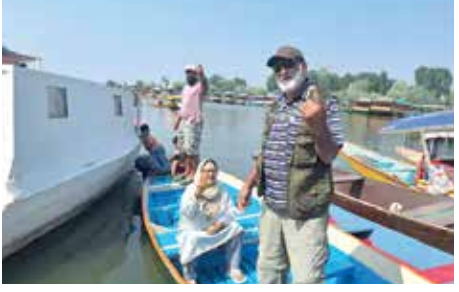
લોકો શિકારાટથી મતદાન કરવા આવ્યા

જમ્મુ-કાશ્મીર યૂટીસની બીજા તબક્કામાં 6 જિલ્લાની 26 વિધાનસભા બેઠકો મતદાન પૂર્ણ થઈ ગયું છે. જેમાં 25.78 લાખ મતદારોએ સવારે 7 વાગ્યાથી સાંજે 6 વાગ્યા સુધી મતદાન કર્યું. સાંજે 5 વાગ્યા સુધી 59.37 ટકા મતદાન થયું. સૌથી વધુ મતદાન રિયાસીમાં 71.81% છે, જ્યારે સૌથી ઓછું વૈશ્વોદેવીમાં 27.31% થયું.