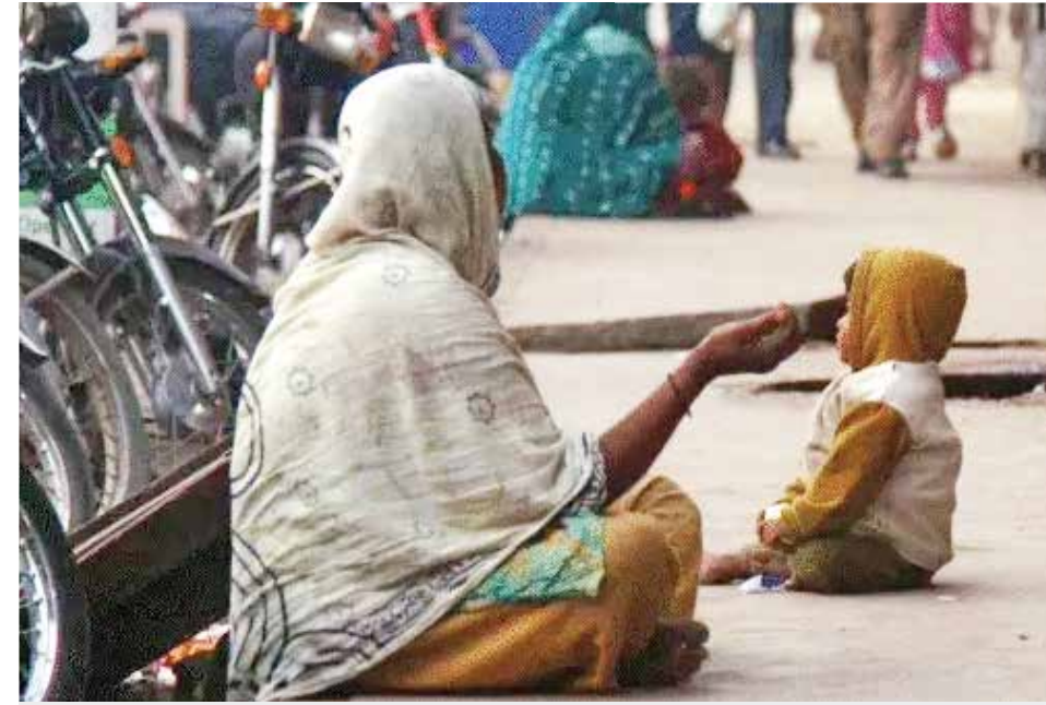
વિશ્વભરમાં ધરપકડ કરાયેલા 90% ભિખારીઓ પાકિસ્તાની મૂળના પાકિસ્તાની વેબસાઈટ ડોનના સપ્ટેમ્બર 2023ના અહેવાલ મુજબ, વિશ્વભરમાં ધરપકડ કરાયેલા 90% ભિખારીઓ પાકિસ્તાની મૂળના છે. યુએઈ સરકાર પણ આ ભિખારીઓની વધતી સંખ્યાથી પરેશાન છે. ડોનના ઓગસ્ટના અહેવાલ મુજબ, UAE એવા પાકિસ્તાનીઓને વિઝા આપવાનું ટાળે છે જેમના બેંક ખાતામાં પૂરતા પૈસા નથી.

એજન્સી (એફઆઈએ)ને આ અંગે કાર્યવાહી કરવાની જવાબદારી સોંપવામાં આવી છે. એ જ રીતે, ઓક્ટોબર 2023માં, ફ્લાઈટમાં સવાર 16 લોકોને લાહોર એરપોર્ટ પર પ્લેનમાંથી ઉતારવામાં આવ્યા હતા અને ધરપકડ કરવામાં આવી હતી. તેઓ ત્યાં ભીખ માંગવા પણ જતા હતા. ગયા વર્ષે પણ સાઉદી અરેબિયાએ ફરિયાદ કરી હતી ગયા વર્ષે સપ્ટેમ્બરમાં વિદેશી અધિકારીઓની બેઠકમાં સાઉદી અરેબિયાએ પાકિસ્તાનને હજ ક્વોટા આપવામાં સાવચેત રહેવા કહ્યું હતું. સાઉદી અધિકારીઓએ પાકિસ્તાનને ભિખારી અને પિકપોકેટ ન મોકલવા કહ્યું હતું. સાઉદી અરેબિયાએ કહ્યું હતું કે તેમની જેવો આવા લોકોથી ભરેલી છે. ત્યારે પણ પાકિસ્તાની અધિકારીઓએ તેને રોકવાની ખાતરી આપી હતી. વિશ્વભરમાં ધરપકડ કરાયેલા 90% ભિખારીઓ પાકિસ્તાની મૂળના પાકિસ્તાની વેબસાઈટ ડોનના સપ્ટેમ્બર 2023ના અહેવાલ મુજબ, વિશ્વભરમાં ધરપકડ કરાયેલા 90% ભિખારીઓ પાકિસ્તાની મૂળના છે. યુએઈ સરકાર પણ આ ભિખારીઓની વધતી સંખ્યાથી પરેશાન છે. ડોનના ઓગસ્ટના અહેવાલ મુજબ, UAE એવા પાકિસ્તાનીઓને વિઝા આપવાનું ટાળે છે જેમના બેંક ખાતામાં પૂરતા પૈસા નથી. આ વર્ષે માર્ચમાં, ઈસ્લામના પવિત્ર રમઝાન મહિના દરમિયાન, દુબઈ પ્રશાસને આ ભિખારીઓ વિરુદ્ધ અભિયાન શરૂ કર્યું હતું. આ દરમિયાન 200 થી વધુ લોકોની ધરપકડ કરવામાં આવી હતી. આમાં લગભગ અડધી વસતિ મહિલાઓની હતી.