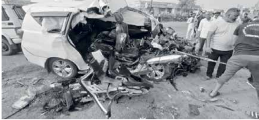
(એજન્સી) અમદાવાદ | તા.25

બુધવારનો દિવસ 7 અમદાવાદીઓ માટે ગમખવાર બનીને આવ્યો. વહેલી સવારે રોડ અકસ્માતમાં 7 લોકોના કમકમાટી ભર્યા મોત થયા. શામળાજીથી પરત આવી રહેલી ઈનોવા કાર ટ્રેલર પાછળ ઘુસી ગઈ અને કચ્છરવાણ વળી ગઈ. સાબરકાંઠા જિલ્લાના હિંમતનગર પાસે આજે વહેલી સવારે ગમખવાર અકસ્માત સર્જાયો હતો. હાઈવે પર એક કાર ટ્રેલરના પાછળના ભાગમાં ઘુસી જતાં 7 લોકોના ઘટનાસ્થળે જ મૃત્યુ નીપજ્યા હતા. જ્યારે અન્ય એકની હાલત પણ ગંભીર છે.