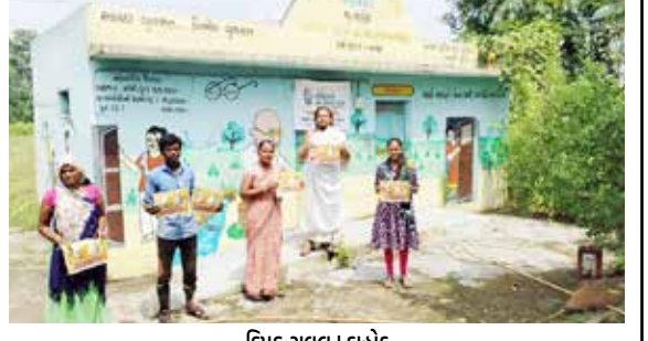
ફિલ્ક રાવલ | દાહોદ

સ્વચ્છતા હી સેવા અભિયાનને સાકાર કરવાના માટે છેવાડાના લોકો સ્વચ્છતાનું મહત્વ સમજતા થાય તે માટે રાજ્ય સરકાર દ્વારા અનેકવિધ આયોજનો કરવામાં આવી રહ્યા છે. દાહોદ જિલ્લામાં પણ સ્વચ્છતા હી સેવા અભિયાનમાં વધુને વધુ લોકો જોડાય તે માટે રોજ-બ-રોજ અલગ અલગ આયોજનો કરવામાં આવી રહ્યા છે. દાહોદ જિલ્લાના લીમખેડા તાલુકામાં પણ સ્વચ્છતા અભિયાનને વેગ આપવા ગ્રામીણ લોકો પણ સ્વચ્છતાની મહત્વતા સમજે અને એક જાગૃત અને સમજદાર નાગરિક બને એ માટે લીમખેડા તાલુકાના પાણીયા ગામમાં સામુહિક શૌચાલય અને મંદિરની સાહ-સફાઈ કરવામાં આવી હતી તેમજ લોકોને સ્વચ્છતા વિશે સમજણ આપવામાં આવી હતી. અને IEC નું વિતરણ કરવામાં આવ્યું હતું.