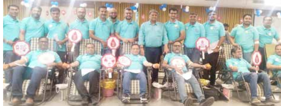
(એજન્સી) અમદાવાદ 1 તા. 25

વટવા ઇન્સ્ટ્રીઝ એસોસિયેશન અને ઈન્ડિયન રેડક્રોસ સોસાયટી, અમદાવાદના સંયુક્ત ઉપક્રમે પોતાની સામાજિક જવાબદારીના ભાગરૂપે મહા રક્તદાન શિબિર યોજાઈ હતી, જેમાં 1500થી વધારે બ્લડ યુનિટ થેલેસેમિયા મેજર બાળકો તેમજ અન્ય જરૂરિયાતમંદ દર્દીઓ માટે એકત્રિત થયું છે. ઉલ્લેખનીય છે કે આ પ્રકારના કેમ્પનું આયોજન વટવા ઇન્સ્ટ્રીઝ એસોસિયેશન દર વર્ષે કરતું આવ્યું છે અને તેમાં ઉત્તરોત્તર બ્લડ યુનિટ ના કલેક્શનમાં સતત વધારો થતો જાય છે.