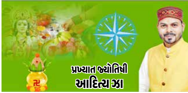
પ્રખ્યાત જ્યોતિષી આદિત્ય ઝા

આ વર્ષે નવરાત્રી 3જી ઓક્ટોબરથી શરૂ થઈ રહી છે. નવરાત્રિ દરમિયાન લોકો પોતાના ઘરમાં કલશની સ્થાપના કરે છે. નવરાત્રીના નવ દિવસો દરમિયાન દેવી દુર્ગાની પૂજા કરવામાં આવે છે. પુરાણોમાં કલશને ભગવાન વિષ્ણુના પ્રતીક તરીકે વર્ણવવામાં આવ્યા છે. નવરાત્રિના નવ દિવસ સુધી કલશની પૂજા કરવાથી ભગવાન વિષ્ણુની કૃપા પ્રાપ્ત થાય છે. ચાલો જાણીએ પ્રખ્યાત જ્યોતિષી આદિત્ય ઝા પાસેથી નવરાત્રિ દરમિયાન પૂજા કરવાની વાસ્તુ પદ્ધતિઓ વિશે. આ ઉપાયથી જીવનમાં એટલી સમૃદ્ધિ વધે છે કે તેની કલ્પના પણ કરી શકાતી નથી.