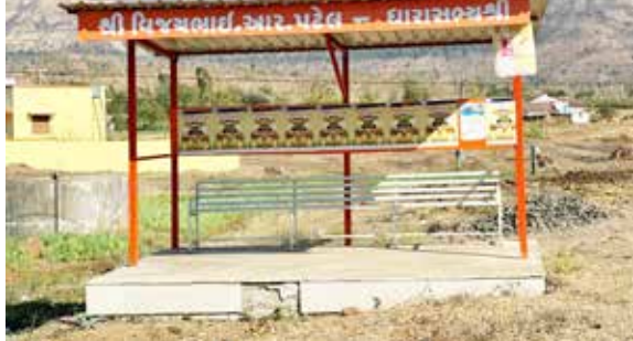
સુશીલ પવાર : ડાંમ

ડાંમ જિલ્લાના આંતરિયાળ વિસ્તારોમાં આદિવાસી જનતાને એસટી સેવાનો લાભ મળે અને તાલ વરસાદથી બચાવ થાય તે હેતુથી ડાંમ જિલ્લા આયોજન વિભાગ દ્વારા ધારાસભ્યની ભેડોળથી રેલ્વે લાઈનો રૂપિયાના ખર્ચે પીકઅપ સ્ટેન્ડ બનાવવામાં આવ્યા છે. પરંતુ અંદાજે 3 લાખના માત્રભર ખર્ચે નિર્માણ થયેલ પીકઅપ સ્ટેન્ડમાં ઈજારદારે સરકારી ધારાધોરણનો ઈદ ઉડાડી તકલાદી પીકઅપ સ્ટેન્ડ નિર્માણ કરતા ધારાસભ્યની ટર્મ પુરી થાય તે પહેલા જ સ્ટેન્ડની લાદી સહીત કોંક્રિટ ઉખડી જતા સૌનો સાથ સૌનો વિકાસમાં ભ્રષ્ટાચારની ગંધ ઉઠવા પામી છે. ડાંમ જિલ્લામાં 3-3 લાખના ખર્ચે ઠેકેર બનેલ પીકઅપ સ્ટેન્ડમાં ઈજારદાર દ્વારા ધારાધોરણ વિનાનું મટીરીયલ અને તકલાદી ભાંડાકામ કરી સરકારી નાણાનો પુકાડો કર્યો હોવાનું સ્પષ્ટ જણાઈ રહ્યું છે. ત્યારે સમગ્ર બાબતે એક જાગૃત નાગરિક દ્વારા તહેદરી આયોગમાં લેખિત ફરિયાદ કરી તપાસની માંગ કરવા તજવીજ હાથ ધરી હોવાનું જાણવા મળ્યું છે. ત્યારે આમ નાગરિકની પરસેવાની કમાણીના ટેક્સ પેટે વસુલતા નાણાનો આદિવાસી જનતાને સુવિધાઓ ઉભી કરવા તકલાદી પીકઅપ બનાવનાર ઈજારદાર અને સંબંધિત અધિકારીઓ સામે શિક્ષાત્મક પગલા ભરવામાં આવે તેવી માંગ ઉઠી છે.