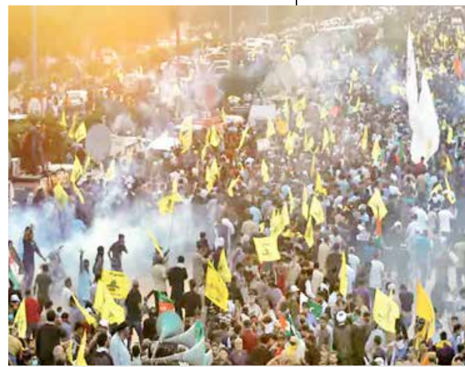
નસરલ્લાહ પર હુમલાના અહેવાલ મુજબ, આ હુમલો કરનાર એફ-15આઈ જેટની 69મી સ્ક્વોડ્રનના કમાન્ડર લેફ્ટનન્ટ કર્નલ એમ ઘણા દિવસોથી હુમલાની તૈયારી કરી રહ્યા હતા. જો કે તેને ટાર્ગેટ વિશે થોડા કલાક પહેલા જ જાણ કરવામાં આવી હતી.