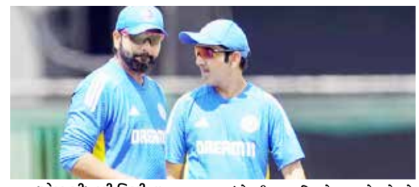
(એજન્સી)નવી દિલ્હી તા 17

મેચ પહેલા 14 ઓક્ટોબરના રોજ ગંભીરે પ્રેસ કોન્ફરન્સ કરી અને કઈક એવું કહ્યું જે હિટમેનને ખટકી ગયું. રોહિત શર્માએ તે અંગે બીજા જ દિવસે 15 ઓક્ટોબરે જવાબ આપી દીધો. ભારત અને ન્યૂઝીલેન્ડ વચ્ચે આજથી ટેસ્ટ સિરીઝની શરૂઆત થઈ છે. જો કે વરસાદે રંગમાં ભંગ પાડતા પ્રથમ સેશન વિત્યો છતાં હજુ સુધી ટોસ પણ થઈ શક્યો નથી. આ બધા વચ્ચે રોહિત અને ગંભીર વચ્ચે પ્રેસ કોન્ફરન્સ બાદ મતભેદની અટકળો થઈ રહી છે. મેચ પહેલા 14 ઓક્ટોબરના રોજ ગંભીરે પ્રેસ કોન્ફરન્સ કરી અને કઈક એવું કહ્યું જે હિટમેનને ખટકી ગયું. રોહિત શર્માએ તે