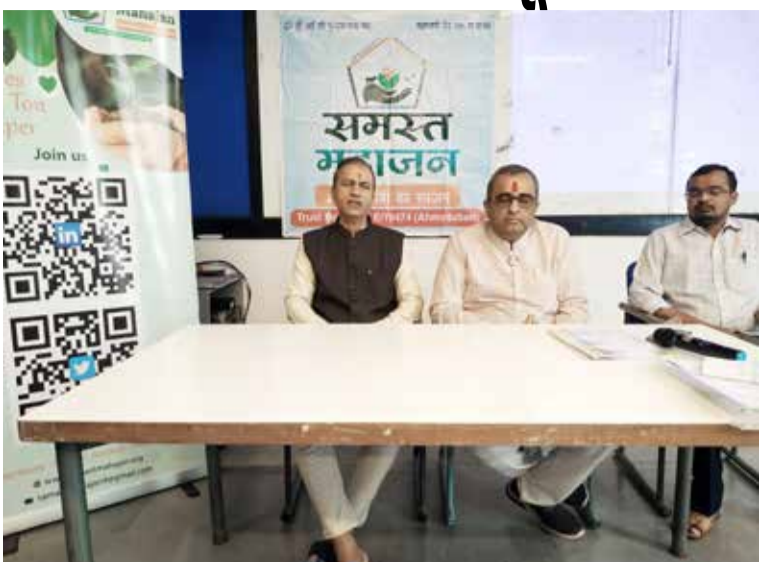
અંતર્ગત વૃક્ષારોપણ કરવામાં આવશે અને એનીમલ હેલ્થલાઈન, રાજકોટની એનિમલ એમ્બ્યુલન્સનું લોકાર્પણ સહિતના કાર્યો યોજાશે.

સમસ્ત મહાજન દ્વારા શ્રી વિરમગામ ખોડાદોર પાંજરાપોળ સંસ્થા ખાતે ગુજરાતનાં જીવદયા પ્રેમી મુખ્યમંત્રી શ્રી ભુપેન્દ્રભાઈ પટેલનું અભિવાદન કરાશે અમદાવાદ શ્રી વિરમગામ ખોડાદોર પાંજરાપોળ સંસ્થા ખાતે ગુજરાત રાજ્યનાં જીવદયા પ્રેમી મુખ્યમંત્રી શ્રી ભુપેન્દ્રભાઈ પટેલનું ગૌમાતા પોષણ યોજના તેમજ અન્ય જીવદયાનાં નિર્ણયો લેવા બદલ સમસ્ત મહાજન તથા સમગ્ર ગુજરાતની જીવદયા/ગૌસેવા સંસ્થાઓ તરફથી અભિવાદન કરવામાં આવી રહ્યું છે. આ કાર્યક્રમ 20 ઓક્ટોબર, 2024ને રવિવારનાં રોજ બપોરે ૩૬લાકથી શ્રી વિરમગામ ખોડાદોર પાંજરાપોળ સંસ્થા ખાતે યોજાશે. આ કાર્યક્રમમાં ગુજરાત રાજ્યના જીવદયા પ્રેમી અને સંવેદનશીલ મુખ્યમંત્રી શ્રી ભુપેન્દ્રભાઈ પટેલ સમગ્ર ગુજરાતની જીવદયા/ગૌસેવા સંસ્થાઓને માર્ગદર્શન આપશે તેમજ મુખ્યમંત્રી ભુપેન્દ્રભાઈ પટેલનાં વરદ હસ્તે ઓગણ વિડામાં નૂતન શેડનું ઓનલાઈન ખાતમુહૂર્ત, ગૌપૂજન, તેમજ સમસ્ત મહાજન દ્વારા તૈયાર કરવામાં આવેલા નવા તળાવોનું લોકાર્પણ તથા તકતી અનાવરણ કરવામાં આવશે. ભારતનાં દીર્ઘકાળ વડાપ્રધાન શ્રી નરેન્દ્ર મોદીના "એક વૃક્ષ મા કે નામ" સૂત્ર