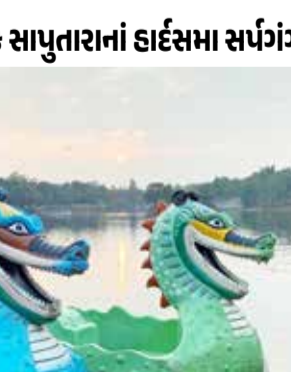
સુશીલ પવાર.ડાંગ ડાંગ જિલ્લામાં ગિરિમથક સાપુતારા ખાતે ગુરુવારે વરસાદી માહોલે વિરામ લીધો હતો. વરસાદી માહોલે વિરામ લેતા સર્પગંગા તળાવ ખાતે સમી સાંજે નયન રમ્ય દ્રશ્યો સર્જાયા હતા. ગિરિમથક સાપુતારાએ વરસાદી માહોલમાં વિરામ બાદ પોતાનું કુદરતી સૌંદર્ય ફરી એકવાર પ્રદર્શિત કર્યું છે. ગુરુવારથી ડાંગ જિલ્લામાં વરસાદી માહોલે વિરામ લીધો છે. ત્યારે સાપુતારાના સર્પગંગા તળાવનો સંજોનો નજારો આહલાદક બનતો જોવા મળ્યો. સર્પગંગા તળાવમાં સમી સાંજે સૂર્યાસ્ત વખતે તળાવમાં પડતા સૂર્યના કિરણોએ આકાશ અને

પાણીને એકદમ અલૌકિક રંગોમાં રંગી દીધું હતું. જોકે, હાલમાં બોટિંગની પ્રવૃત્તિ બંધ હોવાથી પ્રવાસીઓ તળાવના કિનારેથી જ આ નજારો માણતા જોવા મળ્યા હતા. સાપુતારા ખાતે આવતા પ્રવાસીઓ માટે સર્પગંગા તળાવ એક મુખ્ય આકર્ષણ છે. વરસાદ બાદ તળાવની આસપાસનું વાતાવરણ ઠંડું અને આનંદદાયક બની ગયું હતું. તેમજ સાપુતારા ખાતેના સર્પગંગા તળાવમાં સમી સાંજે સૂર્યાસ્ત વ