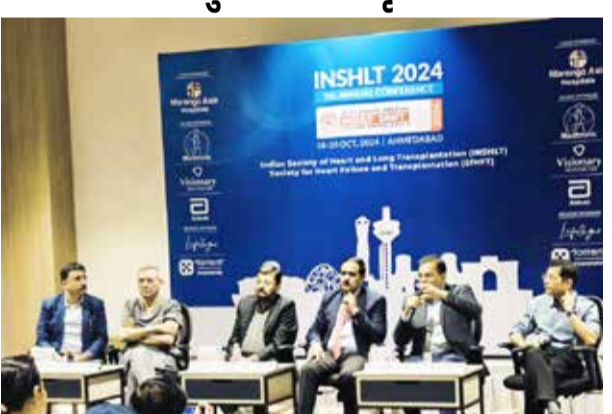
કેનેડા, બેલ્જિયમ, યુકે, જાપાન અને અન્ય ઘણા દેશોના અગ્રણી સર્જનો હાજરી આપશે. આ આપવામાં આવશે અને તે અંગેના વ્યાખ્યાનો, પેનલ ચર્ચાઓ અને કેસ સ્ટડીનો પણ સમાવેશ થાય છે. આ કોન્ફરન્સમાં મુખ્ય ચર્ચાઓ આવા અંગોના ઓછા ઘટાઓ, ટ્રાન્સપ્લાન્ટ કરવા ઈચ્છતા દર્દીઓની સંખ્યા અને ટ્રાન્સપ્લાન્ટ પછીની આરોગ્ય સંભાળ જેવા જટિલ પડકારો અંગે ઉકેલ મેળવવા માટે ચર્ચા કરવામાં આવશે, અને ટ્રાન્સપ્લાન્ટના સફળ પરિણામો મળે તેવી અદ્યતન તકનીકોની શોધ અંગે પણ ચર્ચા કરવામાં આવશે. આ વાર્તાલાપ ભવિષ્ય માટે એક માર્ગ નક્કી કરશે, જે દેશભરમાં ટ્રાન્સપ્લાન્ટ કાર્યક્રમોની સતત વૃદ્ધિ અને સફળતા માટેનો આધાર બનશે. આ કોન્ફરન્સનું અન્ય મહત્વનું પાસું ઓર્ગન ડોનેશન અવેરનેસ (અંગદાન અંગે જાગૃતિ) રહેશે. રવિવાર, 20 ઓક્ટોબર, 2024 ના રોજ એક સમર્પિત મીટિંગમાં આયોજન કરવામાં આવશે, જેમાં સરકારી અધિકારીઓ, મેડિકલ કોલેજો અને CHC ના પ્રતિનિધિઓ સમગ્ર ગુજરાતમાં અંગ દાનના દરમાં સુધારો કરવા માટેની વ્યૂહરચનાઓની ચર્ચા કરશે.

ઈન્ડિયન સોસાયટી ઓફ હાર્ટ એન્ડ લંગ ટ્રાન્સપ્લાન્ટેશન (INSHLT) ની 5મી વાર્ષિક કોન્ફરન્સ, સોસાયટી ફોર હાર્ટ ફેલ્યોર એન્ડ ટ્રાન્સપ્લાન્ટેશન (SHFT) ના સહયોગથી 18-20 ઓક્ટોબર 2024 દરમિયાન, અમદાવાદમાં કલબ બેબીલોન અને શેરોટોન કન્વેન્શન સેન્ટર ખાતે આયોજિત કરવામાં આવી છે. હાર્ટ અને લંગ ટ્રાન્સપ્લાન્ટેશન વિષય પર ભારતની આ સૌથી મોટી કોન્ફરન્સ છે, અને આ ઈવેન્ટમાં વિશ્વભરના ટોચના સર્જનો અને નિષ્ણાતો આ રોગમાં નવીનતમ પ્રગતિની ચર્ચા કરવા, તેના મુખ્ય પડકારોનો ઉકેલ મેળવવા અને ટ્રાન્સપ્લાન્ટ મેડિસિનના ભાવિ અંગે ચર્ચા કરવા માટે એકત્રિત થશે. આ કોન્ફરન્સમાં હૃદય અને ફેફસાના પ્રત્યારોપણના આંતરરાષ્ટ્રીય નિષ્ણાતો, જેમ કે, યુએસએ,