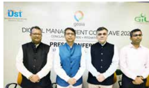
KPO કંપની, શ્રેષ્ઠ ડિજિટલ માર્કેટિંગ કંપની, શ્રેષ્ઠ સોફ્ટવેર ડેવલપમેન્ટ કંપની, શ્રેષ્ઠ IoT પ્રોડક્ટ સોલ્યુશન, શ્રેષ્ઠ AR-VR પ્રોડક્ટ સોલ્યુશન, શ્રેષ્ઠ બ્લોકચેન પ્રોડક્ટ સોલ્યુશન, શ્રેષ્ઠ બિગ ડેટા પ્રોડક્ટ સોલ્યુશન, શ્રેષ્ઠ AI/ML પ્રોડક્ટ સોલ્યુશન, શ્રેષ્ઠ SaaS ઉત્પાદન ઉકેલ, શ્રેષ્ઠ ક્લિનિકલ પ્રોડક્ટ સોલ્યુશન, શ્રેષ્ઠ ગેમિંગ પ્રોડક્ટ સોલ્યુશન વગેરે કેટેગરીમાં એવોર્ડ એનાયત કરવામાં આવશે. આ ઈવેન્ટમાં નોલેજ-શેરિંગ સેશન્સ અને પાસ કરીને નોન-આઈટી ઉદ્યોગો અને એક્ઝેક્યુટિવ-કેન્દ્રિત આઈટી ઈન્ફ્રાસ્ટ્રક્ચર ક્ષેત્રોના નેતાઓ માટે રચાયેલ ચર્ચાઓનો સમાવેશ થશે. તે ગુજરાત ક્ષેત્રના નવીન IT વ્યવસાયો અને સ્ટાર્ટ-અપ્સની સહભાગિતાને પણ દર્શાવશે.

એરોપ્લાન, જાહેર ક્ષેત્ર શ્રેષ્ઠ ડિજિટલ ટ્રાન્સફોર્મેશન એરોપ્લાન, શિક્ષણ ક્ષેત્ર શ્રેષ્ઠ ડિજિટલ ટ્રાન્સફોર્મેશન એરોપ્લાન, શ્રેષ્ઠ ઈન્ફ્રાસ્ટ્રક્ચર મેનેજર સર્વિસ પ્રોવાઈડર (સોફ્ટવેર), શ્રેષ્ઠ સિસ્ટમ ઈન્ટિગ્રેટર કંપની (હાર્ડવેર), શ્રેષ્ઠ ઈલેક્ટ્રોનિક્સ ઉદ્યોગ કંપની, શ્રેષ્ઠ BPO અથવા