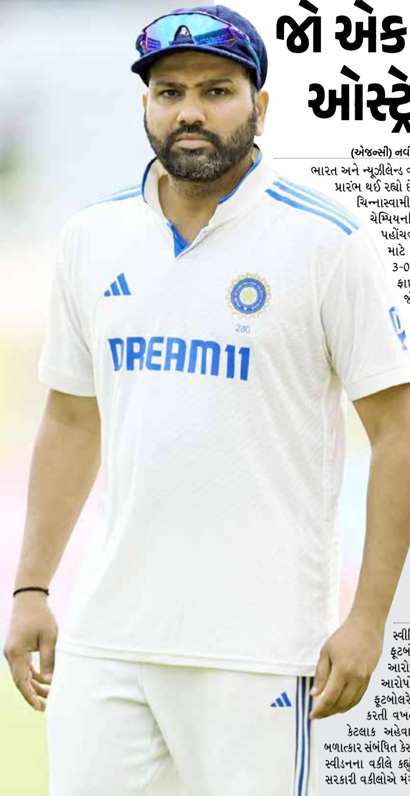
(એજન્સી) નવી દિલ્હી તા 17

ભારત અને ન્યૂઝીલેન્ડ વચ્ચે આજથી 3 ટેસ્ટ સિરીઝનો પ્રારંભ થઈ રહ્યો છે. પહેલી મેચ બેંગલુરુના એમ ચિન્નાસ્વામી સ્ટેડિયમમાં રમાશે. વર્લ્ડ ટેસ્ટ ચેમ્પિયનશિપ (WTC)ની ફાઇનલમાં પહોંચવા માટે આ સિરીઝ બંને ટીમ માટે મહત્વપૂર્ણ છે. જો ભારત 3-0થી જીતે છે તો ટીમનું WTC ફાઇનલ નિશ્ચિત થઈ જશે. જોકે જો પ્રથમ ટેસ્ટ વરસાદના કારણે ડ્રો થાય છે તો ભારતે ઓસ્ટ્રેલિયામાં ફરી ટેસ્ટ જીતવી પડશે. બાંગ્લાદેશને ઘરમાં જીતીને WTC ફાઇનલમાં 2-0થી હરાવવા બાદ ટીમ ઈન્ડિયા વર્લ્ડ ટેસ્ટ ચેમ્પિયનશિપ (WTC) ના પોઈન્ટ ટેબલમાં ટોચ પર છે. ટીમ 2023 WTC સાર્કલમાં એકપણ ટેસ્ટ સિરીઝ ગુમાવી નથી. ભારત સાઉથ આફ્રિકા અને ઈંગ્લેન્ડ સામે 1-1 મેચ