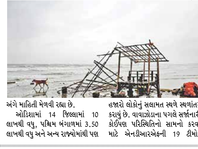
અંગે માહિતી મેળવી રહ્યા છે. ઓડિશામાં 14 જિલ્લામાં 10 લાખથી વધુ, પશ્ચિમ બંગાળમાં 3.50 લાખથી વધુ અને અન્ય રાજ્યોમાંથી પણ

વરસાદ ખાબક્યો હતો. ભારે પવન સાથે વરસાદ પણ જોરદાર પડી રહ્યું છે. વાવાઝોડું દાના ઓડિશામાં પ્રતિ કલાક 120 કિ.મી.ની ઝડપે ભિતરકનિકા નેશનલ પાર્ક અને ધામરા પોર્ટના દરિયા કિનારાના વિસ્તારમાં ટકરાયું હતું. આ સમયે સમુદ્રના મોજા બે મીટર ઊંચા ઉછળ્યા હતા. વાવાઝોડાના કારણે ઓડિશામાં ભારે વરસાદ પડ્યો હતો. ઓડિશાના મુખ્યમંત્રી મોહન ચરણ માંઝીએ કહ્યું હતું કે, તેમની સરકાર 'ઝીરો કેન્ડિડિટી' માટે કટિબદ્ધ છે. આ માટે દરેક પ્રકારની વ્યવસ્થા કરી દેવાઈ છે. પીએમ મોદી સતત વાવાઝોડા દાના