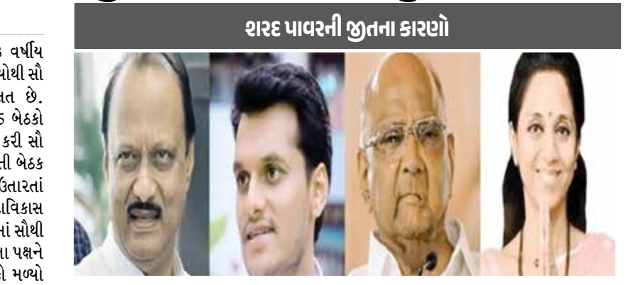
શરદ પવારની જીતના કારણો

(એજન્સી) નવી દિલ્હી | તા 25 મહારાષ્ટ્રમાં વિપક્ષના ચાણક્ય 83 વર્ષીય શરદ પવાર રાજકારણમાં પોતાના નિર્ણયોથી સૌ કોઈને અચંબામાં મુકવા માટે પ્રચલિત છે. ગઈકાલે શરદપવારની એનસીપીએ 45 બેઠકો પર પોતાના ઉમેદવારોની યાદી જાહેર કરી સૌ કોઈને ચોંકાવી દીધા છે. તેમાંય ભારાતની બેઠક પર કાકા અજિત પવાર સામે ભત્રીજાને ઉતારતાં અજિતનું ટેન્શન વધાર્યું છે.મહાવિકાસ અઘાડીની બેઠક ફાળવણીમાં ત્રણેય પક્ષમાં સૌથી ઓછો જનાધાર હોવા છતાં શરદ પવારના પક્ષને સમાન બેઠકો પર ચૂંટણી લડવાનો મોકો મળ્યો છે. રાજકારણમાં સૌ કોઈ ચર્ચા કરી રહ્યા છે કે, પવારે એવી કઈ શરત મૂકી કે જેનાથી અન્ય બે પક્ષ સમાન બેઠકો આપવા રાજી થયા? ગઠબંધનમાં 85 બેઠકો પર ઉમેદવારો ઉતારનારા શરદ પવારની નજર મુખ્યમંત્રીની ખુરશી પર હોવાની ચર્ચાએ જોર પકડ્યું છે. મહારાષ્ટ્ર લોકસભા ચૂંટણીમાં શરદ પવારના એનસીપી પક્ષની જીતનો સ્ટ્રાઈક રેટ સૌથી વધુ હોવાથી વિધાનસભા બેઠકમાં પણ તેમને વધુ બેઠકો મળી હોવાનો અંદાજ છે.