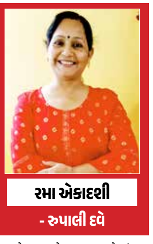
રમા એકાદશી - રૂપાલી દવે

દિવાળી ના પર્વ ના પ્રથમ દિવસે આવતી રમાં એકાદશી ત્રત ની કથા: પૂર્વે રાજા મુચકુંદ એ ધર્મ પ્રિય, સત્યવાદી ભગવાન વિષ્ણુ નો પ્રિય ભક્ત હતો. રાજા મુચકુંદ ના વરુણ, વિભીષણ, ઈન્દ્ર, કુંબેર વગેરે મિત્રો હતા. રાજા મુચકુંદ એ યુગો સુધી ઈન્દ્ર ના સેનાપતિ બની ને દાનવો થી ઈન્દ્રાસન રક્ષિત કર્યું હતું. એક સમયે રાજા મુચકુંદ ને ઈન્દ્ર એ આરામ કરવાની આજ્ઞા આપીને પાર્વતી પુત્ર કાતિકેય ની સાથે પોતાની