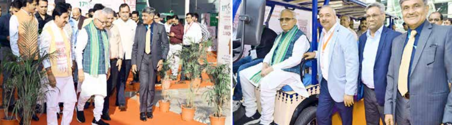
(એજન્સી) ગાંધીનગર । તા. 27

ગાંધીનગરમાં યુએમઆઈ-2024 કોન્ફરન્સના સમાપન સમારંભમાં વિવિધ કેટેગરીમાં એનાયત એવોર્ડ્સમાં, 2 એવોર્ડ્સ ગાંધીનગર અને સુરતના ફાળે