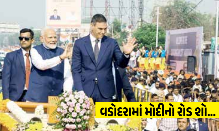
વડોદરામાં મોદીનો રોડ શો...

(એજન્સી) વડોદરા । તા. 28 વડોદરા ગુજરાતનું સાંસ્કૃતિક પાટનગર તો છે જ અને ભવિષ્યમાં તે એવિએશન મેન્યુફેક્ચરિંગ એટલે કે વિમાનો બનાવવાનું હબ બનાવવાનું છે તેમ વડાપ્રધાન નરેન્દ્ર મોદીએ આજે વડોદરામાં ટાટા-એરબસના સી-૨૮૫ વિમાનો બનાવવા માટેના એરક્રાફ્ટ કોમ્પ્લેક્સના ઉદઘાટન સમારોહમાં કહ્યું હતું. આ એરક્રાફ્ટ કોમ્પ્લેક્સનું પીએમ મોદી અને સ્પેનના વડાપ્રધાન પેડ્રો સાન્ચેઝના હસ્તે ઉદઘાટન થયું હતું. એ પછી આમંત્રિતોને સંબોધન કરતા પીએમ મોદીએ કહ્યું હતું કે, સી-૨૮૫ એરક્રાફ્ટ બનાવવાની કેક્ટરી ભારતના નવા વર્ક કલ્ચરનું પ્રતિબિંબ છે. બે વર્ષમાં આ પ્લાન્ટ બનીને તૈયાર છે. કોઈ પણ પ્રોજેક્ટના પ્લાનિંગમાં અને તેના અમલમાં બિન જરૂરી વિલંબ ના થવો જોઈએ તેવું મારું માનવું રહ્યું છે. વડોદરામાં રેલવે કોચ બનાવવાની કેક્ટરી પણ આ જ રીતે રેકોર્ડ બ્રેક સમયમાં ઉભી થઈ હતી અને ત્યાં બનતા કોચની વિદેશમાં આયાત થાય છે.