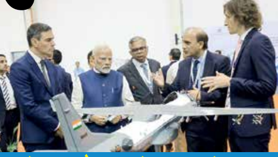
વડોદરામાં તૈયાર થશે C-295 એરક્રાફ્ટ

પીએમ મોદીએ ગુજરાતના જાણીતા સાહિત્યકાર ફાધર વાલેસનો ઉલ્લેખ કરતા કહ્યું હતું કે, ૭૫ વર્ષ પહેલા સ્પેનથી આવેલા ફાધર કાર્લોસ ગુજરાતમાં વસ્યા હતા. તેમણે પોતાના કાર્યોથી ગુજરાતને સમૃદ્ધ કર્યું હતું. તેમના યોગદાનનું ભારતે પદ્મશ્રી એવોર્ડથી નવાજીને સન્માન કર્યું હતું. ગુજરાતના લોકો તેમને ફાધર વાલેસ તરીકે ઓળખતા હતા. તેમના પુસ્તકો ગુજરાતને તેમણે આપેલી વિરાસતનું ઉદાહરણ છે.