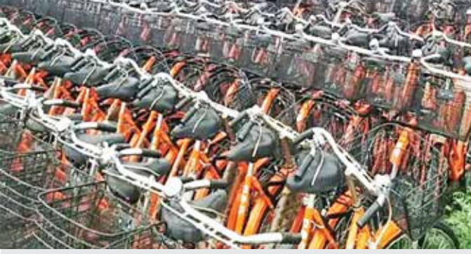
ગત વર્ષની બાકી રહેલી 1052 આવી પણ હજુ 9198 સાયકલ સહાય ચુકવવાની બાકી

સરકાર દ્વારા પો.૯ની વિદ્યાર્થીનીઓ માટે સરસ્વતી સાધના સાયકલ સહાય યોજના અમલમાં મુકી છે જેનો કોન્ટ્રાક્ટ પણ સરકારી એજન્સીને જ આપાયો છે તેમ છતાં ચાલુ વર્ષે અડધું સત્ર પૂર્ણ થયું હોવા છતાં જિલ્લામાં આ વર્ષની એકપણ સાયકલ સહાય ચુકવાઈ નથી. જ્યારે તાજેતરમાં આવેલ ૧૦૫૨ સાયકલ પણ ગત વર્ષની બાકીની અપાઈ છે.