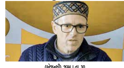
(એજન્સી) જમ્મુ । તા. 30

જમ્મુ-કાશ્મીરના બાંદીપોરા જિલ્લાના મુખ્યમંત્રી ઓમર અબ્દુલ્લાના ધારાસભ્યની રેલીમાં ભારે ધમાલ મચી છે. ટોળાએ રેલીમાં ડુમલો કરતા સ્થિતિ તંગ બની છે, જેમાં અનેક લોકો ઈજાગ્રસ્ત થયા છે. આ દરમિયાન અનેક વાહનોને પણ નુકસાન થયું છે. ઘટનાની જાણ થતાં પોલીસ અધિકારીઓએ સ્થળ પર દોડી આવીને કાર્યવાહી કરી છે. પોલીસે સ્થિતિને કાબુ કરવા માટે ટોળા પર ટિયર ગેસના શેલ છોડ્યા છે. બીજી તરફ નેશનલ કોન્ફરન્સે ડુમલા પાછળ ભાજપનો હાથ ધોવાનો આક્ષેપ કર્યો છે.