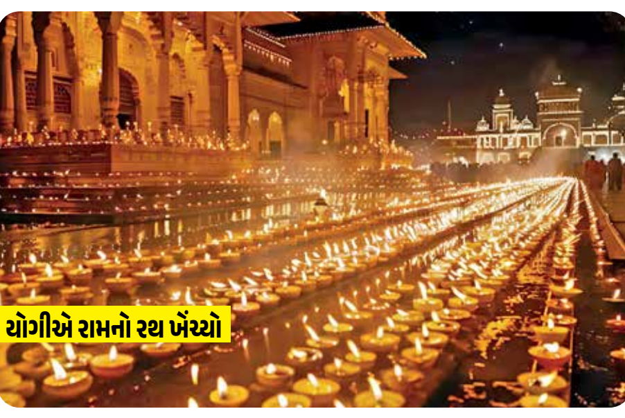
યોગીએ રામનો રથ ખેંચ્યો

(એજન્સી) અયોધ્યા । તા. 30 વિાળીના એક દિવસ પહેલા રામનગરી અયોધ્યા દીવાઓથી ઝળહળી ઊઠી. સરયુ નદીના 55 ઘાટ પર 28 લાખ દીવા પ્રગટાવવામાં આવ્યા. આ સાથે એક નવો રેકોર્ડ સર્જાયો છે. ગયા વર્ષે 22 લાખ દીવા પ્રગટાવવામાં આવ્યા હતા. સીએમ યોગીએ રામ મંદિરમાં પહેલો દીપ પ્રગટાવીને દીપોત્સવનું ઉદ્ઘાટન કર્યું. 1600 અર્ચકોએ સરયુ આરતી કરી. અગાઉ ભગવાન રામ સીતા અને લક્ષ્મણ સાથે પુષ્ક વિમાન દ્વારા પહોંચ્યા. યોગીએ તેમનું સ્વાગત કર્યું. ભગવાન રથ પર સવાર થયા. યોગીએ રામનો રથ ખેંચ્યો. ભગવાન રામને રામકથા પાર્કમાં લાવવામાં આવ્યા હતા.