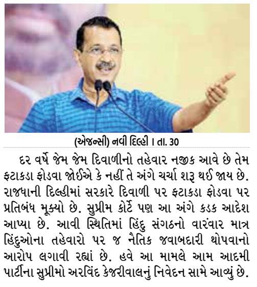
(એજન્સી) નવી દિલ્હી । તા. 30

દર વર્ષે જેમ જેમ દિવાળીનો તહેવાર નજીક આવે છે તેમ ફટાકડા ફોડવા જોઈએ કે નહીં તે અંગે ચર્ચા શરૂ થઈ જાય છે. રાજધાની દિલ્હીમાં સરકારે દિવાળી પર ફટાકડા ફોડવા પર પ્રતિબંધ મૂક્યો છે. સુપ્રીમ કોર્ટ પણ આ અંગે કડક આદેશ આપ્યો છે. આવી સ્થિતિમાં હિંદુ સંગઠનો વારંવાર માત્ર હિંદુઓના તહેવારો પર જ નૈતિક જવાબદારી ધોપવાનો આરોપ લગાવી રહ્યાં છે. હવે આ મામલે આમ આદમી પાર્ટીના સુપ્રીમો અરવિંદ કેજરીવાલનું નિવેદન સામે આવ્યું છે.