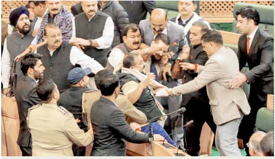
6 નવેમ્બરે વિધાનસભામાં કલમ 370 પુનઃસ્થાપિત કરવાનો પ્રસ્તાવ પસાર કરવામાં આવ્યો હતો

જમ્મુ કાશ્મીર વિધાનસભામાં ગુરુવારે જોરદાર બબલ થઈ. વિધાનસભામાં પક્ષ અને વિપક્ષના ધારસભ્યો સામ-સામે બાખડી પડ્યા હતા. આ હોબાળો કલમ 370 ની વાપસીના પ્રસ્તાવ મુદ્દે થયો હતો.