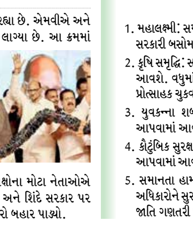
મહારાષ્ટ્ર સ્વામિમાન સભાનું આયોજન કર્યું હતું. ગઠબંધનમાં સામેલ તમામ પક્ષોના મોટા નેતાઓએ તેમાં ભાગ લીધો હતો. રાહુલ ગાંધીએ મંચ પરથી ખુલ્લેઆમ ભાજપ અને શિંદે સરકાર પર નિશાન સાધ્યું. દરમિયાન MVA ના નેતાઓએ ચૂંટણી માટે તેમનો દહેરો બહાર પાડ્યો.

મહારાષ્ટ્ર વિધાનસભાની ચૂંટણીને હવે ગણતરીના દિવસો જ બાકી રહ્યા છે. એમવીએ અને મહાયુતિમાં સીટની વહેંચણી બાદ હવે ચૂંટણી વચનો પણ જારી થવા લાગ્યા છે. આ ક્રમમાં MVA એ બુધવારે તેની પાંચ ગેરંટી જારી કરી. જેમાં મહિલાઓને દર મહિને આર્થિક સહાય, ખેડૂતો માટે લોન માફી, બેરોજગારોને આર્થિક સહાય, પરિવારો માટે સ્વાસ્થ્ય વીમો વગેરેનો સમાવેશ થાય છે.