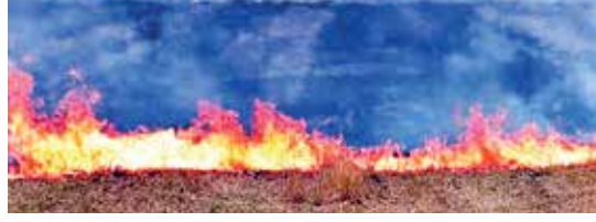
(એજન્સી) નવી દિલ્હી | તા. 07

સુપ્રિમ કોર્ટની કડકાઈ બાદ કેન્દ્ર સરકારે પરાલી સળગાવનારા ખેડૂતો પરનો દંડ ભમણો કરી દીધો છે. પર્યાવરણ મંત્રાલયે ગુરુવારે એક નોટિફિકેશન જારી કરીને આ જાણકારી આપી છે. હવે 2 અંકરથી ઓછી જમીન પર 5000 રૂપિયાનો દંડ વસુલવામાં આવશે.