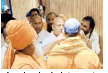
મોડા સુધી અકરાતફરીનો માહોલ રહ્યો. સંતો વચ્ચે થયેલી મારામારીના કારણે બેઠક યોજાઈ શકી નહીં. જણાવી દઈએ કે, પ્રયાગરાજ મેળા વહિવટી તંત્રની બેઠક યોજાવાની હતી. વહિવટી તંત્રની બેઠક માટે અખાડા પરિષદના બંને જૂથોને બોલાવવામાં આવ્યા હતા.

ઉત્તરપ્રદેશના પ્રયાગરાજ મહાકુંભને લઈને અખાડાઓની બેઠકમાં ભારે હોબાળો થયો. સંતો-મહંતો વચ્ચે ભારે મારામારી થઈ. અખાડાઓથી જોડાયેલા સંતોએ એકબીજાને લાફાવાળી કરી, એટલું જ નહીં ઢીકાપાટુ પણ વરસાવ્યા. મહાકુંભના મેળા વહિવટી તંત્રની અખાડાઓની બેઠક કાર્યાલયમાં થવાની હતી. અખાડા પરિષદ હાલના દિવસોમાં બે ભાગમાં વહેંચાયેલું છે.