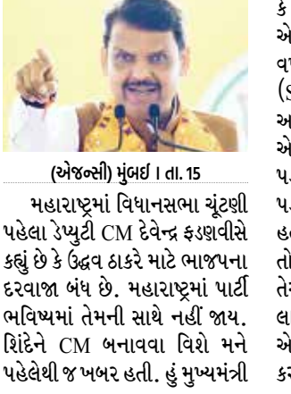
(એજન્સી) મુંબઈ | તા. 15

(એજન્સી) મુંબઈ | તા. 15 મહારાષ્ટ્રમાં વિધાનસભા ચૂંટણી પહેલા રૂપ્યુટી CM દેવેન્દ્ર ફડાવીસે કહ્યું છે કે ઉદ્ધવ ઠાકરે માટે ભાજપના દરવાજા બંધ છે. મહારાષ્ટ્રમાં પાર્ટી તેઓ આદિત્ય ઠાકરેને આગળ ભવિષ્યમાં તેમની સાથે નહીં જાય. શિંદેને CM બનાવવા વિશે મને પહેલેથી જ ખબર હતી. હું મુખ્યમંત્રી કે રાષ્ટ્રપતિની રેસમાં નથી. ન્યૂ એજન્સી ANI સાથે વાત કરતી વખતે ફડાવીસે કહ્યું કે, NCP (SP) ચીફ શરદ પવાર પરિવાર અને પાર્ટીને તોડવામાં નિષ્ણાત છે. એનસીપી અને શિવસેના તેમની વધુ પડતી મહત્વાકાંક્ષાઓને કારણે તૂટી પડ્યા. ઉદ્ધવ CM બનવા માંગતા હતા તેથી તેમણે અમારી સાથે નાતો તોડી નાખ્યો. મુખ્યમંત્રી બન્યા બાદ તેઓ આદિત્ય ઠાકરેને આગળ લાવવા માંગતા હતા, તેથી તેમણે એકનાથ શિંદેનો ગૂંગામણ કરવાનો પ્રયાસ કર્યો.