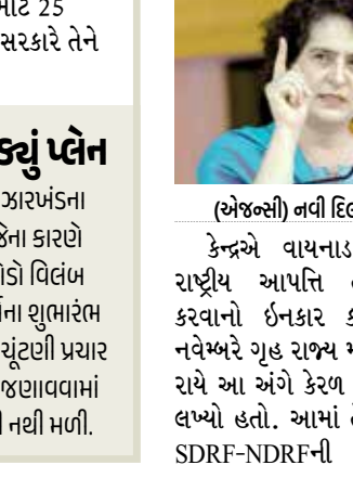
(એજન્સી) નવી દિલ્હી | તા. 15

(એજન્સી) નવી દિલ્હી | તા. 15 કેન્દ્રએ વાયનાડ ભૂસ્મલનને રાષ્ટ્રીય આપત્તિ તરીકે જાહેર કરવાનો ઇનકાર કર્યો છે. 10 નવેમ્બરે ગૃહ રાજ્ય મંત્રી નિત્યાનંદ રાયે આ અંગે કેરળ સરકારને પત્ર લખ્યો હતો. આમાં તેમણે કહ્યું કે, SDRF-NDRFની માર્ગદર્શિકા હેઠળ કોઈપણ આપત્તિને રાષ્ટ્રીય આપત્તિ તરીકે જાહેર કરવાની કોઈ જોગવાઈ નથી. ઓગસ્ટમાં રાજ્ય સરકારે વડાપ્રધાન મોદીને પત્ર લખીને વાયનાડ ભૂસ્મલનને રાષ્ટ્રીય આપત્તિ જાહેર કરવાની માગણી કરી હતી. આ સિવાય રાહુલ ગાંધીએ પણ 7 ઓગસ્ટે લોકસભામાં આ જ માંગણી કરી હતી. હકીકતમાં, વાયનાડના મુંડકાઈ, ચુરલમાલા, અટ્ટમાલા અને નૂલપુડા ગામમાં 29 જુલાઈની રાત્રે 2 વાગ્યાથી સવારે 4 વાગ્યાની વચ્ચે ભૂસ્મલન થયું હતું.