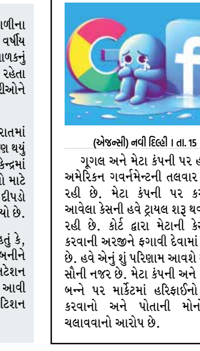
(એજન્સી) નવી દિલ્હી | તા. 15

(એજન્સી) નવી દિલ્હી | તા. 15 ગૂગલ અને મેટા કંપની પર હાલમાં અમેરિકન ગવર્નમેન્ટની તલવાર લટકી રહી છે. મેટા કંપની પર કરવામાં આવેલા કેસની હવે ટ્રાયલ શરૂ થવા જઈ રહી છે. કોર્ટ દ્વારા મેટાની કેસ રદ કરવાની અરજીને ફગાવી દેવામાં આવી છે. હવે એનું શું પરિણામ આવશે એ પર સોની નજર છે. મેટા કંપની અને ગૂગલ બન્ને પર માર્કેટમાં હરિકાઈનો નાશ કરવાનો અને પોતાની મોનોપોલી ચલાવવાનો આરોપ છે. હરિકાઈ નાબૂદ કરવાનો આરોપ અમેરિકાના ફેરલ ટ્રેડ કમિશન દ્વારા મેટા કંપની પર 2020માં કેસ કરવામાં આવ્યો હતો જ્યારે એનું નામ ફેસબુક હતું. ફેસબુક દ્વારા 2012માં ઈન્સ્ટાગ્રામ અને 2014માં વોટ્સએપને ખરીદી લેવામાં આવ્યું હતું. ફેરલ ટ્રેડ કમિશન દ્વારા એ આરોપ મૂકવામાં આવ્યો છે કે માર્કેટમાં હરિકાઈને દૂર કરવા માટે ફેસબુક દ્વારા આ બે કંપનીઓને ખરીદી લેવામાં આવી હતી જેથી તેમને ભવિષ્યમાં કોઈ નુકસાન ન થાય. આ સાથે જ એવો પણ આરોપ મૂક્યો હતો કે જ્યાં સુધી ફેસબુક અને તેની અન્ય એપ્લિકેશન સાથે કોઈ કોમ્પિટિશન કરવામાં ન આવે તો જ તેમની APIને એક્સેસ કરવા દેવામાં આવે છે. આ કેસ વિશે મેટાનું શું કહેવું છે? મેટા કંપનીના પ્રવક્તાએ કહ્યું કે 'અમને આ વાતની ખાતરી છે કે અમારી પાસે જે પુરાવા છે એ કોર્ટમાં એ સાબિત કરવા માટે પૂરતા છે કે ઈન્સ્ટાગ્રામ અને વોટ્સએપને ખરીદવું એ માર્કેટની હરિકાઈ માટે સારું અને યુઝર્સ માટે ખૂબ જ ફાયદાકારક રહ્યું છે. 'મેટા કંપનીનું માનવું છે કે તેમણે આ બે કંપનીઓ ખરીદી એના કારણે માર્કેટમાં હરિકાઈ વધી છે અને એ ધુ સર્વિસ ઉપલબ્ધ થઈ છે.