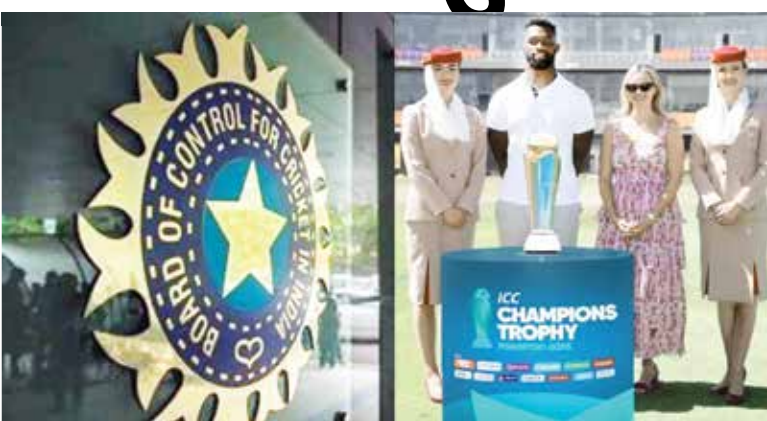
પાકિસ્તાન પણ UAEમાં ભારતની મેચ યોજવા માટે સંમત નથી. 3 બિલિયન ડોલરના સોદામાં 2027 સુધીની તમામ ICC ઈવેન્ટના અધિકારો મેળવનાર બ્રોડકાસ્ટર્સે ટેન્શનમાં હોવાનું જણાય છે. કારણ કે તમામ ટીમોમાં સૌથી વધુ દર્શકોને આકર્ષતી ભારત અને પાકિસ્તાનની મેચ જોખમમાં આવી શકે છે. વાસ્તવમાં, ટૂર્નામેન્ટનું સંપૂર્ણ શેડ્યુલ જાહેર થવાથી બ્રોડકાસ્ટર્સને ચેમ્પિયન્સ

ICC ચેમ્પિયન્સ ટ્રોફી 2025 આવતા વર્ષે પાકિસ્તાનમાં શરૂ થવા જઈ રહી છે પરંતુ હજુ સુધી તેમાં ટીમ ઈન્ડિયાની રમતનું ચિત્ર સ્પષ્ટ નથી. જેને લઈને BCCI અને PCB આમને-સામને છે. જ્યારે ટીમ ઈન્ડિયાએ આ ટૂર્નામેન્ટ માટે પાકિસ્તાનનો પ્રવાસ કરવાનો ઈન્કાર કરી દીધો છે, ત્યારે પાકિસ્તાન ક્રિકેટ બોર્ડ ટીમ ઈન્ડિયાને આમંત્રણ આપવા માટે તમામ શક્ય પ્રયાસો કરી રહ્યું છે. હવે બ્રોડકાસ્ટર્સે આ ટૂર્નામેન્ટનું શેડ્યુલ જાહેર કરવા માટે ICC પર દબાવ કરતા જોવા મળી રહ્યા છે. પાકિસ્તાનના ધ નેશનના એક અહેવાલ અનુસાર, ICC ચેમ્પિયન્સ ટ્રોફી 2025નું અંતિમ શેડ્યુલ આ સપ્તાહની શરૂઆતમાં જાહેર થવાની અપેક્ષા હતી. પરંતુ ભારતની ભાગીદારી અને હાઈબ્રિડ મોડલને અનુસરવામાં આવશે કે કેમ તે અંગે ચાલી રહેલી મુંઝવણને કારણે શેડ્યુલ બહાર પાડવામાં આવ્યું નથી. ઘણા મીડિયા અહેવાલો અનુસાર, ભારતે ICC અને PCBને પોતાનું વલણ સ્પષ્ટ કરી દીધું છે કે ટીમ પાકિસ્તાન નહીં જાય. ત્યારથી એવી અટકળો ચાલી રહી છે કે