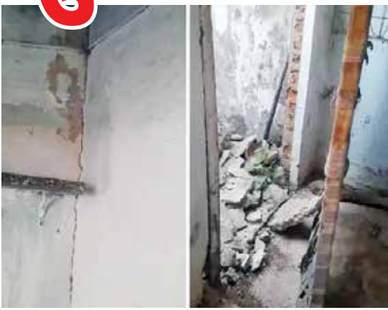
(એજન્સી) પાટણ | તા.16

26 જાન્યુઆરી 2001ની વહેલી સવારે આવેલા ભૂકંપે કચ્છ સહિત આખા ગુજરાતને હલાવી નાખ્યું હતું. એ બાદ ઉત્તર ગુજરાતમાં લગભગ 4ની તીવ્રતાથી વધુનો આંચકો નથી નોંધાયો. જોકે દેવદિવાળીની રાત્રે 10.16 કલાકે આવેલા ભૂકંપના આંચકાએ ઉત્તર ગુજરાતના લોકોના જીવ અથ્થર કરી દીધા હતા. શુક્રવારે રાત્રે ઉત્તર ગુજરાતના અનેક ભાગોમાં ભૂકંપનો આંચકો અનુભવાયો હતો, જેનું કેન્દ્રબિંદુ પાટણથી 13 કિલોમીટર દૂર ચાણસ્મા તાલુકાના સેવાળા ગામમાં નોંધાયું હતું. ગતરાત્રે આવેલા ભૂકંપના આંચકાથી ઉત્તર ગુજરાતના લોકોમાં ભયનું વાતાવરણ ઊભું થયું છે. ભૂકંપના આંચકાએ અનુભવાતા જ લોકો ઊંઘમાંથી જાગીને ઘરની બહાર દોડી આવ્યા હતા, જ્યારે હોસ્પિટલો અને એફસીસોમાં કામ કરતા તબીબો, સ્ટાફ અને દર્દીઓએ પણ ભય અનુભવ્યો હતો અને બહુમાળી બિલ્ડિંગોમાંથી દર્દીઓ પણ રસ્તા ઉપર આવી ગયા હતા.