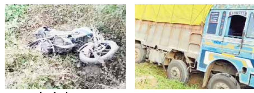
(એજન્સી) વડોદરા | તા. 16

વડોદરા ડામોઈ રોડ ઉપર વહેલી સવારે ગમખવાર અકસ્માત સર્જાયો છે, જેમાં એક યુવકનું ટ્રકની અડકેટ ઘાટના સ્થળે જ મોત નિપજ્યું છે. આ બનાવની જાણ થતા તાત્કાલિક પોલીસ ઘટના સ્થળે પહોંચી હતી. આ બનાવને લઈ લોક ટોળા એકઠા થયા હતા. બનાવ અંગે પોલીસે વધુ તપાસ હાથ ધરી છે. વડોદરા સહિત જિલ્લામાં અવાર નવાર અકસ્માતના બનાવો સામે આવતા હોય છે. આજે વહેલી સવારે વડોદરા ડામોઈ રોડ પર એક ગમખવાર અકસ્માત સર્જાયો હતો. જેમાં ટ્રકચાલકે બાઈક ચાલકને અડકેટ લીધો હતો. મળતી માહિતી મુજબ આ યુવક પેટ્રોલ પુરાવી જતો હતો તે દરમિયાનમાં ટ્રકચાલકે યુવકને અડકેટ લેતાં ઘટના સ્થળે જ મોત નિપજ્યું હતું. આ ઘટનાની જાણ થતા તાત્કાલિક ડામોઈ પોલીસ અને 108ની ટીમ તાત્કાલિક ઘટનાના સ્થળે પહોંચી હતી. જે કે