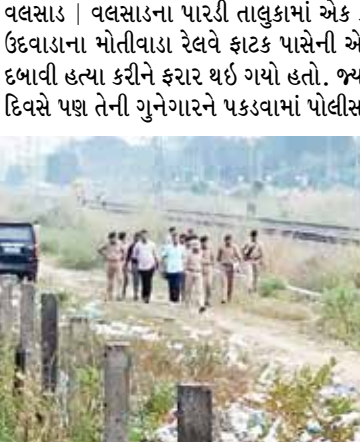
(એજન્સી) વલસાડ | તા. 16

વલસાડ | વલસાડના પારડી તાલુકામાં એક ક્રોલેજિયન યુવતી ગુરુવારે બપોરે ટ્યુશનથી ઘરે પરત ફરી ન હતી. ઉદવાડાના મોતીવાડા રેલવે સ્ટાંડ પાસેની એક આંબાવાડી(ખેતર)માં અજાણ્યા શખસે તેની દુકર્મ આચરી ગણું દબાવી હત્યા કરીને ફેરા થઈ ગયો હતો. જ્યારે પોલીસે દુકર્મની હત્યાના પકડવા માટે કમર કસી છે, પરંતુ ત્રીજા દિવસે પણ તેની ગુનેગારને પકડવામાં પોલીસ સફળ રહી નથી. પોલીસને એક સિમકાર્ડ મળ્યું છે.