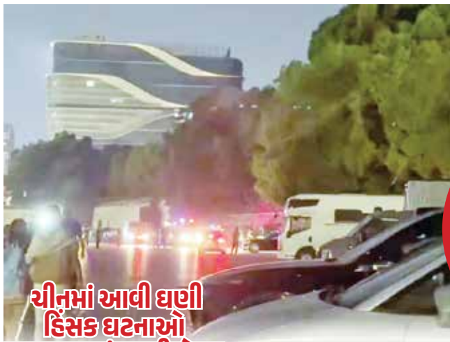
ચીનમાં આવી ઘણી હિંસક ઘટનાઓ પ્રકાશમાં આવી છે

ઇન્સ્ટિટ્યૂટ ઓફ આર્ટ્સ એન્ડ ટેકનોલોજીમાં સાંજે સાડા છ વાગ્યે બની હતી