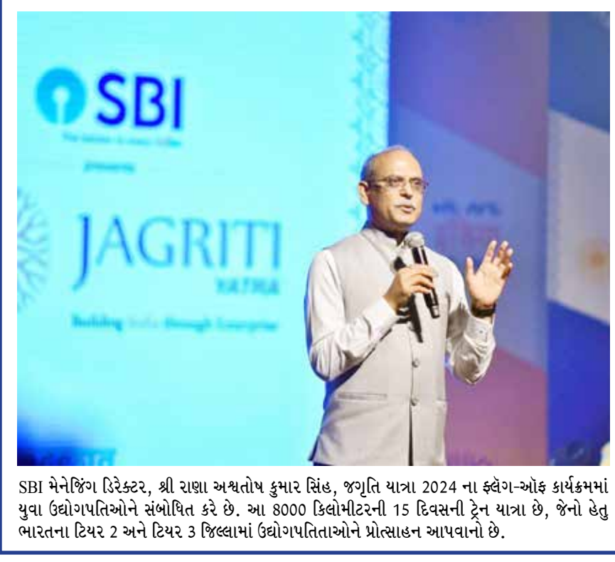
SBI મેનેજિંગ ડિરેક્ટર, શ્રી રાણા અશ્વતોષ કુમાર સિંહ, જગૃતિ યાત્રા 2024 ના ફ્લેગ-ઓફ કાર્યક્રમમાં યુવા ઉદ્યોગપતિઓને સંબોધિત કરે છે. આ 8000 કિલોમીટરની 15 દિવસની ટ્રેન યાત્રા છે, જેનો હેતુ ભારતના ટિયર 2 અને ટિયર 3 જિલ્લામાં ઉદ્યોગપતિઓને પ્રોત્સાહન આપવાનો છે.