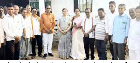
ગામો માટે સ્ટેનલેસ સ્ટીલ ની નનામી નું વિતરણ નાંદોદ ધારાસભ્ય ડો.દર્શનાબેન દેશમુખ ના હસ્તે કરવામાં આવ્યું. ડો. દર્શનાબેન દેશમુખ-ધારાસભ્ય નાંદોદ વિધાનસભા ના હસ્તે ONGC ના CSR પ્રોજેક્ટ અંતર્ગત નીડ હોમ ટેકનિકલ એજ્યુકેશન ટ્રસ્ટ, વડોદરા તરફથી નર્મદા જિલ્લાના ૨૫૦

નર્મદા જિલ્લા માં વારંવાર વૃક્ષારોપણ કાર્યક્રમો કરી અનેક સંસ્થાઓ વૃક્ષો ની વાવણી અને ઉછેર કરે છે પરંતુ જ્યાં જ્યાં ત્યાં નવા બાંધકામ ના કારણે વૃક્ષો નું કટિંગ થતું હોય છે તેની સામે વધતા જતા વાહનો ના પ્રદૂષણ ના કારણે પર્યાવરણ પર માઠી અસર થાય છે માટે વૃક્ષો ના કટિંગ ના કરાઈએ ખાસ અગત્યનું છે ત્યારે ગ્રામ્ય વિસ્તારો માં તો મૃત્યુ પામનારા વ્યક્તિઓ ને લાકડા થી બાળવા માં આવતા હોય માટે વૃક્ષો નું કટિંગ કરવું પડે છે, માટે ONGC ના CSR પ્રોજેક્ટ અંતર્ગત નીડ હોમ ટેકનિકલ એજ્યુકેશન ટ્રસ્ટ, વડોદરા તરફથી નર્મદા જિલ્લાના ૨૫૦