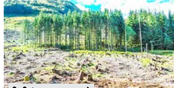
દિલ્હીમાં પ્રદૂષણના દૂષણ વચ્ચે ગ્રીન ટ્રિબ્યુનલ સમક્ષ ખુલાસો

(એજન્સી) યુપી | તા. 23 ઉત્તર પ્રદેશ સરકારે નેશનલ ગ્રીન ટ્રિબ્યુનલને જાણ કરી હતી કે સરકારને કાવડ યાત્રાના પથ પર આવતા ફોરેસ્ટ વિસ્તારમાં આશરે 1.12 લાખ વૃક્ષો હટાવવાની છૂટ મળી છે. જેને પગલે રાજ્ય સરકાર આટલા વૃક્ષોને હટાવવાની કામગીરી શરૂ કરશે. જ્યારે દિલ્હીમાં પ્રદૂષણ વચ્ચે વૃક્ષો કાપવા મુદ્દે એક અરજી થઈ છે. જેને પગલે સુપ્રીમે નિષ્ણાતોની કમિટી બનાવવા કહ્યું હતું. ઉત્તર પ્રદેશના મામલે પણ આગાઉ નેશનલ ગ્રીન ટ્રિબ્યુનલમાં એક લાખથી વધુ વૃક્ષો કાપવાના નિર્ણય સામે અરજી કરવામાં આવી હતી. જેને પગલે ટ્રિબ્યુનલે ઉત્તર પ્રદેશના પર્યાવરણ વિભાગ પાસેથી માહિતી માગી હતી. જવાબમાં રાજ્યના પર્યાવરણ