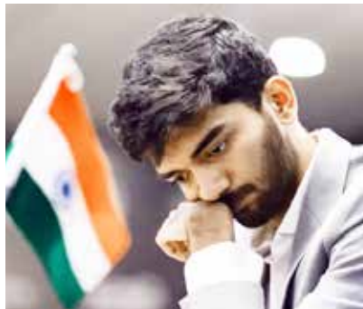
ફાઈનલ મેચમાં 14 રાઉન્ડ થશે

(એજન્સી) સિંગાપોર | તા 26 ભારતીય ગ્રાન્ડમાસ્ટર ડી ગુકેશ સિંગાપોરમાં ચાલી રહેલી વર્લ્ડ ચેસ ચેમ્પિયનશિપની પ્રથમ મેચ હારી ગયો છે. તેને ડિકેડિંગ ચેમ્પિયન ડીંગ લિરેનેથી હરાવ્યો હતો. આ હાર બાદ ભારતીય સ્કોર 14 મેચ સુધી ચાલેલી મેચમાં 0-1થી પાછળ રહી ગયો છે. વર્લ્ડ ચેસ ચેમ્પિયનશિપના ઇતિહાસમાં આ પ્રથમ વખત છે કે જ્યારે બે એશિયન ખેલાડીઓ વિશ્વ ચેમ્પિયન બનવા માટે એકબીજા સામે સ્પર્ધા કરી રહ્યા છે. 18 વર્ષના ગુકેશે ડાઈટ પીસથી શરૂઆત કરી. તેણે રમતની શરૂઆતમાં રાજાના આગળના પ્યાદાને બે ઘરો ખસેડીને ભૂલ કરી. લિરેને 'ફેન્સ ડિકેન્સ' સાથે જવાબ આપ્યો. ગુકેશે એ જ વ્યૂહરચના અપનાવી હતી જે વિશ્વનાથન આનંદે 2001માં સ્પેનના એલેક્સી શિરોવ સામે પ્રથમ વર્લ્ડ ચેમ્પિયનશિપ ટાઇટલ જીતી ત્યારે અપનાવી હતી. ગુકેશને 12મી ચાલ સુધી અડધો ક્લાકનો ફાયદો હતો, પરંતુ 8 ચાલ પછી લિરેનેને વધારાની મિનિટો મળી, જેનાથી સાબિત થયું કે તેણે તેના પ્રારંભિક પડકારને પાર કરી લીધો છે. આ પછી તેણે જોરદાર કમ્બેક કર્યું અને 42 ચાલમાં જીત મેળવી. ગુકેશે એપ્રિલમાં ટોરોન્ટોમાં કેનિડિયન ચેસ ટુર્નામેન્ટ જીતી હતી. આવું કરનાર તે સૌથી યુવા ખેલાડી (17 વર્ષ) બન્યા. ગુકેશ પહેલા રશિયન ખેલાડી ગેરી કાર્પારોવે 1984માં 22 વર્ષની સૌથી નાની ઉંમરમાં આ ટુર્નામેન્ટ જીતી હતી.