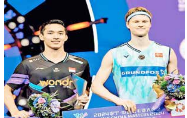
એન્ટોનસેને 51 મિનિટમાં ટાઇટલ જીતી

એન્ટોનસેને 51 મિનિટમાં ટાઇટલ જીતી ચાઈના ઓપન માસ્ટર્સ બેડમિન્ટન મેન્સ સિંગલ્સમાં એન્ટોનસેને જોનાથાન ક્રિસ્ટીને હરાવીને ટાઇટલ જીતનાર ડેનમાર્કના પ્રથમ ખેલાડી બનવાની સિદ્ધિ મેળવી હતી. યુરોપિયન ચેમ્પિયન એન્ટોનસેને 51 મિનિટમાં પોતાના હરીફને 21-15, 21-13થી હરાવીને ચાલુ વર્ષ પોતાનું યોથું ટાઇટલ જીત્યું હતું. ફાઈનલ્સ રેન્કિંગના ટોચના ક્રમે પહોંચવાની રેસમાં તેણે પોતાનો દાવો વધારે મજબૂત કર્યો છે. એશિયન ચેમ્પિયન જોનાથાન સામે એન્ટોનસેને 10 મુકાબલામાં ચોથો વિજય હાંસલ કર્યો છે. પેરિસ ઓલિમ્પિક્સમાં ગોલ્ડ મેડલ જીત્યા બાદ પોતાની પ્રથમ પ્રોફેશનલ ટુર્નામેન્ટ રમનાર એન સેયોંગે ચીની સ્થાનિક ખેલાડી ગાઓ ફેંગજેઈને હરાવીને ટાઇટલ પોતાના નામે કર્યું હતું. 22 વર્ષીય કોરિયન ખેલાડીએ 38 મિનિટમાં કોઈ પણ મુશ્કેલી વિના ફાઈનલ 21-12, 21-8ના સ્કોરથી જીતી લીધી હતી. તેણે સિઝનમાં યોથું અને કારકિર્દીમાં 27મું ટાઇટલ પોતાના નામે કર્યું હતું. વિમેન્સ ડબલ્સમાં ઓલ ચાઈનીઝ ફાઈનલમાં ઓલિમ્પિક સિલ્વર મેડાલિસ્ટ લિયુ સેંગસુ અને તાન નિંગોએ લિ યિજિંગ અને લુઓ ઝ્યુમિનને હરાવીને હતી. બંનેએ ચાલુ વર્ષ છઠ્ઠું ટાઇટલ જીત્યું છે.