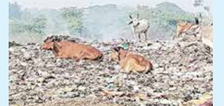
(એજન્સી) આણંદ । તા.26

બોરસદની આણંદ ચોકડી પાસે આવેલી કાશીબા સોસાયટી પાસે નગરપાલિકાના પ્લોટમાં પાલિકા દ્વારા શહેરનો તમામ કચરો ઠાવવામાં આવે છે. આ કચરો સળગાવતા ફેલાતા ધુમાડાના કારણે આસપાસની ૨૫થી વધુ સોસાયટીના રહીશોને શ્વાસની તકલીફ ઉભી થઈ હોવાના આક્ષેપો લાગ્યા છે. જ્યારે પાલિકા દ્વારા કચરો સળગાવવામાં ન આવતો હોવાનો ચીફ ઓફિસર દ્વારા દાવો કરવામાં આવ્યો છે. બોરસદની આણંદ ચોકડી પાસે આવેલી કાશીબા સોસાયટીમાં પાલિકાનો પ્લોટ આવેલો છે. સ્થાનિકોના જણાવ્યા મુજબ, આ પ્લોટમાં પાલિકા દ્વારા શહેરનો તમામ કચરો ઠાવવામાં આવતા સ્થાનિકો અસહ્ય દુર્ગંધથી ત્રસ્ત બન્યાં છે. તેમજ કચરો સળગાવવામાં આવતા આખા વિસ્તારમાં ધુમાડો ફેલાય છે. જેના કારણે પ્રદુષણ ફેલાઈ રહ્યું છે. પરિણામે વિસ્તારની ૨૫થી વધુ સોસાયટીના અંદાજે બે હજારથી વધુ રહીશોને શ્વાસ લેવામાં તકલીફ પડી રહી હોવાના આક્ષેપ લગાવ્યા હતા. તેમજ આ અંગે બોરસદ પાલિકા, જિલ્લા કલેક્ટર સહિત ઉચ્ચકક્ષાએ વારંવાર લેખિત રજૂઆતો કરવા છતાં પાલિકા દ્વારા કોઈ કાર્યવાહી કરવામાં ન આવી હોવાના અને કચરો ઠાવવા બીજા પ્લોટ ફાળવેલા હોવા છતાં આ જગ્યાએ જ કચરો નાખવામાં આવતો હોવાના આક્ષેપ લગાવ્યા હતા.