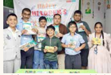
ઉગરેએ જણાવ્યું હતું, 'અમારું માનવું છે કે દરેક બાળકને મોટા સપના જોવાની તક મળવી જોઈએ, પછી ભલે તેના સંજોગો ગમે તે હોય.' શૈક્ષણિક સાધનોની વહેંચણી કરીને અને આ બાળકો સાથે જોડાઈને, અમે તેમની સંભવિતતાને

બાળ દિવસની ઉજવણીમાં, ભારતના સ્ટેશનરી ઉદ્યોગમાં અગ્રણી હિન્દુસ્તાન પેન્સિલે એક પહેલ શરૂ કરી, જેણે દેશભરમાં 10,000 થી વધુ પછાત બાળકોના જીવન પર અસર કરી હતી. આ અભિયાન દ્વારા, કંપનીએ શૈક્ષણિક વિકાસને પ્રોત્સાહન આપવા અને યુવાનોમાં ઉત્સાહ લાવવા માટે આવશ્યક સ્ટેશનરી પુરવઠો પૂરો પાડ્યો હતો અને આકર્ષક પ્રવૃત્તિઓનું આયોજન કર્યું હતું. શિક્ષણને સમર્થન અને સમાનતાને પ્રોત્સાહન આપવા માટે હિન્દુસ્તાન પેન્સિલની પ્રતિબદ્ધતા આ પહેલના હાર્દમાં રહેલી છે. હિન્દુસ્તાન પેન્સિલના અધ્યક્ષ પ્રદીપ