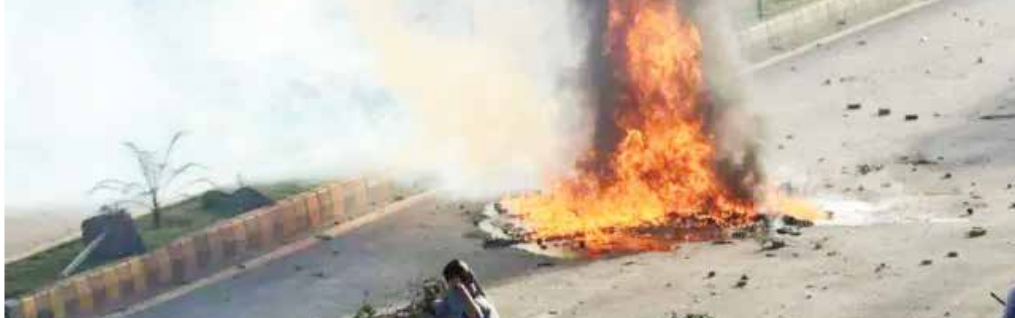
(એજન્સી) ઇસ્લામાબાદ | તા 26