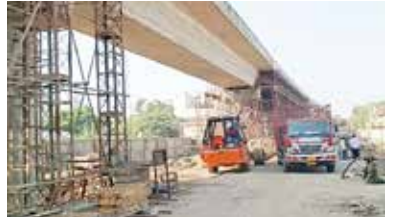
(એજન્સી) લાવનગર । તા.26

સરકારી તંત્રમાં મોટાભાગની કામગીરી સમય મર્યાદામાં થતી નથી, જેના કારણે લોકોની પરેશાની વધતી હોય છે અને કામગીરીનો ખર્ચ પણ વધતો હોય છે. આવું જ ભાવનગર મહાપાલિકામાં જોવા મળી રહ્યું છે. ભાવનગર મહાપાલિકાએ શહેરના શાસ્ત્રીનગરથી દેસાઈનગર સુધી ફ્લાયઓવર બનાવવાની કામગીરી ચાર વર્ષ પૂર્વે શરૂ કરી હતી પરંતુ હજુ ફ્લાયઓવરની કામગીરી પૂર્ણ થઈ નથી. જોકે કે. આ મામલે ભારે ચર્ચા અને વિવાદ શરૂ થતાં આખરે આજે ફ્લાયઓવરનું ટેસ્ટિંગ શરૂ કરવામાં આવ્યું છે અને ટેસ્ટિંગ પૂર્ણ થઈ ગયા બાદ ફ્લાયઓવર પરનો વન-વે રોડ શરૂ કરવા માટેની હિલચાલ ચાલી રહી હોવાનું જાણવા મળેલ છે. આ અંગેની વિગત એવી છે કે, શહેરમાં શાસ્ત્રીનગરથી આરટીઓ સર્કલ થઈ દેસાઈનગર સુધીના કામ માટે પીએમસીને તા. ૭