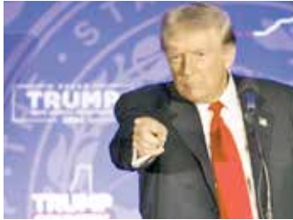
(એજન્સી) અમેરિકા | તા 26

ડોનાલ્ડ ટ્રમ્પે ચીન, કેનેડા અને મેક્સિકોથી આવતા સામાન પર ટેરિક લાદવાની વાત કરી છે. તેમણે કહ્યું કે સત્તા સંભાળ્યા બાદ તેઓ ચીનથી આવતા સામાન પર 10% અને કેનેડા-મેક્સિકોથી આવતા સામાન પર 25% ટેરિક લાદશે.