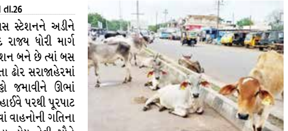
(એજન્સી) ઉમરાળા । તા.26

ઉમરાળાની પશ્ચિમે એસ.ટી. બસ સ્ટેશનને અડીને પસાર થતા અમરેલી-અમદાવાદ રાજ્ય ધોરી માર્ગ પર, જ્યાં છ તરફના માર્ગોનું જંકશન બને છે ત્યાં બસ સ્ટેશનની સામે દાઈવે પર રખડતા ઘેર સરાજાદરમાં બેરોકોટકપણે કલાકો સુધી અડો જમાવીને ઊભાં અથવા બેઠાં હોય છે, જાણે કે આ દાઈવે પરથી પૂરપાટ ઝડપે પસાર થતા માતેલા સાંઢ જેવાં વાહનોની ગતિના નિયંત્રણની તેઓ ફરજ બજાવતા હોય તેવી સૌને અનુભૂતિ થાય છે.