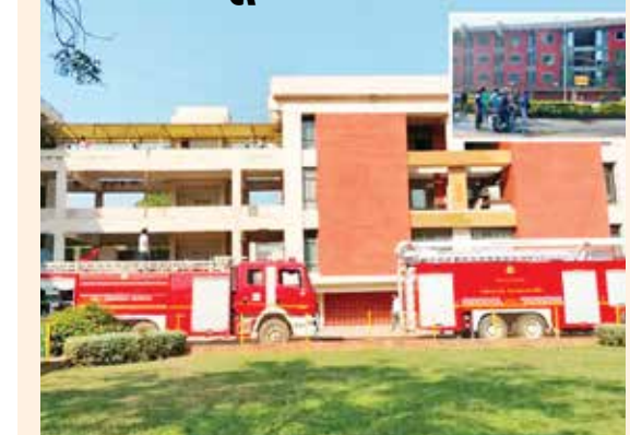
(એજન્સી) ગાંધીનગર । તા.26

અનુસાર, આગ જૂના રાજ્યમાં સતત આગ ઘટનાઓમાં વધારો થઈ રહ્યો છે. ત્યારે આજે વહેલી સવારે ગાંધીનગર ખાતે આવેલા ડો. જીવરાજ મહેતા ભવન- જૂના સચિવાલયની બિલ્ડિંગના બ્લોક નંબર 1 નજીક સવારે આગ ફાટી નીકળી હતી. ઓફિસ સમય પહેલા લાગેલી આગને અંદાજે એક કલાકમાં કાબુમાં લાવવામાં આવી હતી. આગની ઘટનાની જાણ થતાં ફાયર બ્રિગેડની ટીમ ઘટનાસ્થળે દોડી આવી હતી અને માત્ર એક કલાકમાં આગ પર કાબૂ મેળવી લીધો હતો. જૂના સચિવાલય ગાંધીનગરના સૂત્રોના જણાવ્યા અનુસાર, આગ જૂના સચિવાલયના ગેટની સામે આવેલા બ્લોક નં. 1 અને બ્લોક નંબર 8ની નજીક આગ લાગી હતી. ચાલુ દિવસ હોવાથી ઓફિસ ટાઈમિંગ પહેલાં લાગેલી આગ પર ગણતરીના કલાકોમાં જ કાબૂ મેળવી લેવામાં આવ્યો હતો. જોકે આગ લાગવાનું ચોક્કસ કારણ હજુ સુધી જાણી શકાયું નથી. આ ઘટનામાં કોઈ જાનહાનિના થયેલ નથી અને ફાયર વિભાગના બે મોટા ફાયર ક્રોનરોલ વાહન અને એક નાનું વાહન જોવા મળ્યું હતું, જેણે પરિસ્થિતિને નિયંત્રણમાં લીધી હતી.