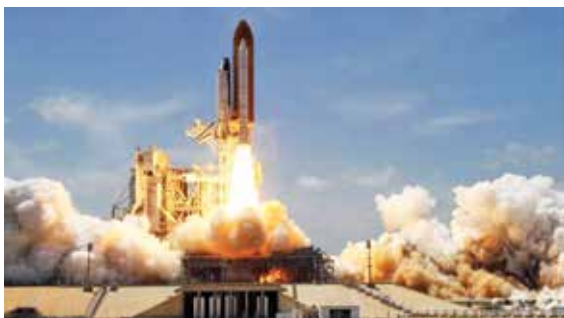
(એજન્સી) ટોકિયો | તા 26

જાપાનમાં સેટેલાઈટ લોન્ચિંગ દરમિયાન એપ્સીલોન એસ રોકેટના એન્જિનમાં આગ લાગી હતી. આ રોકેટ જાપાન સરકારની સ્પેસ ઓટોનોમી અને સેટેલાઈટ લોન્ચિંગ માર્કેટમાં તેની સ્થિતિ મજબૂત કરવાની મહત્વાકાંક્ષી યોજનાનો એક ભાગ છે.