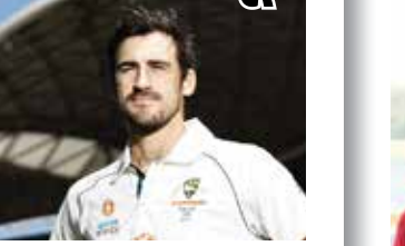
(એજન્સી) મેલબોર્ન તા 26

ભારત અને ઓસ્ટ્રેલિયા વચ્ચેની પાંચ ટેસ્ટ મેચની સિરીઝની ચોથી મેચ ગુરુવારથી મેલબોર્ન પર રમાશે. આ મેચમાં ઓસ્ટ્રેલિયાની નજર ઝડપી બોલર મિચેલ સ્ટાર્ક પર રહેશે. જે મેચમાં પોતાના નામે મોટી સિદ્ધિ કરી શકે છે. ડાબોડી ઝડપી બોલર સ્ટાર્ક હાલ શાનદાર ફોર્મમાં છે અને જો સ્ટાર્ક આ ટેસ્ટ મેચમાં પાંચ વિકેટ ઝડપી લેશે તો તે ઓસ્ટ્રેલિયાનો ચોથો એવો બોલર બનશે જેણે આંતરરાષ્ટ્રીય ક્રિકેટમાં 700 વિકેટ ખેરવી હોય. મિચેલ સ્ટાર્ક વર્તમાન ક્રિકેટ સિરીઝમાં હજુ સુધીમાં 14 વિકેટ ઝડપી ચૂક્યો છે. તેણે પિન્ક બોલ ટેસ્ટમાં 6 વિકેટ ઝડપી હતી. આ સિરીઝમાં તે જસપ્રીત બુમરાહ બાદ સૌથી વધારે વિકેટ ઝડપવાના મામલે બીજા ક્રમે છે. જો કે, સ્ટાર્કના નિશાન પર મેલબોર્ન ટેસ્ટમાં પાંચ વિકેટ