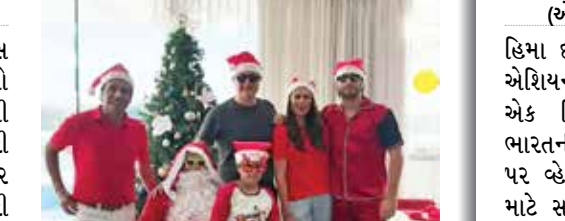
(એજન્સી) દુબઈ તા 26

ધોનીની સાન્તા કેપ પર માહી લખેલું છે અને ધોની પાસે સાન્તા તરીકે ઘણી ગિફ્ટ પડી છે. ધોની IPL 2025માં જોવા મળશે. IPL-2025ના ઓક્શન પહેલા તેને ચેન્નઈ સુપર કિંગ્સે અનકેપ ખેલાડી તરીકે રિટેન કર્યો હતો. ગાયકવાડને કેપ્ટનશિપ સોંપી હતી. ચેન્નઈ સુપર કિંગ્સે ધોનીની કેપ્ટનશિપમાં 2023માં પાંચમું ટાઈટલ જીત્યું હતું. આ પછી, આગામી સિઝનમાં, માહીએ ઋતુરુજ ગાયકવાડને કેપ્ટનશિપ સોંપી હતી. પરંતુ 2024 IPLમાં ચેન્નઈને ઝૂપ સ્ટેજમાંથી જ બહાર થવાનો વારો આવ્યો હતો.