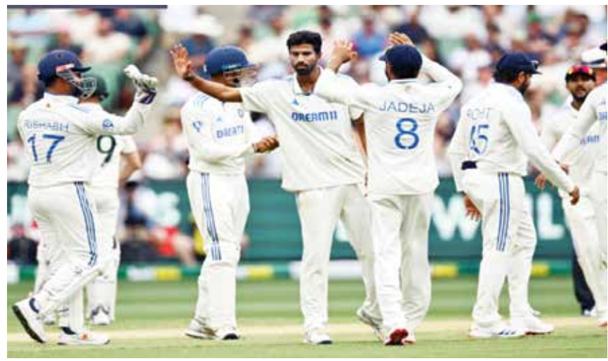
(એજન્સી) મેલબોર્ન તા 26

ટીમ ઈન્ડિયાના ફિલ્ડર્સને થકવી નાખ્યા, છેલ્લે-છેલ્લે બુમરાહે પોતાનો દમ દેખાડ્યો