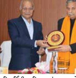
ગાંધીનગર સંવાદદાતા : વિજયવીર શાહવ

ભારત રત્ન મહામના પં. મદન મોહન માલવીય, એક મહાન સમાજ સુધારક અને આદર્શ વાઈસ ચાન્સેલર તરીકે, હંમેશા વિદ્યાર્થીઓના સર્વાંગી વિકાસને મહત્વ આપે છે. તેમણે વિદ્યાર્થીઓના સર્વાંગી વિકાસ પર ભાર મૂક્યો હતો. તેમણે હંમેશા ચાલિત નિર્માણથી ભરપૂર યુનિવર્સિટી બનાવવા પર ભાર મૂક્યો હતો. આ વાત યુનિવર્સિટી ગ્રાન્ટ્સ કમિશનના ભૂતપૂર્વ અધ્યક્ષ અને ટાટા ઈન્સ્ટિટ્યૂટ ઓફ સોશિયલ સાયન્સના ચાન્સેલર પ્રો. ધીરેન્દ્ર પાલ સિંહજીએ કરી હતી. તેઓ બુધવારે ગુજરાત સેન્ટ્રલ