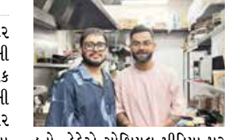
(એજન્સી) મેલબોર્ન તા 26

ભારતીય ક્રિકેટ ટીમના સ્ટાર બેટર વિરાટ કોહલી 25 ડિસેમ્બરની સવારે મેલબોર્નની એક સ્થાનિક રેસ્ટોરન્ટમાં જોવા મળ્યો હતો. તેની તસવીરો સોશિયલ મીડિયા પર વાઈરલ થઈ રહી છે. કિસમસના અવસર પર તેણે પત્ની અનુષ્ઠા શર્મા સાથે મેલબોર્નની 'કેકે કોર્ટ' રેસ્ટોરન્ટમાં બ્રેકફાસ્ટ કર્યો હતો. બ્રેકફાસ્ટ કર્યા બાદ વિરાટે રેસ્ટોરન્ટ સ્ટાફ સાથે ફોટો ક્લિક કરાવ્યો હતો. કેકેએ સોશિયલ મીડિયા પર સ્ટાફ સાથે વિરાટ કોહલીનો ફોટો પોસ્ટ કર્યો છે. તેમણે એ પણ જણાવ્યું કે વિરાટ કેકેના રસોડામાં ગયો હતો અને બધાનો આભાર માન્યો હતો અને ફોટોગ્રાફ પણ લીધા હતા. "આજે સવારે, જ્યારે અમે હજી પણ જાહેર રજાના દિવસે અમારું કેકે પુલ્કું રાખવું કે કેમ તે અંગે વિચારી રહ્યા હતા, ત્યારે અમને ખ્યાલ નહોતો કે અમે અમારા નાના કેકેમાં કિંગ વિરાટ કોહલી અને અનુષ્ઠા શર્મા અને તેમના પરિવારની સેવા કરવાનો અનુભવ દયાળુ હતા કે તેઓ અમારા રસોડામાં આવ્યા, શેફનો આભાર માન્યો અને અમને તેમની સાથે ફોટોગ્રાફ લેવાની તક આપી.