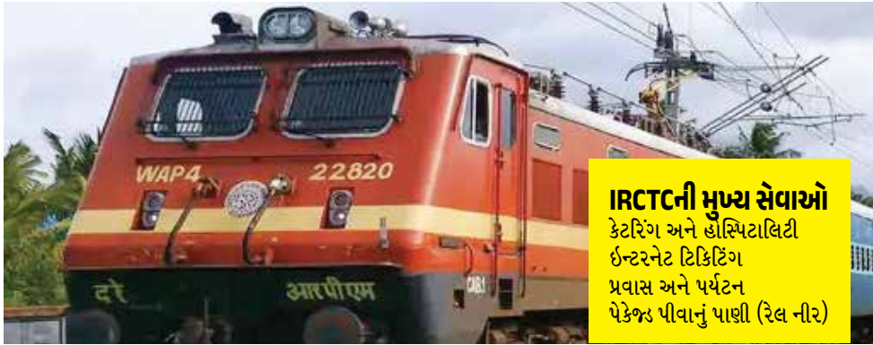
IRCTCની મુખ્ય સેવાઓ કેટરિંગ અને હોસ્પિટાલિટી ઈન્ટરનેટ ટિકિટિંગ પ્રવાસ અને પર્યટન પેકેજ્ઝ પીવાનું પાણી (રેલ નીર)

ભારતીય રેલવેનું ઈ-ટિકિટિંગ પ્લેટફોર્મ, ઈન્ડિયન રેલવે કેટરિંગ એન્ડ ટૂરિઝમ કોર્પોરેશન (IRCTC)ની ઓનલાઈન વેબસાઈટ અને મોબાઈલ એપ ગુરુવારે (26 ડિસેમ્બર) ઠપ થઈ છે. તત્કાલ ટિકિટ બુકિંગ સમયે જ આ સમસ્યા સર્જાતા દેશભરમાં લાખો લોકોને ટિકિટ બુકિંગમાં સમસ્યાનો સામનો કરવો પડી રહ્યો છે. રેલવે ટિકિટિંગ પ્લેટફોર્મ પર આપવામાં આવેલી માહિતી અનુસાર, મેન્ટેનન્સ એક્ટિવિટીને કારણે લોકોને આ સમસ્યાનો સામનો કરવો પડી રહ્યો છે. અગાઉ 9 ડિસેમ્બરે 1 કલાક સુધી સર્વિસ બંધ રહી હતી. IRCTCની વેબસાઈટ પર લખેલા નોટિફિકેશન મુજબ, 'મેન્ટેનન્સ એક્ટિવિટીને કારણે હાલમાં ઈ-ટિકિટિંગ સેવા ઉપલબ્ધ રહેશે નહીં. કૃપા કરીને પછી પ્રયાસ કરો.' આ સાથે આપવામાં આવેલી માહિતી અનુસાર, 'ટિકિટ/ફાઈલ TDR રદ કરવા માટે, કૃપા કરીને કસ્ટમર કેર નંબર 146446, 08044647999 અને 08035734999 પર કોલ કરો અથવા etickets@irctc.co.in પર મેઈલ કરો.' નોંધનીય છે કે સામાન્ય રીતે IRCTC પર તત્કાલ