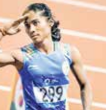
(એજન્સી) નવી દિલ્હી તા 26

હિમા દાસ પર પ્રતિબંધ જાકારતા એશિયન ગેમ્સમાં બે ગોલ્ડ અને એક સિલ્વર મેડલ જીતનારી ભારતની સ્ટાર એથ્લીટ હિમા દાસ પર ચેર એબાઉટ ફેલ્યોર (ટેસ્ટ માટે સરનામાની જાણકારી નહીં આપવી) માટે તેની પર 16 મહિનાનો પ્રતિબંધ લદાયો હતો. તેની પર આ પ્રતિબંધ 22 જુલાઈ, 2023થી લગાવાયો હતો. વર્લ્ડ એન્ડી રીપિંગ એજન્સી (વાડા) અને નેશનલ ઓપિંગ એજન્સી (નાડા)એ હિમા પર કેસના પરસ્પર સમાધાન સમજૂતી હેઠળ આ પ્રતિબંધ લાઘો છે. અન્યથા તેની પર બે વર્ષનો પ્રતિબંધ પણ લાગી શકતો હતો. હિમા પરનો આ પ્રતિબંધ આ વર્ષે 22 નવેમ્બરના રોજ સમાપ્ત થઈ ગયો હતો. હિમા દાસને ગયા વર્ષે સપ્ટેમ્બર મહિનામાં ચેર એબાઉટ ફેલ્યોર માટે નાડાએ અસ્થાયી રીતે