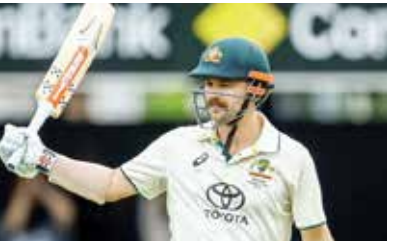
(એજન્સી) મેલબોર્ન તા 26

અનુભવી ક્રિકેટર ગ્રેગ ચેપલે ટ્રેવિસ હેડને હાલમાં વિશ્વનો સર્વશ્રેષ્ઠ બેટર ગણાવ્યો છે. તેમણે કહ્યું- BGTમાં જસપ્રીત બુમરાહ સામે હેડનું પ્રદર્શન તેના નીડર અભિગમ અને બેટિંગના ઓસ્ટ્રેલિયન કોર્મ્યુલાનું ઉદાહરણ છે. ઓસ્ટ્રેલિયાના ભૂતપૂર્વ કેપ્ટન ચેપલ માને છે કે ટેસ્ટ બેટર તરીકે હેડની સફળતા પાછળનું કારણ તેની સહજતા અને આક્રમકતા છે. હેડે ભારત સામેની પ્રથમ 3 ટેસ્ટ મેચમાં બે સદી અને એક અડધી સદીની મદદથી 409 રન બનાવ્યા છે. તે સિરીઝનો ટોપ સ્કોરર છે. હાલમાં બુમરાહ સામે હેડનું પ્રદર્શન તેના નીડર અભિગમનું ઉદાહરણ છે. જ્યારે અન્ય બેટર્સ બુમરાહની બિનપરંપરાગત ક્રિયા, ગતિ અને સતત સચોટ બોલિંગ સામે સંઘર્ષ કરી રહ્યા હતા, ત્યારે હેડે તેને અન્ય મજબૂત ઈરાદા સાથે બુમરાહનો સામનો કર્યો અને તેની સામે રન બનાવવાનો પ્રયાસ કરીને માત્ર તેનો ખતરો ઓછો કર્યો જ નહીં પરંતુ તેની લયમાં પણ ખલેલ પહોંચાડી.