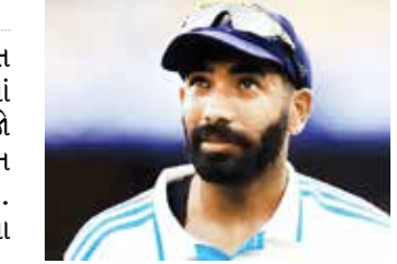
(એજન્સી) દુબઈ તા 26

ભારતીય ઝડપી બોલર જસપ્રીત બુમરાહ ICC ટેસ્ટ બોલિંગ રેન્કિંગમાં 904 રેટિંગ પોઈન્ટ મેળવનાર બીજો ભારતીય બન્યો છે. તેણે રવિચંદ્રન અશ્વિનના રેકોર્ડની બરાબરી કરી. ડિસેમ્બર 2016માં અશ્વિનને આટલા રેટિંગ પોઈન્ટ મળ્યા હતા. બીજા તરફ, ટ્રેવિસ હેડ તેના સતત શાનદાર પ્રદર્શન બાદ ICC મેન્સ ટેસ્ટ બોલિંગ રેન્કિંગમાં ટોપ-4માં પહોંચી ગયો છે. તેનું કારણ બોર્ડર-ગાવસ્કર ટ્રોફીમાં ભારત સામે તેનું સાડું પ્રદર્શન છે. હેડ યશસ્વી જયસ્વાલને પાછળ છોડીને ચોથા સ્થાને પહોંચી ગયો છે. તો ચાર્લસ હવે નંબર-5 પર પહોંચી ગયો છે. ઈંગ્લેન્ડનો જો રૂટ ટોપ પર છે.