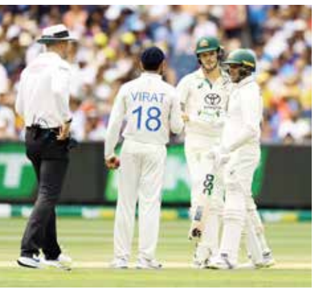
(એજન્સી) મેલબોર્ન તા 26

ટીમ ઈન્ડિયાના દિગ્ગજ ખેલાડી વિરાટ કોહલી તેના આક્રમક સ્વભાવ માટે જાણીતો છે અને તે ઘણી વખત મેદાન પર વિરોધી ખેલાડીઓ સાથે ઉગ્ર ચર્ચા અથવા સ્વેચ્છિંગ કરતા મળ્યો છે. જેના કારણે ઘણી વખત મેદાનમાં ગરમ-ગરમી પણ જોવા મળી છે. જો કે, છેલ્લા કેટલાક વર્ષોમાં કોહલીએ પોતાનો સ્વભાવ ઘણો બદલ્યો છે અને હવે તે મેદાન પર કોઈની સાથે લડતો જોવા નથી મળતો. પરંતુ મેલબોર્ન ટેસ્ટમાં તેણે પોતાના પરનો કાબૂ ગુમાવી દીધો અને ઓસ્ટ્રેલિયાના 19 વર્ષીય બેટર અને ડેબ્યુટન્ટ સેમ કોન્સ્ટાસને ધક્કો માર્યો. ત્યારથી, તેની સતત ટીકા થઈ રહી છે અને સોશિયલ મીડિયા પર એક વર્ગ ICC પાસે કોહલી પર પ્રતિબંધ મૂકવાની માગ પણ કરી રહ્યો છે. આ અંગેના નિયમો શું છે, અમે તમને આ આર્ટિકલમાં સંપૂર્ણ માહિતી આપીશું.