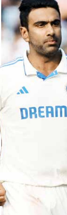
(એજન્સી) ચેન્નાઈ તા 26

ભૂતપૂર્વ ભારતીય ક્રિકેટર રવિચંદ્રન અશ્વિને કહ્યું કે પાકિસ્તાન સામે ટેસ્ટ રમવાનું તેમનું સપનું અધૂરું રહ્યું. તે નાનપણથી જ પાકિસ્તાન સામે ટેસ્ટ રમવા માગતો હતો, પરંતુ કેટલાક કારણોસર તે થઈ શક્યું નહીં. અશ્વિને ગોબીનાથની યુવ્યુબ ચેનલ પર આપેલા ઈન્ટરવ્યૂમાં કહ્યું, 'સદગોપન રમેશને જોઈને મને ક્રિકેટ રમવાની પ્રેરણા મળી. તે તમિલનાડુના પહેલા બેટર હતો જે રમેશ છે આંતરરાષ્ટ્રીય ક્રિકેટમાં કોઈ ડર્થા વિના રન બનાવ્યા હતા. હું સપનામાં પણ પાકિસ્તાન સામેની તેમની ઈન્ડિગ્સને યાદ કરતો હતો.' અશ્વિન ગયા અઠવાડિયે જ નિવૃત્ત થયો હતો 18 ડિસેમ્બરે ભારત અને ઓસ્ટ્રેલિયા વચ્ચે શ્રિલંકા ટેસ્ટ બાદ અશ્વિને નિવૃત્તિ લીધી હતી. તેણે કેપ્ટન રોહિત શર્મા સાથે પ્રેસ કોન્ફરન્સ કરીને નિવૃત્તિની જાહેરાત કરી હતી. 38 વર્ષની ઉંમરે તેણે ભારત માટે 537 ટેસ્ટ વિકેટ લીધી હતી, પરંતુ તેને ક્યારેય પાકિસ્તાન સામે રમવાની તક મળી ન હતી. તે તમિલનાડુના ઘણા ખેલાડીઓને આંતરરાષ્ટ્રીય મંચ પર રન બનાવતા જોયા, પરંતુ દરેકને કોઈને કોઈ સમસ્યાનો સામનો કરવો પડ્યો. તે ચોક્કસપણે પછીથી સ્થાપિત થયા, પરંતુ રમેશ જે રીતે રમ્યા તે રીતે કોઈ ક્રિકેટ રમી શક્યું નહીં. તેમણે વસીમ અકરમ, વકાર યુનિસ અને શોએબ અખ્તર જેવા બોલરો સામે પણ કોઈ ચિંતા કર્યા વિના રન બનાવ્યા. તેમની પાસે હંમેશા શોટ રમવા માટે ઘણો સમય હતો.'