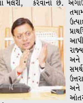
પ્રોત્સાહન અપાવવામાં પણ મદદ કરશે.

મુખ્યમંત્રી પુષ્કર સિંહ ધામી રાજ્યના મલેરી, મુન્સિયારી અને અન્ય વિસ્તારોમાં ટ્વીડથી બનેલા જેકેટ પહેરીને 'વોકલ ફોર લોકલ' અભિયાનને પ્રોત્સાહન આપી રહ્યા છે, તેઓ સતત સરકારી અને રાજકીય કાર્યક્રમોમાં રાજ્યના ઉત્પાદનોમાંથી બનાવેલા કપડાં પહેરતા જોવા મળ્યા હતા. જઈ શકે છે. આ પહેલનો હેતુ રાજ્યના સ્થાનિક ઉત્પાદનોને