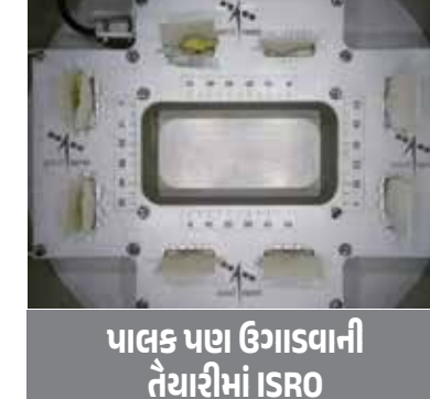
પાલક પણ ઉગાડવાની તૈયારીમાં ISRO

ઈસરોએ 30 ડિસેમ્બરના રોજ શ્રીહરિકોટાથી SpaDeX એટલે કે સ્પેસ ડોડકો એક્સપેરિમેન્ટ મિશન લોન્ચ કર્યું હતું. આ અંતર્ગત PSLV-C60 રોકેટ વડે બે અવકાશયાન પૃથ્વીથી 470 કિમી ઉપર તહેનાત કરવામાં આવ્યા હતા. તેની સાથે મોકલવામાં આવેલ POEM-4 (PSLV ઓર્બિટલ એક્સપેરિમેન્ટલ મોડ્યુલ) પર CROPS (ક્રોપ્સ રિસર્ચ મોડ્યુલ ફોર ઓર્બિટલ પ્લાન્ટ સ્ટડીઝ) અવકાશમાં પ્રથમ વખત જીવનને અંકુરિત કરવામાં સફળતા મળી છે. વિક્રમ સારાભાઈ સ્પેસ સેન્ટર (VSSC) ખાતે ડિઝાઈન કરાયેલા CROPS માત્ર 4 દિવસમાં માર્કોરોવિટીનો ઉપયોગ કરીને