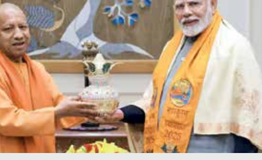
PM સાથે મુલાકાત બાદ, યોગીએ X પર એક પોસ્ટ કરી... મુલાકાત પછી, યોગી આદિત્યનાથે X પર એક પોસ્ટમાં લખ્યું: 'આજે નવી દિલ્હીમાં માનનીય પ્રધાનમંત્રી શ્રી નરેન્દ્ર મોદીજીની સૌજન્ય મુલાકાત લીધી. તમારા માંગદર્શન અને પ્રેરણાથી, શાશ્વત ગૌરવનું પ્રતીક, મહાકુંભ-2025, પ્રયાગરાજ, આજે વિશ્વને તેના દિવ્ય, ભવ્ય અને ડિજિટલ સ્વરૂપમાં 'નવું ભારત' બતાવી રહ્યું છે. શ્રી પ્રધાનમંત્રી, તમારો કિંમતી સમય આપવા બદલ હૃદયપૂર્વક આભાર.'

(એજન્સી) નવી દિલ્હી | તા.10 યુપીના સીએમ યોગીએ દિલ્હીમાં પીએમ મોદી સાથે મુલાકાત કરી હતી. આ દરમિયાન તેમણે વડાપ્રધાનને પ્રયાગરાજ કુંભ મેળામાં આવવાનું આમંત્રણ આપ્યું છે. ઉત્તર પ્રદેશના મુખ્યમંત્રી યોગી આદિત્યનાથે શુક્રવારે દિલ્હીમાં વડાપ્રધાન નરેન્દ્ર મોદી સાથે મુલાકાત કરી હતી. મળતી માહિતી મુજબ સીએમ યોગીએ પીએમ મોદીને પ્રયાગરાજ કુંભ મેળામાં આવવાનું આમંત્રણ આપ્યું છે. મહાકુંભ 13 જાન્યુઆરીથી 26 ફેબ્રુઆરી સુધી ચાલવાનો છે, જેમાં આ વર્ષે 40 કરોડ ભક્તો આવવાની આશા છે. અગાઉ, 30 ડિસેમ્બર, 2024 ના રોજ, સીએમ યોગીએ પ્રયાગરાજ કુંભ મેળામાં રાષ્ટ્રપતિ દ્રૌપદી મુર્મુ અને ઉપરાષ્ટ્રપતિ જગદીપ ધનખર, પૂર્વ રાષ્ટ્રપતિ રામનાથ કોવિંદ, ગુહમંત્રી અમિત શાહ, સંરક્ષણ મંત્રી રાજનાથ સિંહ, ભાજપના રાષ્ટ્રીય અધ્યક્ષ જેપી નંડા, નાણા પ્રધાન નિર્મલા સીતારમણ સાથે મુલાકાત કરી હતી. આવવા આમંત્રણ આપ્યું હતું.