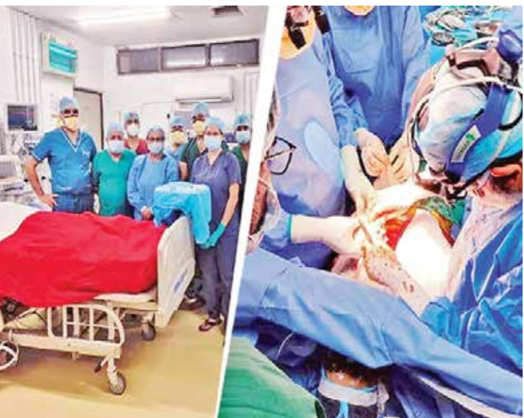
નહતી. પરંતુ, તેમણે 19 વર્ષના દર્દીને હોસ્પિટલ બોલાવી લીધો હતો. બીજી તરફ, સર ગંગારામ હોસ્પિટલના 25 વર્ષના દર્દીને બ્રેન હેમરેજ થયું હતું. 8 જાન્યુઆરીના રોજ દર્દીના પરિવાર તરફથી મંજૂરી મળતા ટ્રાન્સપ્લાન્ટ વિભાગને આ વિશે જાણ કરીને ગ્રીન ક્રીરિડર બનાવવામાં આવ્યો હતો. એક તરફ, આરએમએલ હોસ્પિટલના ઓપરેશન થિયેટરમાં 19 વર્ષના છોકરાનું ઓપરેશન શરૂ કરવામાં આવ્યું હતું. બીજી તરફ, ગંગારામ હોસ્પિટલથી ડોક્ટરોની ટીમ હાર્ટ લઈને નીકળી હતી. 13 કલાકની સર્જરી બાદ 1૯ વર્ષના યુવાનના બીમાર હાર્ટને હટાવીને ૨૫ વર્ષના યુવકનું હાર્ટ લગાવવામાં આવ્યું હતું.

(એજન્સી) નવી દિલ્હી । તા. 10 દિલ્હીની રામ મનોહર લોહિયા હોસ્પિટલના ડોક્ટરોની ટીમે 19 વર્ષના યુવાનને નવજીવન આપ્યું છે. આ ઘટનાએ 3 ડિસેમ્બર, 1967ના રોજ દક્ષિણ આફ્રિકામાં થયેલા પહેલા હાર્ટ ટ્રાન્સપ્લાન્ટની યાદ અપાવી છે. 53 વર્ષીય લૂઈ વોરાકેન્સ્કીને માર્ગ અકસ્માતમાં ગંભીર રીતે ઘાયલ 25 વર્ષીય મહિલાનું હૃદય લગાવવામાં આવ્યું હતું. આ ઘટનામાં 18 દિવસ પછી લૂઈનું મોત થયું હતું. પરંતુ, આશાના કિરણ સમાન કિસ્સા બાદ વિશ્વમાં અનેક સફળ હાર્ટ ટ્રાન્સપ્લાન્ટ કરવામાં આવ્યા છે. રિપોર્ટ મુજબ, 19 વર્ષના યુવાનને હાર્ટ સંબંધિત અનેક પરેશાનીઓ હતી. તેની તકલીફો દિવસે દિવસે વધી રહી હતી. તેને હરવા-ફરવામાં તકલીફ, શ્વાસ થઈ જવો, પેટમાં સોજા, પલ્સમાં વધારો જેવી અનેક તકલીફો હતી. ડોક્ટરોએ તેના માટે યુવાન હાર્ટ શોધી રહ્યાં હતાં. ત્રણેક મહિનાની મહેનત બાદ તેમને સર ગંગારામ હોસ્પિટલમાં એક હાર્ટ હોવાની માહિતી મળી હતી. ઊંચર કેમિકલ તરફથી પરવાનગી મળી