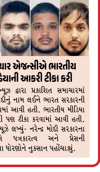
સમાચાર એજન્સીએ ભારતીય મીડિયાની આકરી ટીકા કરી

(એજન્સી) નવી દિલ્હી | તા.10 2023માં કેનેડામાં આતંકવાદી હરદીપ સિંહ નિજ્જરની હત્યાના કેસમાં પરપરક કરાયેલા ચાર ભારતીય આરોપીઓને જામીન મળવાની વાત ખોટી નીકળી છે. કેનેડાની સૌથી મોટી ન્યૂઝ એજન્સી સીબીસી ન્યૂઝે દાવો કર્યો છે કે, ભારતીય મીડિયા સંસ્થાઓ દ્વારા પ્રકાશિત તમામ સમાચાર ખોટા છે. તમામ આરોપીઓને જામીન મળ્યા નથી. જૂન 2023માં શીખ કેનેડિયન હરદીપ સિંહ નિજ્જરની હત્યાના આરોપી ચાર ભારતીય નાગરિકોને તેમની સામેનો કેસ સમાપ્ત થયા પછી સ્ટ્રટીમાંથી મુક્ત કરવામાં આવ્યા છે, સીબીસી ન્યૂઝે ગુરુવારે અહેવાલ આપ્યો હતો, જેમ કે ભારતમાં બહુવિધ મીડિયા આઉટલેટ્સ દ્વારા દાવો કરવામાં આવ્યો હતો. સમાચારમાં, CBCએ ઘણી ભારતીય સમાચાર એજન્સીઓનું નામ લઈને આ દાવો કર્યો છે.