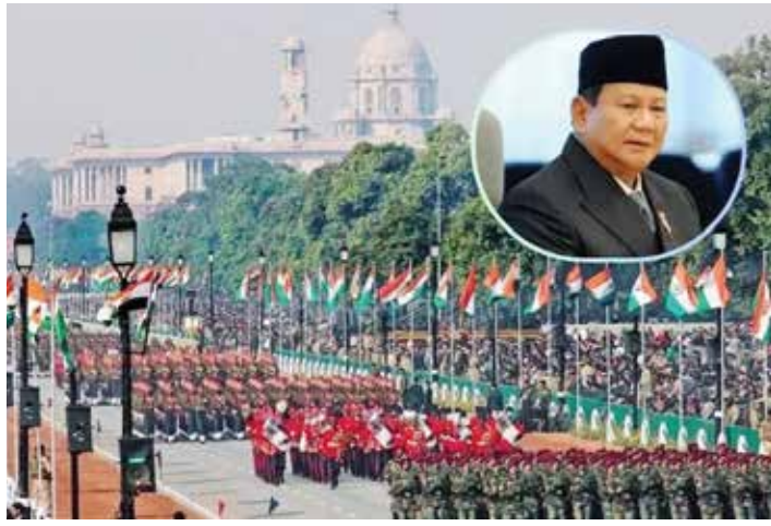
સમસ્યા ઊભી થઈ છે. ભારત સરકાર આ આમંત્રણ આપવામાં ભારતને

દેશ 26મી જાન્યુઆરીએ યોજનાર પ્રજાસત્તાક દિવસની તૈયારીઓમાં વ્યસ્ત છે. મહેમાનોની યાદી તૈયાર છે. કેટલાકને આમંત્રણો પણ મોકલવામાં આવ્યા છે. પ્રજાસત્તાક દિવસની ઉજવણી માટે મુખ્ય મહેમાનનું નામ પણ નક્કી થઈ ગયું છે. આમંત્રણ મોકલવામાં આવ્યું છે. વિશ્વની સૌથી વધુ મુસ્લિમ વસ્તી ધરાવતા દેશના વડા પ્રજાસત્તાક દિવસે મુખ્ય મહેમાન બનશે. ભારત સરકારે ઈન્ડોનેશિયાના રાષ્ટ્રપતિ પ્રબોવો સુબિયાન્તોને પ્રજાસત્તાક દિવસ પર મુખ્ય મહેમાન તરીકે આમંત્રણ આપ્યું છે. જો કે, હજુ સુધી સરકાર દ્વારા કોઈ સત્તાવાર જાહેરાત કરાઈ નથી. અહેવાલો અનુસાર, ઈન્ડોનેશિયાના રાષ્ટ્રપતિને આમંત્રણ આપવામાં ભારતને