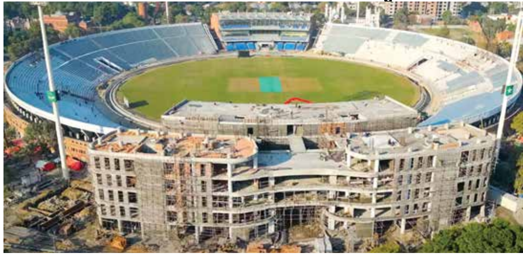
લાહોર તા 10

સ્ટેડિયમ તૈયાર નથી; બાંધકામનો સમયગાળો વધ્યો, PCBએ કહ્યું- સમયસર બની જશે