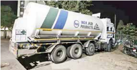
LCBને વિદેશી દારૂ અને બિયરનો જથ્થો આવતો હોવાની ખાતમી હતી

હરિયાણાથી 1354 કિમી કાપી ટ્રુક વલભીપુર પહોંચી, દારૂની 570 ને બિયરની 84 પેટી રંધોળાના બૂટલેગરને ડિલિવરી કરે એ પહોંચી ઝડપાયો ભાવનગર | ભાવનગર લોકલ ક્રાઈમ બ્રાન્ચ (LCB)ની ટીમે વલભીપુર પંથકમાં પેટ્રોલિંગ દરમિયાન મળેલી ચોક્કસ માહિતીના આધારે ચોગઠ રોડ પરથી ઈંગ્લિશ દારૂ-બિયર ભરેલા ટેન્કર સાથે રાજસ્થાનના મારવાડી યુવાનની ધરપકડ કરી છે અને આ અંગે ઉમરાળા પોલીસ સ્ટેશનમાં ફરિયાદ દાખલ કરી છે.