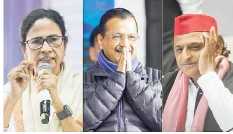
સંજોગોમાં તેનો વીટો વાળી દેવો જોઈએ. ઉમરે સત્તાવાર રીતે ઈન્ડિયા મોરચાનો વીટો વાળવાની વાત કરી છે પણ વાસ્તવમાં તેનો વીટો લોકસભાની ચૂંટણી પછી તરત જ વળી જ ગયો છે. લોકસભાની ચૂંટણી વખતે મમતા બેનરજી તો કોંગ્રેસની સામે હતાં ને પશ્ચિમ બંગાળમાં એકલા હાથે ચૂંટણી લડેલાં. મમતાએ તો થોડા

ભાજપનો ઘબડકો હતો. યુપીમાં ચૂંટણીને સવા બે વરસની વાર છે એ જોતાં ઈન્ડિયા બ્લોકના ઉઠમણાની અત્યારે અસર નહીં પડે, યુપીની ચૂંટણી વખતે કોંગ્રેસ ને સપા પાછાં સાથે બેસી પણ જાય. અરવિંદ કેજરીવાલને કોંગ્રેસના નામથી જ અણગમો છે પણ શરદ પવાર સહિતના નેતા ગમે તે રીતે મનાવીને લઈ આવેલા તેથી કેજરીવાલે લોકસભાની ચૂંટણી વખતે દિલ્હીમાં કોંગ્રેસ સાથે જોડાણ કરેલું જ્યારે પંજાબની તમામ ૧૩ લોકસભા બેઠકો પર આમ આદમી પાર્ટી અને કોંગ્રેસ સામસામે લડ્યાં હતાં. દિલ્હીમાં કોંગ્રેસ સાથે જોડાણ છતાં આમ આદમી પાર્ટી લોકસભાની ચૂંટણીમાં એક પણ બેઠક ના જીતી શકી પછી કેજરીવાલને પણ કોંગ્રેસ સાથે બેસવામાં રસ નહોતો રહ્યો. દિલ્હીમાં તો કેજરીવાલ સર્જન બે વાર જબરદસ્ત બહુમતી સાથે જીત્યા છે એ જોતાં કોંગ્રેસ સાથે જોડાણ કરે એ વાતમાં માલ જ નહોતો. મીડિયાના એક વર્ગમાં એવી વાતો પણ ચાલી રહી છે કે, કોંગ્રેસ અને આમ આદમી પાર્ટી અંદરપાને મળી ગયેલાં છે અને દેખાવ ખાતર જાહેરમાં લડવાનો દેખાવ કરે છે. કેજરીવાલનું રાહુલ-પ્રિયંકા સાથે સેટિંગ છે જ. કોંગ્રેસના ટોચના નેતા અજય માકને કેજરીવાલ દેશવિરોધી હોવાના પુરાવા આપવા માટે પ્રેસ કોન્ફરન્સને વર્તાઈ હતી. સપા-કોંગ્રેસ જોડાણે કરેલા જોરદાર દેખાવાના કારણે ભાજપની બેઠકોમાં સીધો ૩૦નો ઘટાડો થઈ ગયેલો ને ભાજપને સ્પષ્ટ બહુમતી ના મળી તેમાં મુખ્ય કારણ યુપીમાં